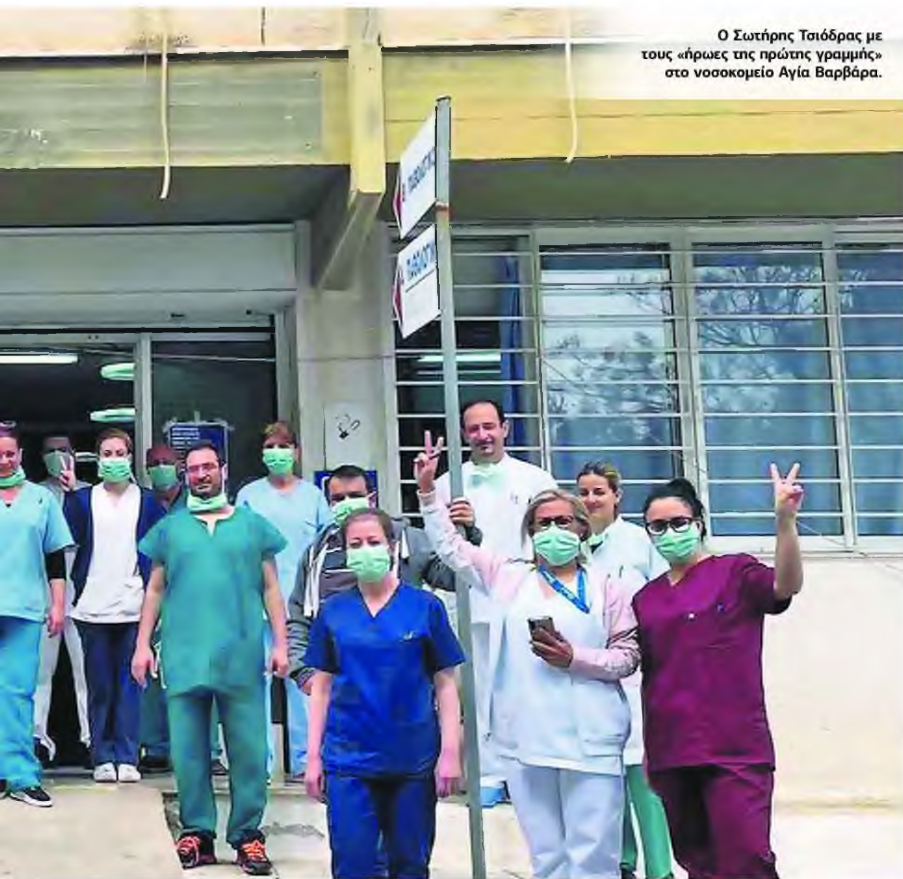
Ο Σωτήρης Τσιόδρας με τους «ήρωες της πρώτης γραμμής» στο νοσοκομείο Αγία Βαρβάρα.

ΕΙΧΑΝ ΛΗΦΘΕΙ ΜΕΤΡΑ», ΛΕΕΙ Ο ΚΑΘΗΓΗΤΗΣ Κ. ΔΑΣΚΑΛΑΚΗΣ