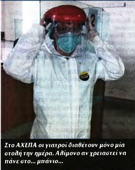
Στο ΑΧΕΠΑ οι γιατροί διαθέτουν μόνο μία στολή την ημέρα. Αλίμονο αν χρειαστεί να πάνε στο... μπάνιο...

«Επιτάξτε τους ιδιώτες, πεθαίνουμε, πού πάνε τα λεφτά του λαού, τόσο καιρό γιατί μας δουλεύει το υπουργείο Υγείας;»