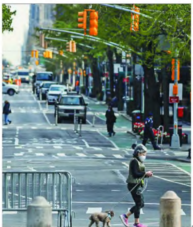
Σε πρώτη φάση στις ΗΠΑ οι μη απαραίτητες μετακινήσεις θα συνεχίζονται να απαγορεύονται και σχολεία, παιδικόι σταθμοί θα παραμείνουν κλειστά.

Αν μια περιοχή εκπληρώνει τα κριτήρια αυτά, μπορεί να προχωρήσει σε μερική άρση των περιορισμών. Στην πρώτη φάση, σχολεία, παιδικόι σταθμοί και κατασκηνώσεις θα παραμείνουν κλειστά, ενώ οι μη απαραίτητες μετακινήσεις θα συνεχίζονται να απαγορεύονται. Το προτεινόμενο όριο των συναθροίσεων θα