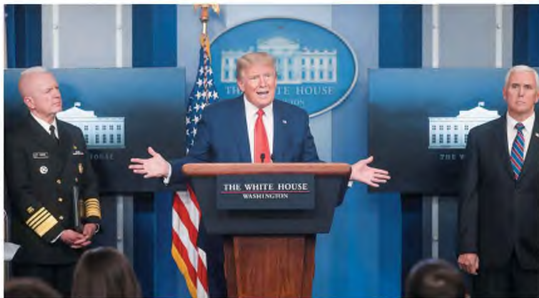
Ο Ντόναλντ Τραμπ στην τακτική ενημέρωσή του Τύπου για την πανδημία, ανάμεσα στον αντιπρόεδρο Μάικ Πενς (δεξιά) και στον υφυπουργό Υγείας, ναύαρχο Μπρετ Τζιρούά.

Ο Ντόναλντ Τραμπ δεν χάνει ευκαιρία να εκδηλώσει την αδημονία του για την επιστροφή σε ομαλούς ρυθμούς οικονομικής δραστηριότητας, παρότι η χώρα του μετρά τα περισσότερα κρούσματα και θύματα από οποιαδήποτε άλλη στον κόσμο. Χθες, τα κρούσματα