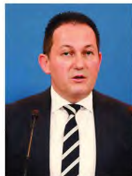
Ο κ. Κ. Πέτσας ανακοίνωσε χθες ότι στις 27 Απριλίου θα ανοίξουν το υποχρηματοκιβώτιο και τα δικαστήρια.

Να βρει τα χρυσά τομιά ανάμεσα στην αναγκαιότητα συνεχούς για κάποιο διάστημα των περιοριστικών μέτρων από τη μία, αλλά και στην ανάγκη επανεκκίνησης της οικονομίας επικρατεί η κυβέρνηση, η οποία σήμερα σε σύσκεψη υπό τον πρωθυπουργό αναμένεται να καταλήξει στο χρονοδιάγραμμα άρσης των μέτρων. Χθες, ο κυβερνητικός