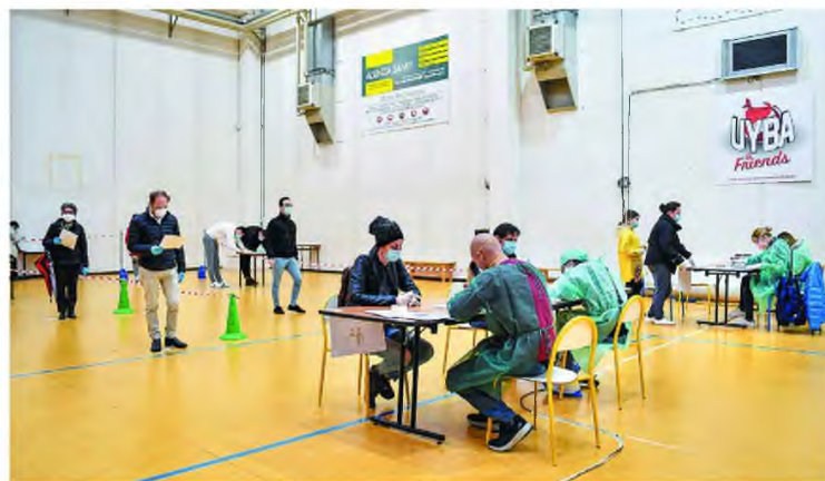
Πολίτες περιμένουν να υποβληθούν σε τεστ, σε ειδικά διαμορφωμένο γυμναστήριο έξω από το Μιλάνο, στην Ιταλία.

Αντιφατικά, όμως, φαίνονται να είναι τα συμπεράσματα μιας μελέτης που πραγματοποιήθηκε από τους επιστήμονες του πανεπιστημίου Στάνφορντ στη Σάντα Κλάρα της Καλιφόρνια. Οι Αμερικανοί επιστήμονες, πραγματοποιώντας τεστ αντισωμάτων, διαπίστωσαν ότι ο πραγματικός