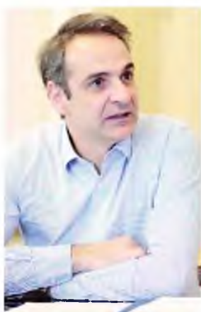
Κυριάκος Μητσοτάκης, πρωθυπουργός Ελλάδας.

Χθες ο πρωθυπουργός Κυριάκος Μητσοτάκης είχε τηλεφωνική συνομιλία με τον Αλβανό