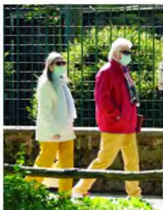
Υποχρεωτική σε όλη τη Γερμανία θα είναι από την επόμενη εβδομάδα η χρήση προστατευτικής μάσκας.

Η Ισπανία έχοντας τον δεύτερο υψηλότερο αριθμό θυμάτων στην Ευρώπη με 21.717 θανάτους, έχει προβεί σε πολύ αυστηρό lockdown, απαγορεύοντας από τα μέσα Μαρτίου ακόμη και στα παιδιά να βγαί-