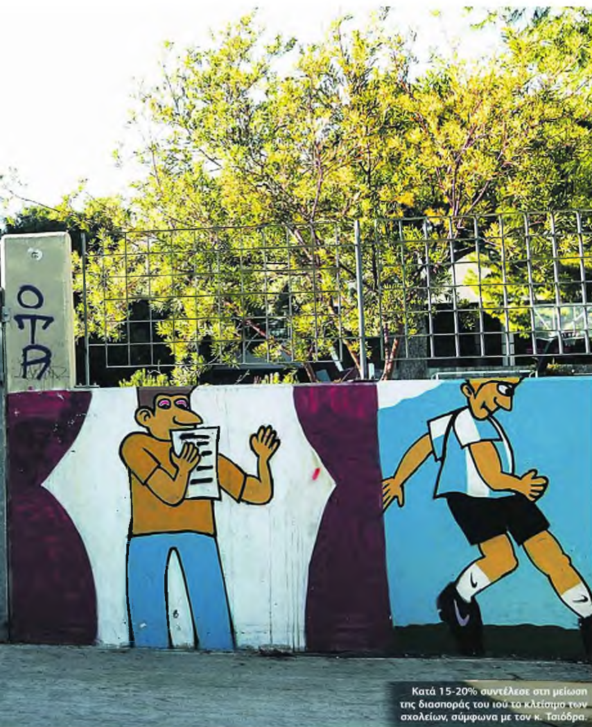
Κατά 15-20% συνέλεξε στη μείωση της διασποράς του ιού το κλείσιμο των σχολείων, σύμφωνα με τον κ. Τσιόδρα.

παιδιά έχει περάσει η νοστροπία της ατομικής υγιεινής, χρήσης αντισηπτικού και πλυσίματος των χεριών. «Θα δείτε ότι όλη αυτή η προστασία θα επιδράσει θετικά και σε άλλες ασθένειες. Εγώ πιστεύω ότι μέρος της μείωσης της γρίπης φέτος οφείλεται στα μέτρα για τον κορονοϊό».