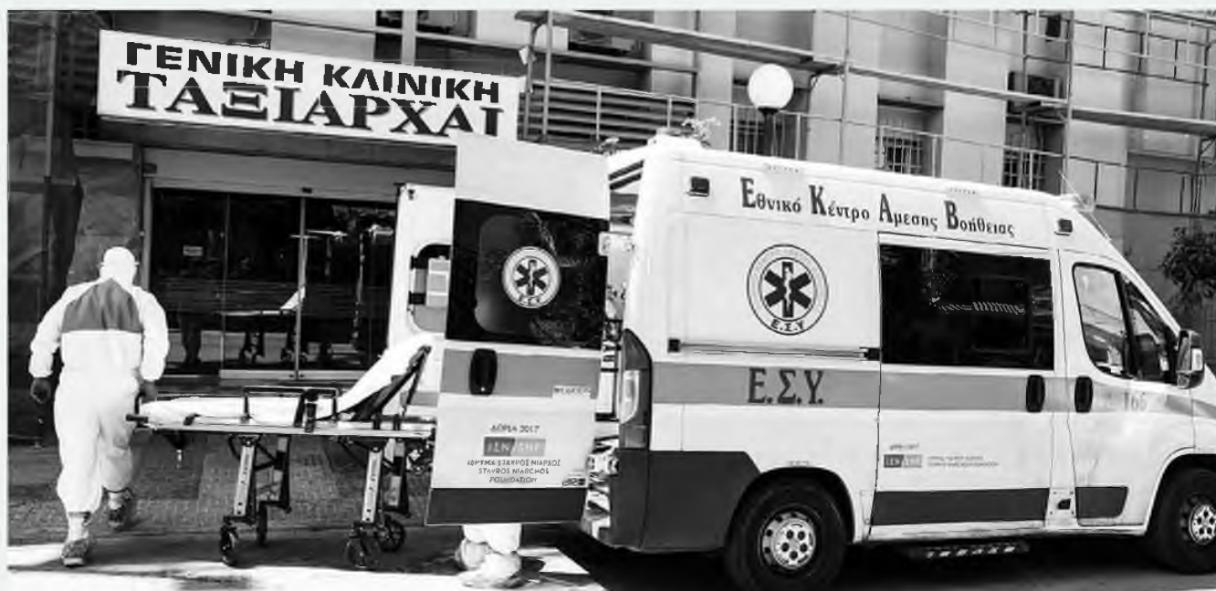
Εισαγγελική έρευνα βρίσκεται σε εξέλιξη για την κλινική «Ταξιάρχαι».

είναι τα συνολικά κρούσματα στη χώρα μας, χθες καταγράφηκαν 11 νέα, καθώς και 4 νέοι θάνατοι (134 συνολικά)