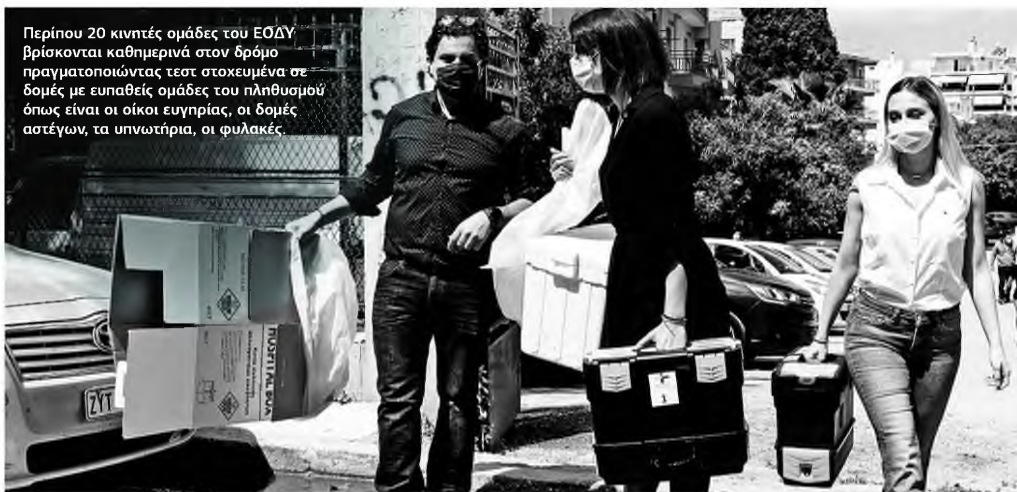
Περίπου 20 κινητές ομάδες του ΕΟΔΥ βρίσκονται καθημερινά στον δρόμο πραγματοποιώντας τεστ στοχευμένα σε δομές με ευπαθείς ομάδες του πληθυσμού όπως είναι οι οικοί ευγηρίας, οι δομές αστέγων, τα υπνωτήρια, οι φυλακές.

ΣΗΜΕΡΑ αναμένεται να δοθούν στη δημοσιότητα οι υγειονομικές προδιαγραφές για τις χρήσεις των χώρων πολιτισμού. Σε τηλεδιάσκεψη που πραγματοποιήθηκε χθες με τη συμμετοχή της ειδικής επιτροπής λοιμωξιολόγων του υπουργείου Υγείας και της υπουργού Πολιτισμού Λίνας Μενδώνη συζητήθηκαν διεξοδικά οι προτάσεις και τα ερωτήματα του ΥΠΠΟΑ επί του θέματος. Η τηλεδιάσκεψη διήρκεσε δύο ώρες. Ακολούθησε, σύμφωνα με πληροφορίες, τηλεφωνική επικοινωνία της κ. Μενδώνη με τον υφυπουργό Πολιτικής Προστασίας και Διαχείρισης Κρίσεων, Νίκο Χαρδαλιά. Το τελικό κείμενο με τις προτάσεις της ειδικής επιτροπής λοιμωξιολόγων πρόκειται να αποσταλεί στο υπουργείο Πολιτισμού σήμερα το πρωί.