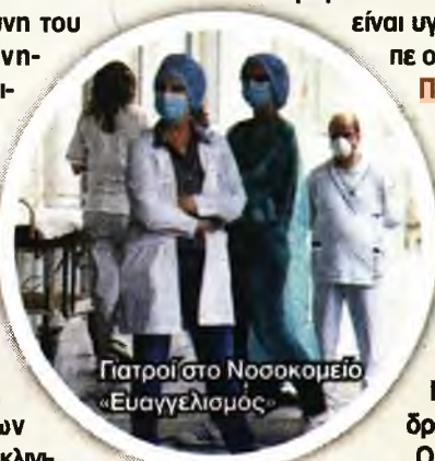
Γιατροί στο Νοσοκομείο «Ευαγγελισμός»

Ο πρόεδρος του Σωματείου Εργαζομένων του νοσοκομείου, Ηλίας Σιώρας, περιέγραψε στο iatropedia.gr την ανησυχία του προσωπικού μετά το πρώτο κρούσμα που καταγράφηκε στον Ευαγγελισμό: «Περιμένουμε όλοι με αγωνία τα αποτελέσματα από δεκάδες δείγματα που έχουν ληφθεί ή θα ληφθούν, μήπως βρεθούν κι άλλοι μολυσμένοι... Αυτό που ζητούσαμε εμείς από καιρό, να γίνεται τακτικός προληπτικός έλεγχος σε όλο το προσωπικό, φαίνεται ότι δικαιωνόμαστε και η υπόσχεση της διοίκησης είναι ότι πλέον θα γίνει έλεγχος σε όλο το προσωπικό».