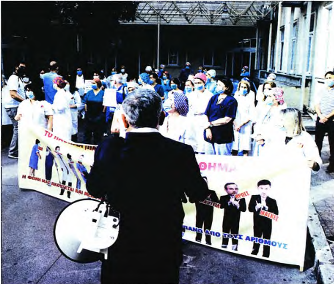
Από τη διαμαρτυρία των νοσηλευτών και νοσηλευτριών στο Νοσοκομείο «Αλεξάνδρα»