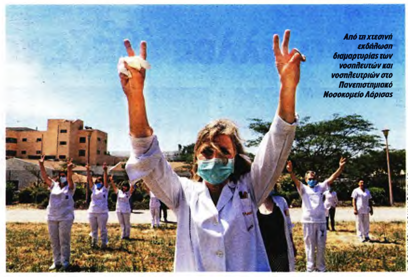
Από τη χθεσινή εκδήλωση διαμαρτυρίας των νοσηλευτών και νοσηλευτριών στο Πανεπιστημιακό Νοσοκομείο Λάρισας

Την ενίσχυση με προσωπικό και επιπλέον χρηματοδότηση ζήτησαν χτες οι εργαζόμενοι στα νοσοκομεία, με αφορμή την Παγκόσμια Ημέρα Νοσηλευτών - Νοσηλευτριών • Καταγγελίες για τη διάσπαση του κλάδου που μεθοδεύει η Ν.Δ.