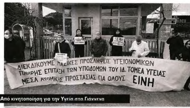
Από κινητοποίηση για την Υγεία στα Γιάννενα

μέρα. Η επανεκκίνηση της λειτουργίας των εξωτερικών ιατρείων με την τήρηση των προϋποθέσεων προστασίας από τον κορονοϊό (ασφαλή χρονική απόσταση μεταξύ των ραντεβού, αποφυγή συγχρωτισμού κ.λπ.) θα οδηγήσει αναπόφευκτα σε παραπέρα μείωση των ασθενών που θα μπορούν να εξετάζονται.