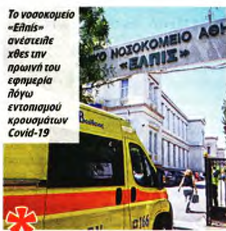
Το νοσοκομείο «Ελπίς» ανέστειλε χθες την πρωινή του εφημερία λόγω εντοπισμού κρουσμάτων Covid-19

Βολές από τον πρόεδρο της ΠΟΕΔΗΝ κατά της Πολιτείας για τον μη έγκαιρο εντοπισμό των κρουσμάτων στα νοσοκομεία