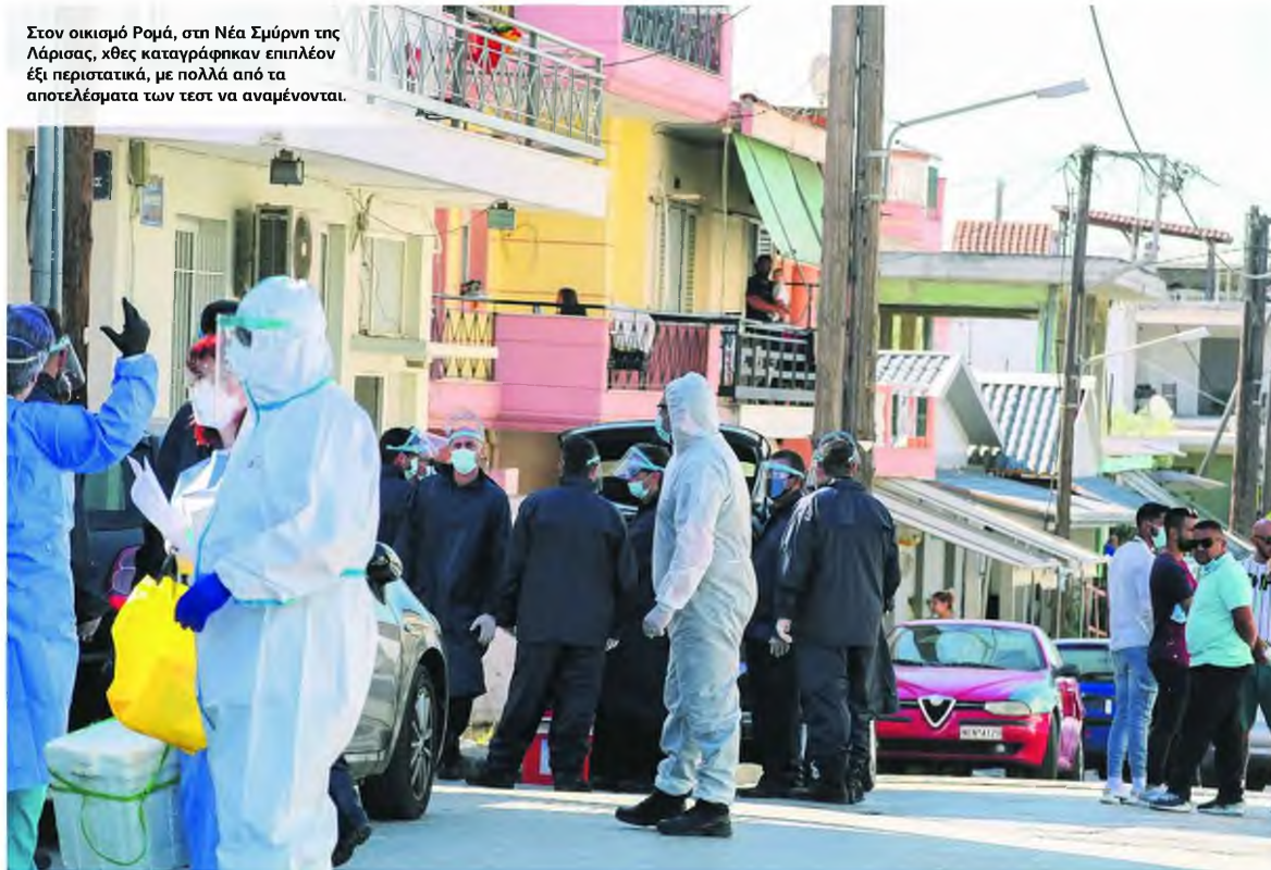
Στον οικισμό Ρομά, στη Νέα Σμύρνη της Λάρισας, χθες καταγράφηκαν επιπλέον έξι περιστατικά, με πολλά από τα αποτελέσματα των τεστ να αναμένονται.