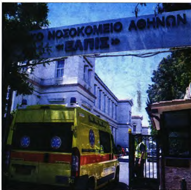
Το Νοσοκομείο Ελπίς στην Αθήνα

Αμεσα μπήκαν σε καραντίνα 25 υγειονομικοί και η κλινική όπου νοσηλεύονταν ο ασθενής, ενώ το προσωπικό άρχισε να υποβάλλεται σε διαγνωστικά τεστ. Ως την Τρίτη, σύμφωνα με τις ίδιες πηγές, είχαν νοσήσει δύο ασθενείς, δύο γιατροί και μία νοσηλεύτρια. Χθες προέκυψε και νέο περιστατικό θετικού