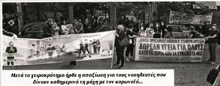
Μετά το χειροκρότημα ήρθε η απαξίωση για τους νοσηλευτές που δίνουν καθημερινά τη μάχη με τον κορωνοϊό...