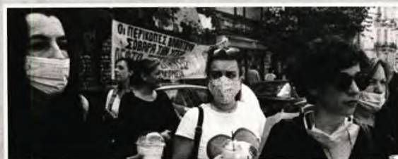
Αυτές οι νοσηλεύτριες αρνούνται να γίνουν ταυτόχρονα και γραμματίες και τραυματιοφορείς και καθαρίστριες και ό,τι άλλο έχει ανάγκη το νοσοκομείο, επειδή δεν γίνονται προσδήψεις...