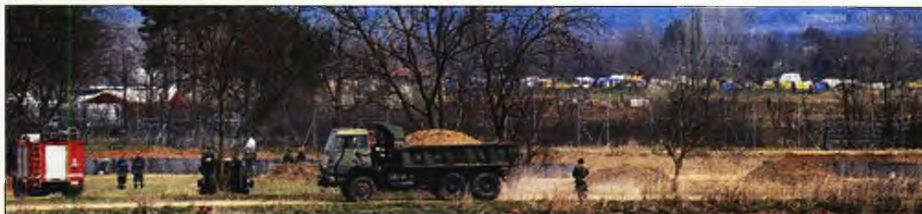
Στήνεται ο νέος φράχτης στον Εβρο, ενώ στο πλαίσιο της οχύρωσης τους επόμενες μήνες θα αναλάβουν υπηρεσία 400 νέοι συνοριοφύλακες, διπλασιάζοντας τη δύναμη αποτροπής εισόδου

νους μήνες θα αναλάβουν υπηρεσία 400 νέοι συνοριοφύλακες, διπλασιάζοντας τη δύναμη αποτροπής εισόδου των αλλοδαπών και ενισχύοντας τις κοινές περιπολίες Στρατού και Αστυνομίας. Επιπλέον, έχουν τεθεί στη διάθεση των δυνάμεων του Στρατού στην περιοχή τα θηριώδη τεθωρακισμένα στρατιωτικά οχήματα που εί-