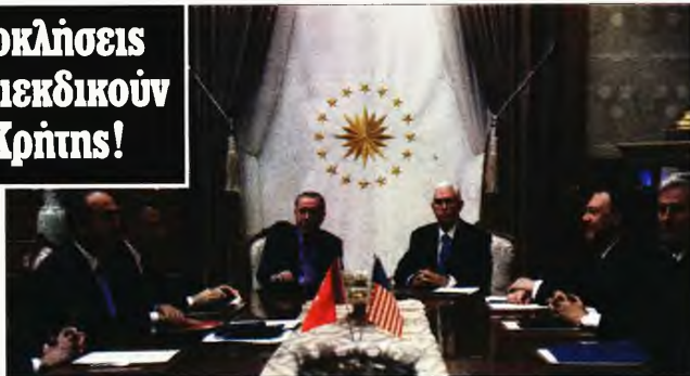
Ταγίπ Ερντογάν και Μεβλούτ Τσαβούσογλου κοινούν το δάχτυλο στην Ε.Ε., παρουσιάζοντας το μαύρο άσπρο

«Αυτή η νοοτροπία, η οποία είναι αδιάρρηκτη απέναντι στις καλοπροαίρετες προσπάθειες της Τουρκίας και παραμένει όμηρος των άδικων και παράνομων αξιώσεων της Ελλάδας και της «ελληνοκυπριακής διοίκησης νοτίου Κύπρου» δεν υπάρχει καμιά πιθανότητα να συμβάλει στην περιφερειακή ειρήνη και σταθερότητα»