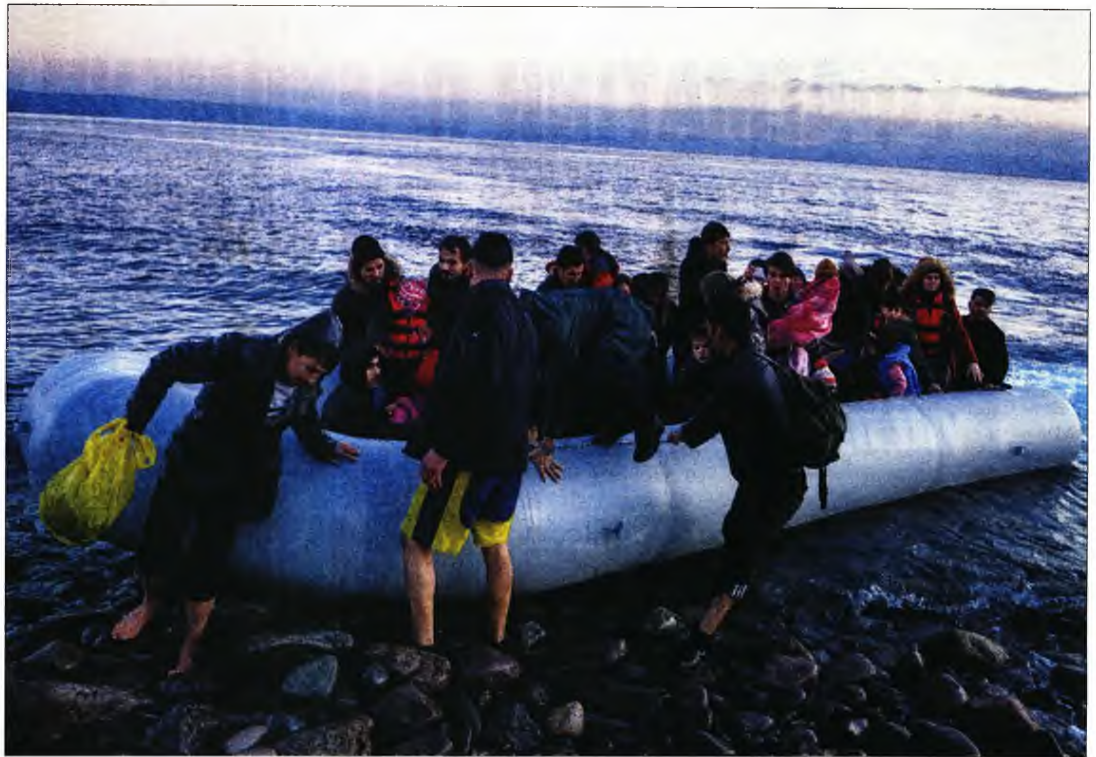
Η Τουρκία συνεχίζει αβάθεκτη την τακτική εργαλειοποίησης της δυστυχίας των προσφύγων και των μεταναστών εις βάρος της Ελλάδας

Η συμπεριφορά της Τουρκίας αντιμετωπίζεται από τις ελληνικές Αρχές με έντονη επιφυλακτικότητα και προβληματισμό. Και αν η Τουρκία δεν αδιαφορεί απλώς για την ανθρώπινη υγεία, για την ανθρώπινη ζωή; Και αν επιδιώκει την εξάπλωση του ιού στην ελληνική επικράτεια, μέσω της αποστολής στη χώρα μας μεταναστών-υγειονομικών βομβών; Κι αν τα κρούσματα των παράνομων μεταναστών στο μέλλον δεν είναι τέσσερα, αλλά πολλαπλάσια; Τότε θα έχουμε να κάνουμε με μια πρωτόγνωρη υβριδική επίθεση, τότε τα περιθώρια ανοχής θα μηδενιστούν, τότε η προστασία των θαλάσσιων και χερσαίων συνόρων μας θα καταστεί θέμα δημόσιας υγείας και, άρα, επιβίωσης του ελληνικού πληθυσμού.