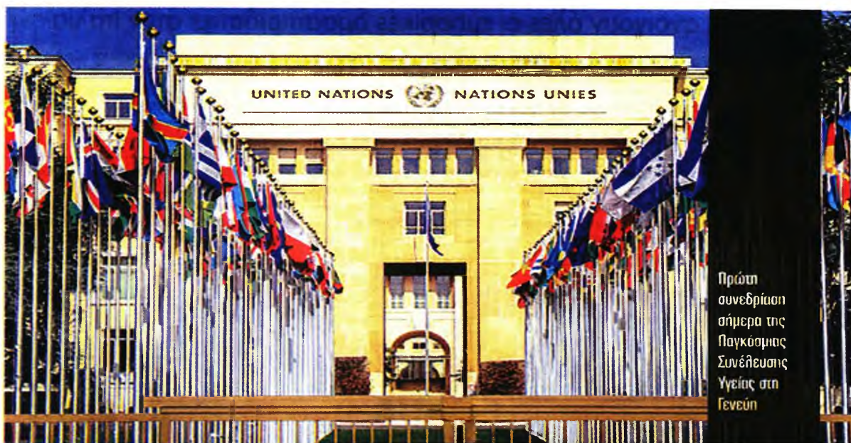
Πρώτη συνεδρίαση σήμερα της Παγκόσμιας Συνέλευσης Υγείας στη Γενεύη

Εκπρόσωποι σχεδόν 200 χωρών θα συγκεντρωθούν σήμερα στη Γενεύη, με τις ΗΠΑ να πιέζουν για συμμετοχή και της Ταϊβάν με καθεστώς παρατηρητή, επικαλούμενες το γεγονός ότι αποτελεί μία από τις λίγες «ιστορίες επιτυχίας» στην αντιμετώπιση της πανδημίας. Στόχος βεβαίως είναι να ενισχυθούν οι ανεπίσημες και επίσημες διπλωματικές σχέσεις της Ταϊβάν (την οποία η Κίνα θεωρεί περιφέρεια της) και να ενταχθεί η πίεση στο Πεκίνο. Η