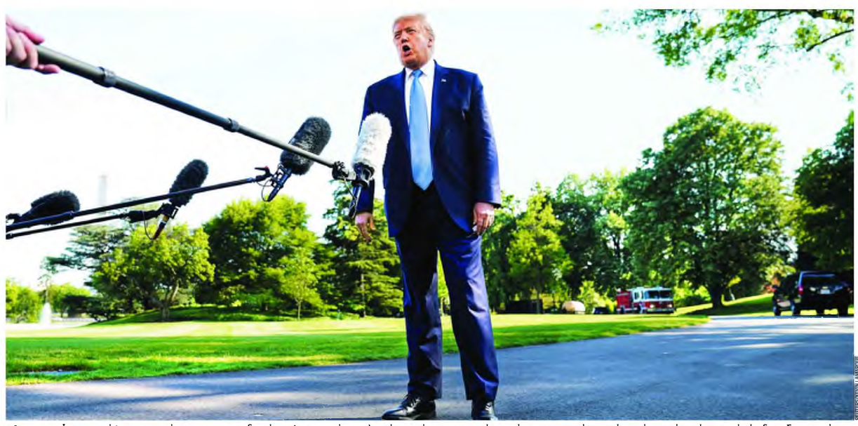
«Δεν μπορώ να επιτρέψω να συνεχίσουν να χρηματοδοτούν οι Αμερικανοί φορολογούμενοι έναν οργανισμό ο οποίος, στην παρούσα κατάσταση του, είναι τόσο σαφές ότι δεν εξυπηρετεί τα συμφέροντα της Αμερικής», αναφέρει ο Ντόναλντ Τραμπ στην επιστολή προς τον επικεφαλής του ΠΟΥ.

Σε έναν άλλο κόσμο, η επίσημη Συνέλευση του Παγκόσμιου Οργανισμού Υγείας (ΠΟΥ) θα έδινε ώθηση στις προσπάθειες για συντονισμένη απάντηση στην πανδημία της COVID-19, που έχει ήδη προκαλέσει περίπου πέντε επιβεβαιωμένα εκατομμύρια κρούσματα, με τους νεκρούς να υπερβαίνουν τις 320.000. Στην πραγματικότητα, συνέβη το ακριβώς αντίθετο: η διήμερη σύνοδος, που ξεκίνησε τη Δευτέρα και ολοκληρώθηκε χθες μέσω τηλεδιάσκεψης, επισκιάστηκε από τη μετωπική σύγκρουση ΗΠΑ - Κίνας, παράλληλες απώλειες της οποίας κινδυνεύουν να αποδειχθούν ο διεθνής Οργανισμός σήμερα κι ο ίδιος ο ΟΗΕ αβύρρο.