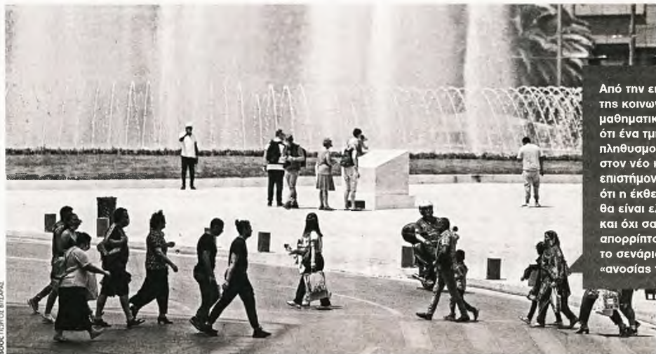
Από την επανεκκίνηση της κοινωνίας είναι μαθηματικά βέβαιο ότι ένα τμήμα του πληθυσμού θα εκτεθεί στον νέο ιό, εν τούτοις επιστήμονες επιμένουν ότι η έκθεση αυτή θα είναι ελεγχόμενη και όχι σαρωτική, απορρίπτοντας το σενάριο της «ανοσίας της αγέλης»

Πιο αναλυτικά, στη Σουηδία η πανδημία έχει προκαλέσει τουλάχιστον 3.700 θανάτους από τον Μάρτιο που καταγράφηκε το πρώ-