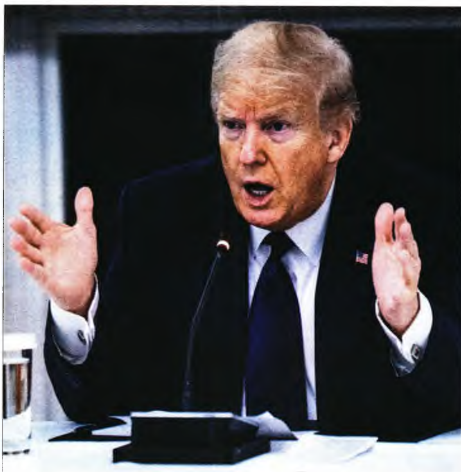
Αυστηρό διάγγελμα του προέδρου των ΗΠΑ Ντόναλντ Τραμπ

μπάχαλο στον Παγκόσμιο Οργανισμό Υγείας, που ολοκλήρωσε χθές τη διήμερη συνέλευση των 194 μελών του, συνεχίζεται. Ο λόγος που η Συνέλευση τελείωσε άκαρπα δεν ήταν άλλος από τη σινοαμερικανική διαμάχη, που μετά το εμπόριο και τις εκατέρωθεν κατηγορίες για την προέλευση και διαχείριση του κορονοϊού, πέρασε και στο τερνόν του ΠΟΥ, με τον Αμερικανό πρόεδρο να χαρακτηρίζει τον Οργανισμό «μαριονέτα της Κίνας», φτάνοντας στο σημείο να απειλεί πως θα βάλει τέλος στη χρηματοδότηση που οι ΗΠΑ του χορηγούν και πως θα εξετάσει το ενδεχόμενο να αποσύρει τη χώρα του από τους κόλπους του. «Εάν ο ΠΟΥ δεν δεσμευθεί σε μεζόνες ουσιαστικές βελτιώσεις εντός των επόμενων 30 ημερών, θα καταστήσω την προσωρινή αναστολή της χρηματοδότησης (σ.σ.: που αποφάσισε τον Απρίλιο) μόνιμη και θα επανεξετάσω το εάν θα παραμείνουμε μέλος του οργανισμού» διημήνυσε ο ένοικος του Λευκού Οίκου στην τετρασέλιδη επιστολή που απηύθυνε στον επικεφαλής του οργανισμού, τον