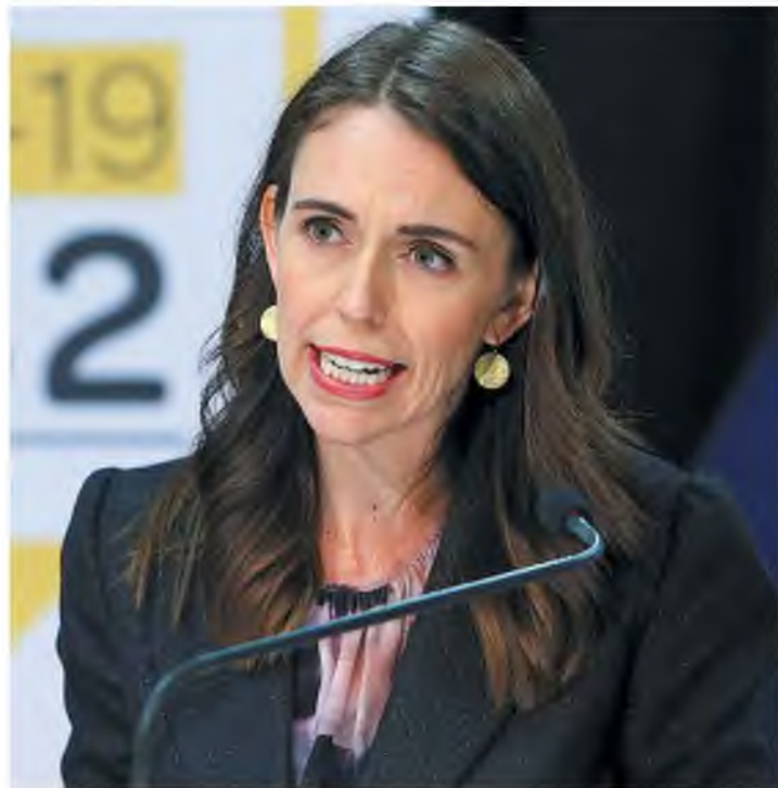
Η πρωθυπουργός της Νέας Ζηλανδίας, Τζασίντα Αρντερν, σε συνέντευξη Τύπου στο Ουέλιγκτον πριν από λίγες μέρες.

Οι γυναίκες στην εξουσία έδειξαν ότι συλλέγουν πολλές πληροφορίες και επιτρέπουν σε άτομα με διαφορετική προέλευση και οπτική να συμμετάσχουν στη λήψη αποφάσεων. Η κυβέρνηση της Αγκελα Μέρκελ έλαβε πλήθος πληροφοριών προτού χαράξει την πολιτική αντιμετώπισης της πανδημίας, επιτυγχάνοντας τελικά πολύ χαμηλά ποσοστά θανάτων. Αντιθέτως, οι ανδροκρατούμενες κυβερνήσεις Σουηδίας και Βρετανίας, που θρηνούν δεκάδες χιλιάδες θανάτους, στηρίχθηκαν ολοκληρωτικά στα επιδημιολογικά μοντέλα των συμβούλων τους, κλείνοντας μάτια και αφτιά σε οποιαδήποτε διαφορετική άποψη. Ο Αμερικανός πρόεδρος Ντόναλντ Τραμπ αρνήθηκε να φορέσει μάσκα, γιατί, όπως σχολίασε ο Συντηρητικός δημοσιογράφος Ντέιβιντ Μάρκος, «επιδεικνυε την αμερικανική ρώμη». Αν φορούσε μάσκα, θα έδειχνε ότι οι ΗΠΑ είναι τόσο αδύναμες μπροστά στον άορατο εχθρό που ήρθε από την Κίνα, ώστε ακόμα και ο πρόεδρος χρειάζεται να καλυφθεί. Η προσέγγιση