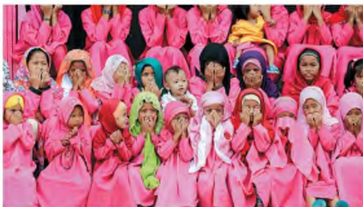
Φωτογραφία αρχείου με παιδιά που προσεύχονται έξω από το ροζ τζαμί στο Νταού Σαούντι Αμπατουάν των Φιλιππίνων.

Σε όλο τον κόσμο καταβάλλονται titάνιες προσπάθειες από την επιστημονική κοινότητα προκειμένου να διευκολυνθούν η διάγνωση, η πρόληψη και η θεραπεία ασθενών με COVID-19. Αμερικαν