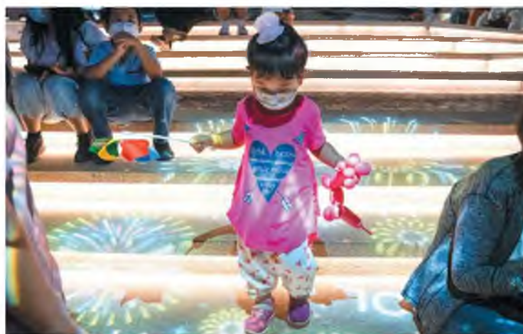
«Οι μάσκες δυσχεραίνουν την αναπνοή, διότι τα νήπια έχουν μικρές αναπνευστικές οδούς», αναφέρουν Ιάπωνες παιδίατροι.

Παιδιατρική Εταιρεία. «Οι μάσκες δυσχεραίνουν την αναπνοή διότι τα νήπια έχουν μικρές αναπνευστικές οδούς, γεγονός που επιβαρύνει την καρδιά τους», αναφέρουν οι Ιάπωνες παιδίατροι, προσθέτοντας ότι σε τόσο μικρά παιδιά η χρήση μάσκας αυξάνει και τον κίνδυνο θερμοπληξίας. «As σταματήσουμε να χρησιμοποιούμε μάσκες σε παιδιά κάτω των δύο ετών», συνιστά η Παιδιατρική Εταιρεία της Ιαπωνίας. Στην ίδια κατεύθυνση βρίσκονται και το αμερικανικό Κέν-