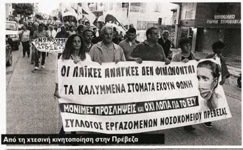
Από τη χτεσινή κινητοποίηση στην Πρέβεζα

Μ ε πολύμορφες αγωνιστικές κινητοποιήσεις, Σύλλογοι Εργαζομένων στα δημόσια νοσοκομεία, Εργατικά Κέντρα, συνδικάτα και μαζικοί φορείς ξεσκεπάζουν το απατηλό κυβερνητικό αφήγημα περί «ενίσχυσης του δημόσιου συστήματος Υγείας», αναδεικνύουν τα ακόμα πιο οξυμένα προβλήματα που αντιμετωπίζουν υγειονομικοί και ασθενείς, επιβεβαιώνουν την ανάγκη να δυναμώσει ο αγώνας για την Υγεία του λαού και για τα δικαιώματα των εργαζομένων που δίνουν καθημερινά τη μάχη για την προστασία της, απέναντι στην πολιτική της εμπορευματοποίησης, της υποστελέχωσης και της υποχρηματοδότησης.