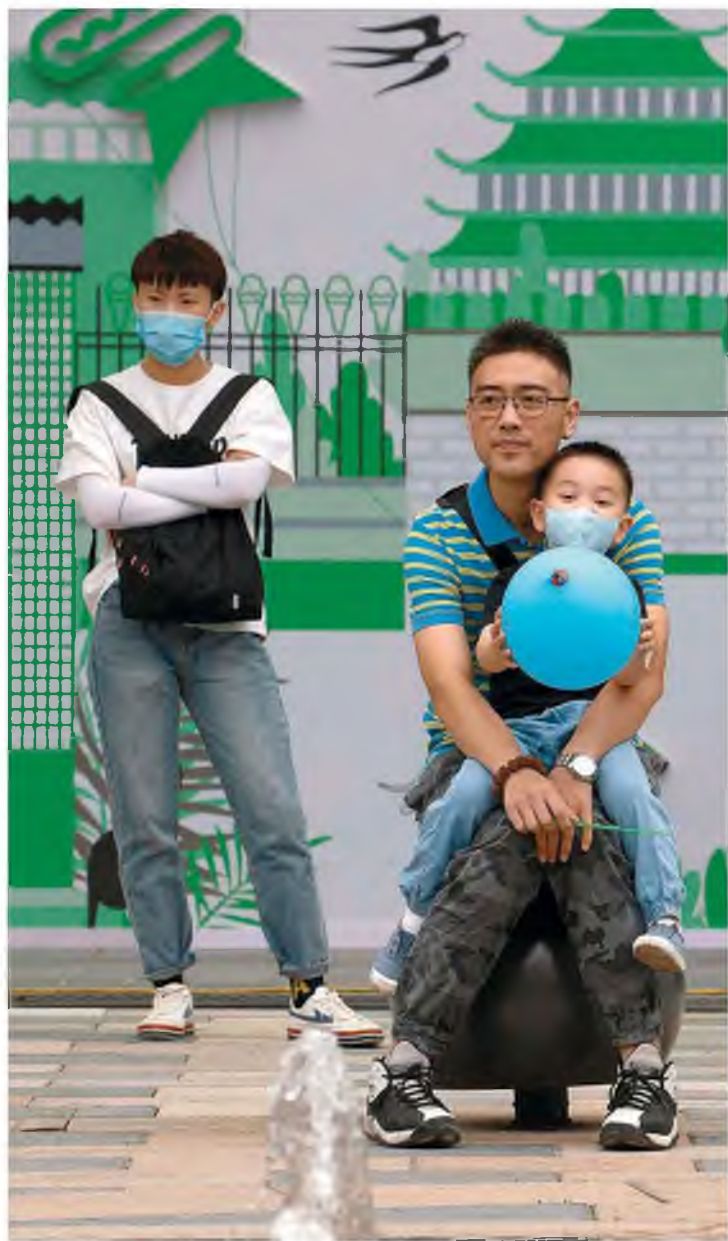
Πατέρας κρατάει τον μικρό γιο του, ο οποίος φοράει μάσκα για να αποτρέψει τη διάδοση του ιού, στο Πεκίνο.

κανό πρόεδρο δεν τεκμηριώνεται από τις σχετικές επιστημονικές μελέτες, αφήνοντας τους ειδικούς να διερωτώνται πού βασίζεται το επιθετικό μάρκετινγκ της συγκεκριμένης ουσίας. Χθες, οι ΗΠΑ προμήθευσαν 2 εκατ. δόσεις του φαρμάκου αυτού στη