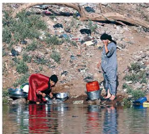
Αιγύπτιες πλένουν πιάτα και άλλα χρηστικά αντικείμενα στον Νείλο.

Περίπου 250 εκατομμύρια άνθρωποι εξαρτούν την επιβίωσή τους από τον Νείλο, τον μακρύτερο ποταμό της Γης, που διατρέχει 11 διαφορετικά κράτη.