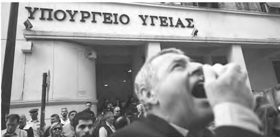
Οραίοι οι αγώνες αλλά για ποιο ακριβώς αίτημα;

Ν αι, ήταν δύσκολες οι ημέρες έξαρσης του κορωνοϊού σ' όλη τη χώρα. Ναι, σ' αυτήν την κατάσταση αναδείχθηκε ο κρίσιμος ρόλος των εργαζομένων στον υγειονομικό τομέα.