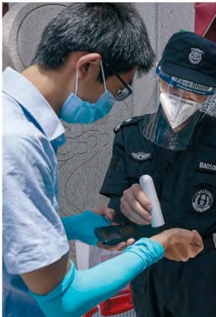
Θερμομέτρηση πολίτη πριν από την είσοδό του στο πανεπιστημιακό νοσοκομείο Γουάν του Πεκίνου για τεστ COVID-19.

ασυμπτωματικοί. Σύμφωνα με αξιωματούχους των υγειονομικών φορέων του Πεκίνου, τα νέα κρούσματα συνδέονται με την αγορά φρούτων και λαχανικών Xinfadi, η οποία έκλεισε άμεσα, ενώ σε πλήρη καραντίνα τέθηκαν 11 συγκροτήματα που συνδέονται με τα κρούσματα και έκλεισαν δημοτικά σχολεία της περιοχής. Την