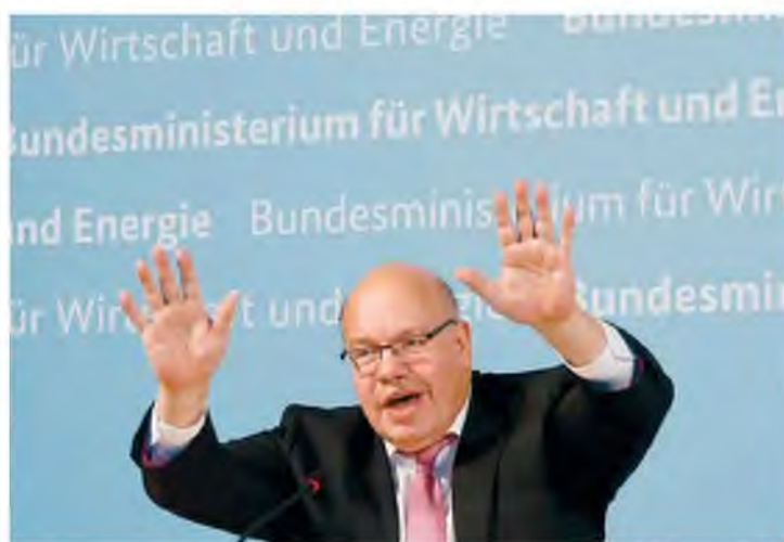
Ο Αλτμπίερ αποχαιρετά τους συμμετέχοντες σε online συνέντευξη Τύπου με στελέχη της CureVac, στο Βερολίνο.

η γερμανική κυβέρνηση θα αποκτήσει το 23% της εταιρείας, έναντι 300 εκατ. ευρώ. Η Ευρωπαϊκή Επιτροπή τους περασμένους μήνες χρηματοδότησε την CureVac με 80 εκατ. ευρώ. Επίσης, ο Αλτμπίερ τόνισε ότι «η Γερμανία δεν είναι προς πώληση, δεν πωλού-