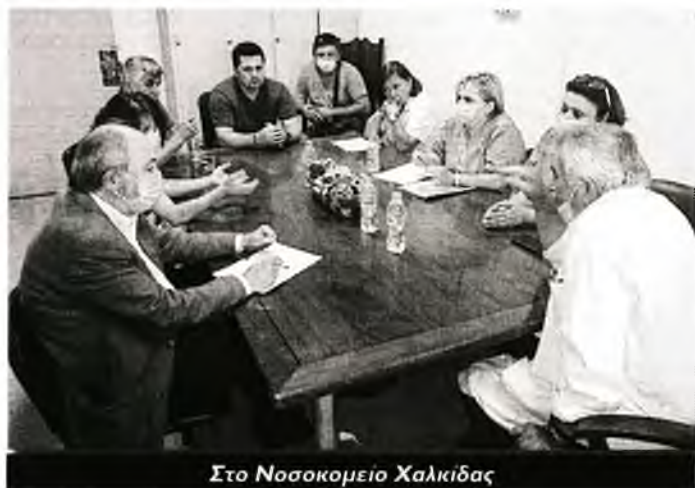
Στο Νοσοκομείο Χαλκίδας

Γιατροί και νοσηλευτές τόνισαν την αγωνία τους για την κατάσταση που επικρατεί και την ανάγκη πρόσληψης μόνιμου προσωπικού για την κάλυψη των κενών θέσεων, σημειώνοντας μάλιστα ότι οι ελλείψεις σε ειδικότητες, όπως αυτή του αναισθησιολόγου, έχουν φέρει το προσωπικό στα όριά του. Μάλιστα τα κενά των οργανικών θέσεων στο Νοσοκομείο Χαλκίδας προσδιορίζονται με το παλιό οργανόγραμμα, στο οποίο δεν περιλαμβάνονται απαραίτητες ειδικότητες,