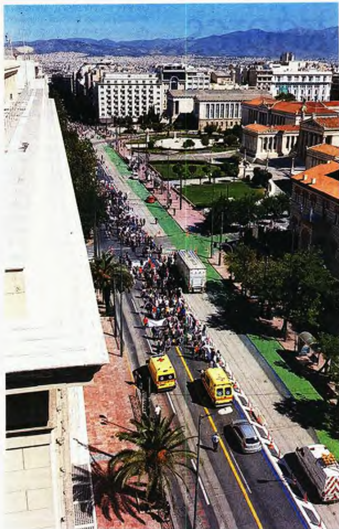
Οδός Πανεπιστημίου. Περίπατος διαδηλωτών πλάι στη χωροθετημένη περιοχή του Μεγάλου Περιπάτου της Αθήνας. Μεγάλη ταλαιπωρία