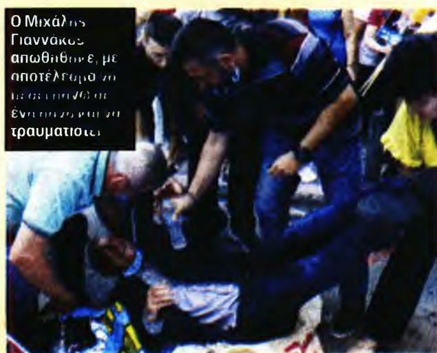
Ο Μιχάλης Γιαννάκος απωθήθηκε, με αποτέλεσμα να έλθει σε ένταξη και να τραυματιστεί.

ΜΕΛΗ της ΠΟΕΔΗΝ, της ΑΔΕΔΥ και της ΠΟΕ-ΟΤΑ πήραν μέρος χθες το πρωί σε διαμαρτυρία έξω από το υπουργείο Οικονομικών, διεκδικώντας την ένταξή τους στα βαρέα και ανθυγιεινά επαγγέλματα. Σύμφωνα με πληροφορίες, στην προσπάθεια των διαδηλωτών να «σπάσουν» τη γραμμή των αστυνομικών έξω από το υπουργείο, ο πρόεδρος της ΠΟΕΔΗΝ, Μιχάλης Γιαννάκος, απωθήθηκε, με αποτέλεσμα να πέσει πάνω σε ένα πανό και να τραυματιστεί. Μέλη της ΠΟΕΔΗΝ επιχείρησαν να σπάσουν τον αστυνομικό κλοιό στην είσοδο του υπουργείου και όταν απωθήθηκαν ο κ. Γιαννάκος έπεσε στο έδαφος και στη συνέχεια του οι