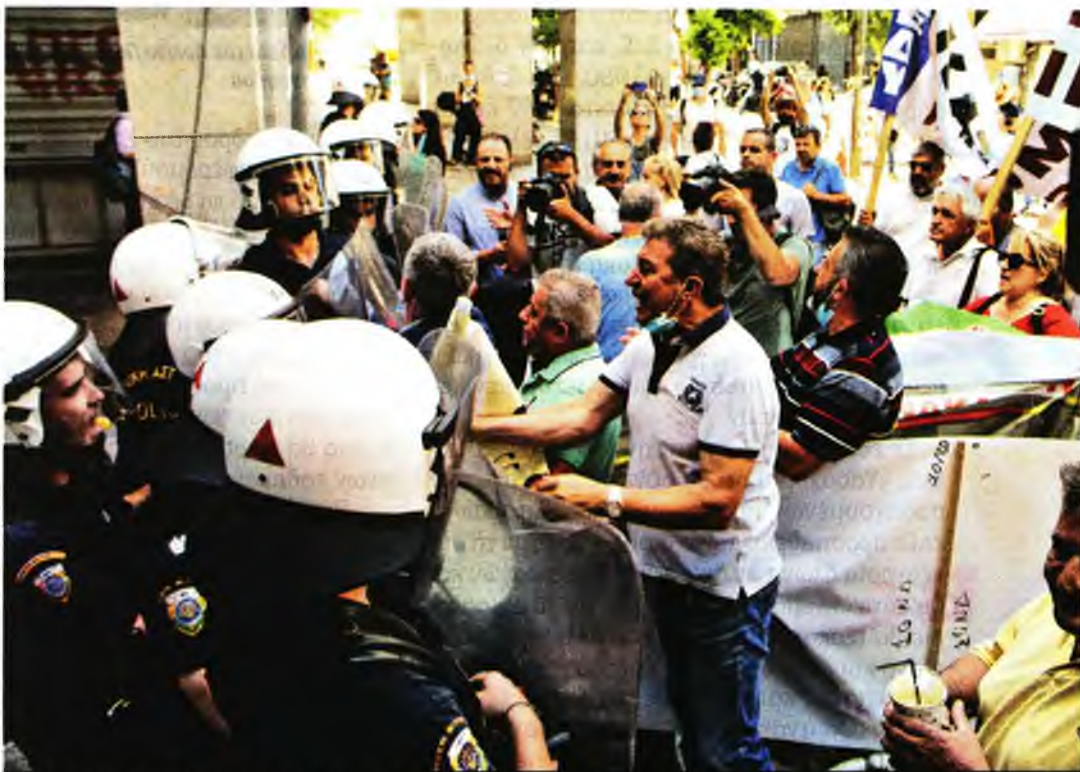
Μέλη της ΠΟΕΔΗΝ, της ΑΔΕΔΥ και της ΠΟΕ-ΟΤΑ έξω από το υπουργείο Οικονομικών λίγο πριν τους... χειροκροτήσουν οι Ματαιζήδες!