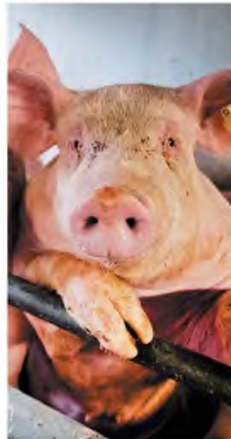
Το νέο στέλεχος της γρίπης των χοίρων, G4 EA H1N1, είναι γενετικός απόγονος του στελέχους H1N1.

Σειρά εξετάσεων έδειξαν, μεταξύ άλλων, ότι η σχετική ανοσία που απολαμβάνουμε από την έκθεσή μας στην εποχική γρίπη, δεν μας προστατεύει καθόλου έναντι του νέου στελέχους, το οποίο προσβάλλει τα κύτταρα του βλεννογόνου των αεραγωγών. Εξετάσεις αντισωμάτων στις οποίες υποβλήθηκαν εργάτες στα σφαγεία, εξάλλου, έδειξαν ότι ένας στους δέκα