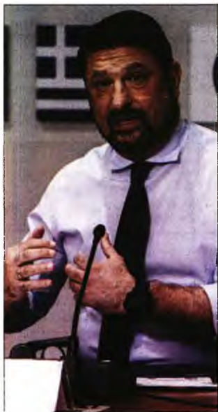
Ο Ν. Χαρδαλιάς στη χθεσινή ενημέρωση