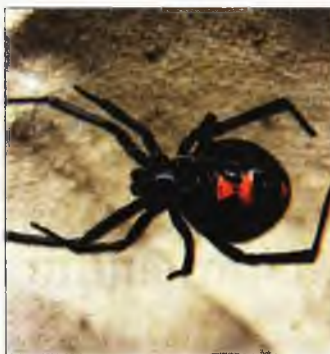
Η αράχνη «μαύρη χήρα»

δη, διευθυντή της Μονάδας Εντατικής Θεραπείας Παιδών του Νοσοκομείου Πάτρας, η κινητοποίηση ήταν άμεση και μέσα σε λίγες ώρες έφτασε από την Αθήνα το αντίδοτο, η χορήγηση του οποίου ήταν μονόδρομος για να σωθεί η ζωή του παιδιού. Ωστόσο, τόνισε πως δεν ήταν εύκολη η διαδικασία, καθώς δεν έχει χορηγηθεί ποτέ σε τόσο μικρό παιδί αντιαραχνικός ορός και οι γιατροί γνώριζαν ότι υπήρχε η πιθανότητα να προκύψουν σοβαρές επιπλοκές από τη χορήγησή του.