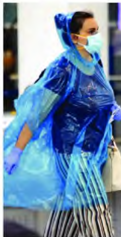
«Καμπανάκι» κρούουν οι επιστήμονες για την υπερμετάδοση του κορονοϊού σε κλειστούς χώρους, όπου ένα άτομο μπορεί να «κολλήσει» και 100 άτομα.

Τα εισαγόμενα κρούσματα ειδικά από τις χώρες των Βαλκανίων έχουν θορυβήσει την κυβέρνηση, που ψάχνει τρόπους να ανακόψει την εισροή τους στην Ελλάδα. Για το λόγο αυτό η Πολιτική Προστασία εξέδωσε εντολή ότι, από Τρίτη 28 Ιουλίου, όσα άτομα μπαίνουν στη χώρα μας αεροπορικά από Βουλγαρία και Ρου-