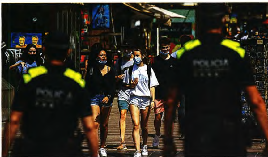
Ο ΠΟΥ κρούει τον κώδωνα κινδύνου με τα καταγεγραμμένα κρούσματα κορωνοϊού να ξεπερνούν τα 16 εκατομμύρια, ενώ ημερησίως προστίθενται στη λίστα 280.000 νέα

Ειδικότερα, οι ερευνητές του King's College διαπιστώνουν με ανωμία ότι «εάν το 1% από τους τουλάχιστον 290.000 ανθρώπους που έχουν υποστεί λοίμωξη Covid-19 στη Βρετανία