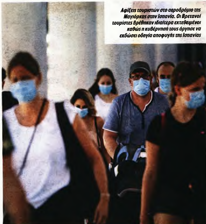
Αφίξεις τουριστών στο αεροδρόμιο της Μαγιόρκας στην Ισπανία. Οι Βρετανοί τουρίστες βρέθηκαν ιδιαίτερα εκτεθειμένοι καθώς η κυβέρνησή τους άργησε να εκδώσει οδηγία αποφυγής της Ισπανίας

Την περασμένη βδομάδα η Ισπανία κατέγραψε 12.166 νέα κρούσματα του