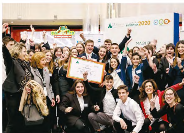
Η ομάδα «Ecowave» πανηγυρίζει τη βράβευσή της. Καταλυτικό ρόλο στην εντυπωσιακή πορεία της έπαιξε ο εντοπισμός πρώτης ύλης προς αντικατάσταση του πλαστικού στο ρολό που χρησιμοποιείται στις ιατρικές πράξεις.