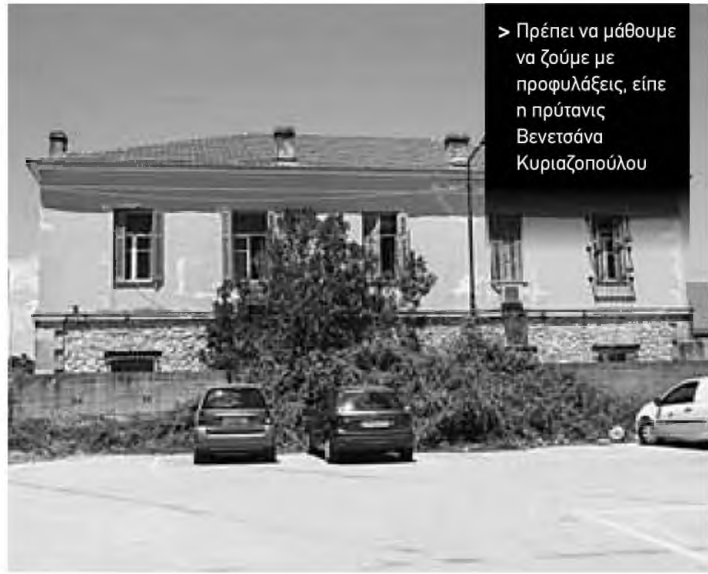
Υπάλληλοι και συναλλασσόμενοι «ψάχνονται», μετά τα τελευταία νέα. Και βέβαια όλοι όσοι ήρθαν σε επαφή μαζί τους, που δεν είναι και λίγοι

Τ α τέσσερα περιστατικά που νοσηλεύονται αφορούν τον 70χρονο που νοσηλεύεται στη Μονάδα Εντατικής Θεραπείας και τη σύζυγό του που νοσηλεύεται στην Οφθαλμολογική Κλινική και οι οποίοι διατηρούν κατάσταση στην Πάτρα. Τα άλλα δύο κρούσματα, που επίσης νοσηλεύονται στην Οφθαλμολογική Κλινική είναι ο υπάλληλος της ΔΕΑΥΠ και η κόρη του φοιτήτρια του Βιολογικού Τμήματος του Πανεπιστημίου Πατρών, όπως ανακοίνωσε η πρύτανης. Τα άλλα τέσσερα κρούσματα είναι η σύζυγος και ο γιος του υπαλλήλου της ΔΕΑΥΠ που νοσηλεύονται κατ' οίκον, ο φοιτητής που είχε διαγνωστεί την περασμένη εβδομάδα κι ένας ακόμα υπάλληλος ΔΕΑΥΠ. «Αναμένουμε πλέον τα αποτελέσματα για τα 80 δείγματα που έχουμε πάρει από τη ΔΕΑΥΠ ώστε να δούμε τον βαθμό εξαπλώσεως του ιού» μας είπε ο διοικητής της όλης Υγειονομικής Περιφέρειας Γιάννης Καρβέλης. Ο ίδιος πάντως πρόσθεσε: «Ο ιός έχει εξαπλωθεί πλέον στην κοινότητα. Αυτό σημαίνει ότι πρέπει με απόλυτη αυστηρότητα να τηρούμε όλους τους κανόνες πρόληψης και τους οποίους δυστυχώς η καθημερινότητα δείχνει ότι έχουμε ξεχάσει και αγνοούμε πλήρως. Αυτό σημαίνει ότι η χρήση της μάσκας ως κλειστού χώρου είναι επιβεβλημένη. Το καλό πλύσιμο των χεριών παραμένει βασικός κανόνας. Να αποφεύγουμε τις συγκεντρώσεις και τον συγχροτισμό με πολλά άτομα. Υπάρχουν και ασυμπτωματικοί ασθενείς ανάμεσα μας». Ο κ. Καρβέλης τόνισε ότι οι υγειονομικές μας μονάδες είναι σε πλήρη επιχειρησιακή ετοιμότητα.