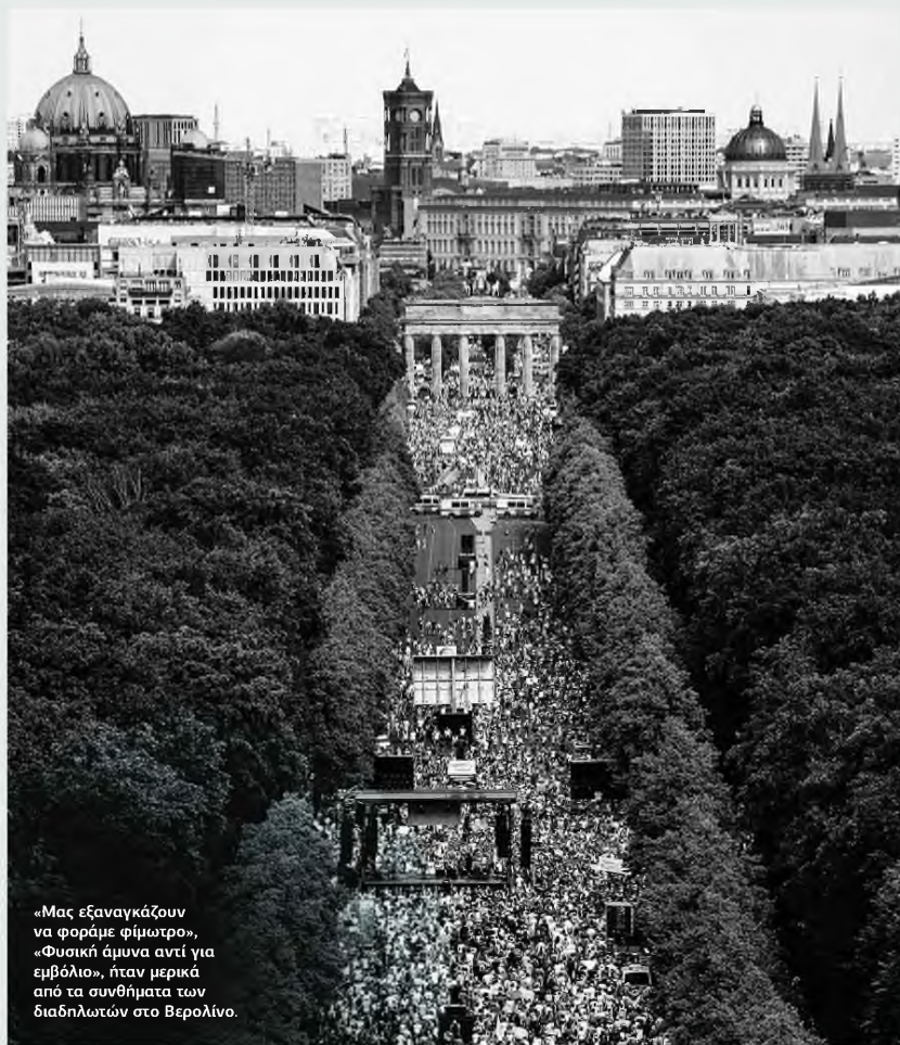
«Μας εξαναγκάζουν να φοράμε φέμωτρο», «Φυσική άμυνα αντί για εμβόλιο», ήταν μερικά από τα συνθήματα των διαδηλωτών στο Βερολίνο.