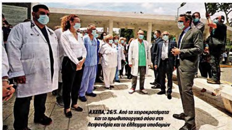
ΑΧΕΠΑ, 26/5. Από τα χειροκροτήματα και το πρωθυπουργικό σόου στη ηψιφονδρία και το έλλειμμα υποδομών

«Σε κατάσταση συναγερμού ήταν την Παρασκευή 31 Ιουλίου το «Ιπποκράτειο» Θεσσαλονίκης, το οποίο εφημέρευε λόγω κορονοϊού. Στο νοσοκομείο καταγράφηκε η χειρότερη ημέρα με περιστατικά κορονοϊού από κάθε άλλη φορά, περιλαμβανομένων και των ημερών κορύφωσης της πανδημίας. Πρόκειται για χτύπημα καμπάνας για την Πολιτική Προστασία σχετικά με τη χαλάρωση που υπάρχει». Ο κ. Γιαννάκος εξήγησε ότι την Παρασκευή «προσήλθαν στην εφημερία και εξετάστηκαν 100 ύποπτα κρούσματα. Τα μισά περίπου από τον γνωστό γάμο. Ευτυχώς τα περιστατικά δεν χρειάστηκαν νοσηλεία. Αναμένονται ακόμα τα αποτελέσματα από πολλούς συμμετέχοντες στον συγκεκριμένο γάμο. Προξενεί εντύπωση ότι πήραν μοριακό αναλυτή από το «Ιπποκράτειο» και τον πήγαν στο Νοσοκομείο της Ξάνθης και πανηγύριζαν. Το Νοσοκομείο της Ξάνθης έπρεπε να είχε από την αρχή μοριακό αναλυτή καινούργιο (αφού είχε τόσα κρούσματα) και όχι να μεταφέρουν το μηχάνημα του μεγαλύτερου νοσοκομείου της Θεσσαλονίκης. Τώρα είναι αναγκασμένοι να στείλουν δείγματα στο ΑΧΕΠΑ και να βγαίνουν τα αποτελέσμα-