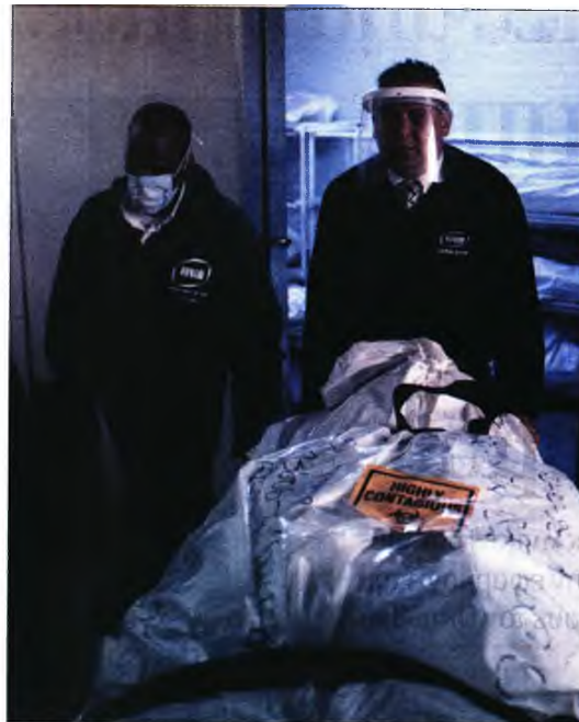
Νεκρός από κορονοϊό μεταφέρεται με προσοχή από υπαλλήλους νεκροτομείου

Ο υπουργός Υγείας της Ισπανίας Σαλβαδόρ Ιλα ήταν πιο επιφυλακτικός. Αν και παραδέχτηκε ότι