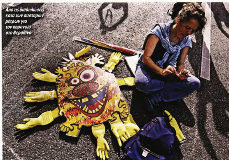
Από τις διαδηλώσεις κατά των αυστηρών μέτρων για τον κορονοϊό στο Βερολίνο

Όπως μάλιστα προβλέπουν τα Κέντρα Πρόληψης και Ελέγχου Νοσημάτων (CDC), με αυτούς τους ρυθμούς οι νεκροί θα ξεπεράσουν τις 173.000 ως τις 22 Αυγούστου. Παρ' όλα αυτά, ο πρόεδρος Ντόναλντ Τραμπ, ο οποίος ζει στο δικό του παρά-