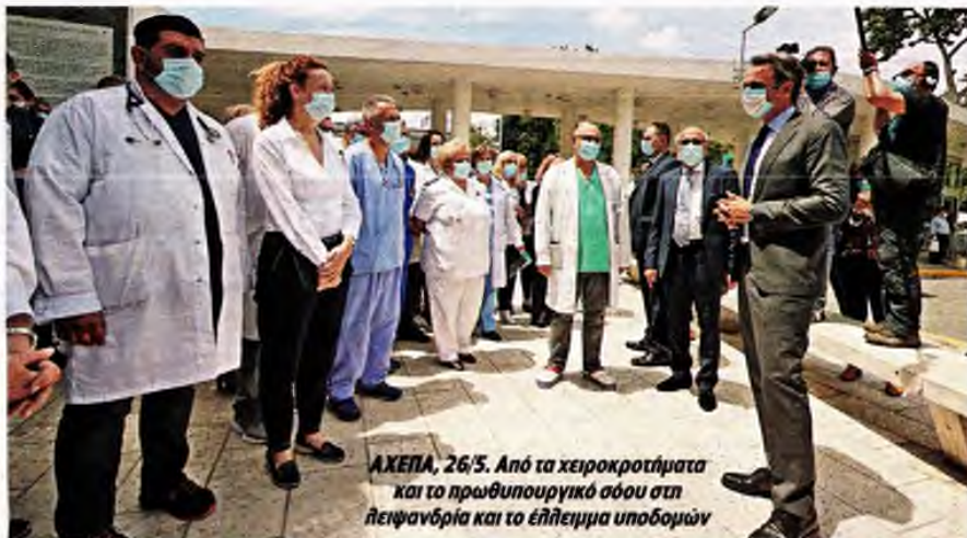
ΑΧΕΠΑ, 26/5. Από τα χειροκροτήματα και το πρωθυπουργικό σόου στη Πειψανδρία και το έλλειμμα υποδομών

«Σε κατάσταση συναγερμού ήταν την Παρασκευή 31 Ιουλίου το «Ιπποκράτειο» Θεσσαλονίκης, το οποίο εφημέρευε λόγω κορονοϊού. Στο νοσοκομείο καταγράφηκε η χειρότερη ημέρα με περιστατικά κορονοϊού από κάθε άλλη φορά, περιλαμβανομένων και των ημερών κορύφωσης της πανδημίας. Πρόκειται για χτύπημα καμπάνας για την Πολιτική Προστασία σχετικά με τη χαλάρωση που υπάρχει». Ο κ. Γιαννάκος εξήγησε ότι την Παρασκευή «προσήλθαν στην εφημερία και εξετάστηκαν 100 ύποπτα κρούσματα. Τα μισά περίπου από τον γνωστό γάμο. Ευτυχώς τα περιστατικά δεν χρειάστηκαν νοσπλεία. Αναμένονται ακόμα τα αποτελέσματα από πολλούς συμμετέχοντες στον συγκεκριμένο γάμο. Προξενεί εντύπωση ότι πήραν μοριακό αναλυτή από το «Ιπποκράτειο» και τον πήγαν στο Νοσοκομείο της Ξάνθης και πανηγύριζαν. Το Νοσοκομείο της Ξάνθης έπρεπε να είχε από την αρχή μοριακό αναλυτή καινούργιο (αφού είχε τέσα κρούσματα) και όχι να μεταφέρουν το μηκάνημα του μεγαλύτερου νοσοκομείου της Θεσσαλονίκης. Τώρα είναι αναγκασμένοι να στείλουν δείγματα στο ΑΧΕΠΑ και να βγαίνουν τα αποτελέσμα-