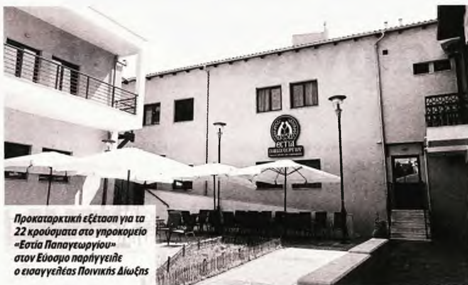
Προκαταρκτική εξέταση για τα 22 κρούσματα στο γηροκομείο «Εστία Παπαγεωργίου» στον Εύοσμο παρήγγειλε ο εισαγγελέας Ποινικής Δίωξης

Μπορεί να επανέρχεται στην κανονική του λειτουργία το νοσοκομείο ΑΧΕΠΑ, που