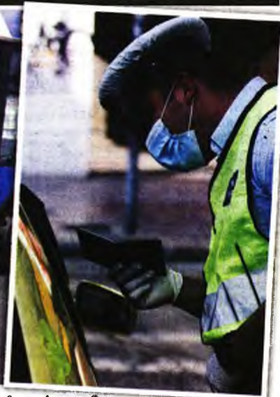
Αστυνομικοί μόλις έχουν εντοπίσει επιβάτη λεωφορείου που δεν φοράει μάσκα, κατά τους ελέγχους που έγιναν χθες στο λεκανοπέδιο

«ΠΙΟΝΟΚΕΦΑΛΟ» συνεχίζουν να προκαλούν σε υγειονομικούς υπαλλήλους και αστυνομικούς τα ολοένα αυξανόμενα κρούσματα του κορονοϊού. Χθες τα κρούσματα που ανακοίνωσε ο ΕΟΔΥ έφτασαν πάλι τα 269, όπως ακριβώς και την Τρίτη, ωστόσο δεν καταγράφηκε νέος θάνατος, οπότε ο αριθμός των θημάτων παραμένει στα 235.