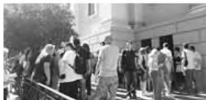
Η δημοτική αρχή βρέθηκε κατηγορούμενη από την αντιπολίτευση χθες

Στα δικαστήρια της Πάτρας, βρέθηκαν χθες για μια ακόμα φορά, δεκάδες συμβασιούχοι του δήμου, που ζητούν παράταση των συμβάσεών τους, ακόμα και μοιροποίηση.