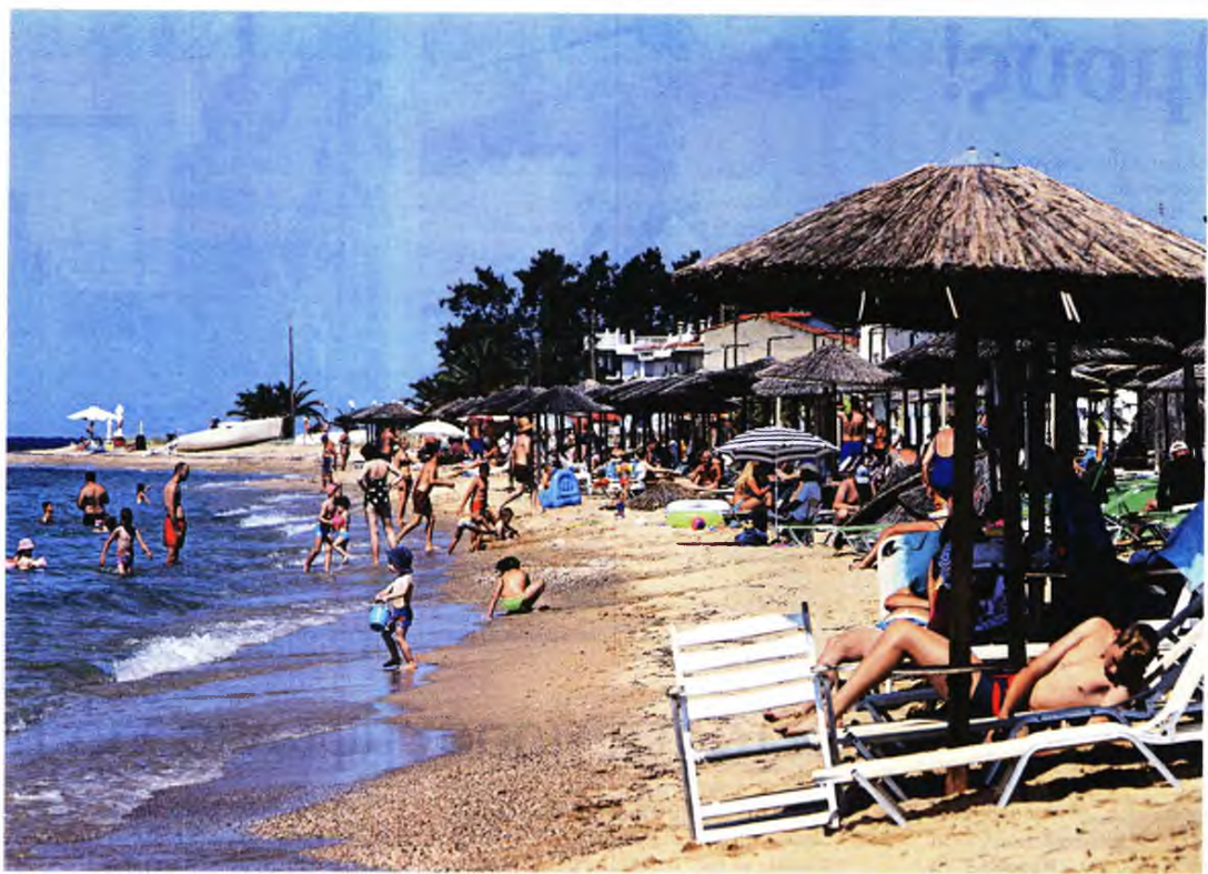
ΜΟΤΙΟΝΤΕΑΜ / ΒΕΡΒΕΡΙΩΤΗΣ ΒΑΣΙΛΗΣ