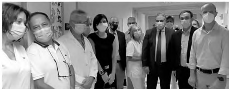
Οι δωρητές μαζί με τη διοίκηση της υγείας στην περιοχή και στελέχη του Πανεπιστημιακού Νοσοκομείου

Της ΜΑΡΙΝΑΣ ΡΙΖΟΓΙΑΝΝΗ rizogianni@pelop.gr