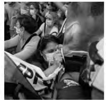
Εύλο με τα κλομπ σε ειρηνικές νοσηλεύτριες - μανάδες. Βία και καταστολή το νέο δόγμα Μπτσστάκη

άεργοι αλήτες και κακοποιά στοιχεία που σπάνε και καίνε την Αθήνα για πλάκα. Άλλωστε, μας τρώνε τ' αυτιά καθημερινά στα παράθυρα των τηλεοράσεων, ο υπουργός Υγείας Κικιλίας και άλλοι υπουργοί, για το πόσο απαραίτητοι είναι στον κλάδο της υγείας, πως λείπουν 5.000 από βασικές ειδικότητες και πως πρέπει να προσληφθούν κι άλλοι 9.000 ακόμη για να μπορεί να λειτουργεί το ΕΖΥ έστω στις χαμηλές του ταχύτητες.