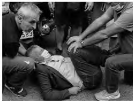
Ο πρόεδρος της ΠΟΕΔΗΝ χτυπημένος απ' τα ΜΑΤ της κομμουνιστικής παράταξης που υπηρετεί ως συνδικαλιστής, στο οδόστρωμα

Παράταση των συμβάσεών τους, για να εργαστούν και τίμια να πληρώσουν φόρους, λογαριασμούς και φροντιστήρια των παιδιών τους ζήτησαν, δεν ήταν