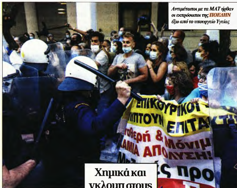
Αντιμέτωποι με τα ΜΑΤ ήρθαν οι εκπρόσωποι της ΠΟΕΔΗΝ έξω από το υπουργείο Υγείας

«Γι' αυτό τονίζουμε πόσο σημαντικό είναι ο εμβολιασμός μετά τις 20 Οκτωβρίου, πρώτα για τις ευπαθείς ομάδες και μετά, σιγά σιγά, και για τους υπολοίπους» κατέληξε η πρόεδρος της ΕΙΝΑΠ.