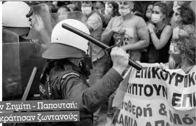
Ένα άνδρας των ΜΑΤ απέναντι σε κάθε διαδηλωτή. Όσοι οι διαδηλωτές τόσο και οι άνδρες των ΜΑΤ

Το νέο δόγμα Κούλη - Κικιλία, ίδιο με των Σημίτη - Παπουτσιά: Εύλο από τα ΜΑΤ σε γιατρούς που μας κράτησαν ζωντανούς