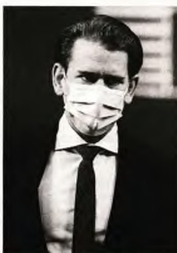
Σε καραντίνα η πρόεδρος της Ευρωπαϊκής Επιτροπής, Ούρσουλα φον ντερ Λάιεν, και ο καγκελάριος της Αυστρίας, Σεμπάστιαν Κουρτς.