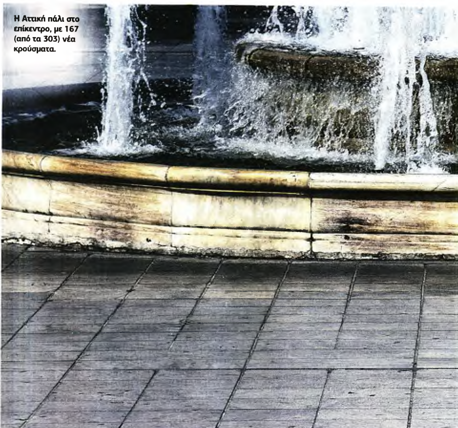
Η Αττική πάλι στο επίκεντρο, με 167 (από τα 303) νέα κρούσματα.

ΣΕ ΣΗΜΑΝΤΙΚΟ «εργαλείο» δύναται να αποδειχθεί χάρτινο τεστ για την Covid-19 που αναπτύσσει ομάδα επιστημόνων στην Ινδία και θα μπορούσε να δώσει γρήγορα αποτελέσματα με παρόμοιο τρόπο που λειτουργούν τα τεστ εγκυμοσύνης στο σπίτι. Το τεστ, που πήρε το όνομά του από έναν διάσημο Ινδό φανταστικό ντετέκτιβ, βασίζεται σε μια τεχνολογία επεξεργασίας γονιδίων που ονομάζεται Crispr. Οι επιστήμονες εκτιμούν ότι το κιτ -που ονομάζεται Feluda- θα επιστρέφει αποτελέσματα σε λιγότερο από μία ώρα με κόστος 500 ρουπίες (περίπου 6,75 δολάρια ΗΠΑ, 5,25 λίρες Αγγλίας). Το Feluda θα κατασκευαστεί από έναν κορυφαίο Ινδικό όμιλο, τον Tata, και θα μπορούσε να είναι το πρώτο τεστ Covid-19 που βασίζεται σε χαρτί στον κόσμο που διατίθεται στην αγορά. Ερευνητές στο Ινστιτούτο IGIB, με έδρα το Δελχί, όπου αναπτύχθηκε το Feluda, καθώς και ιδιωτικά εργαστήρια, δοκίμασαν τη δοκιμή σε δείγματα από περίπου 2.000 ασθενείς, συμπεριλαμβανομένων αυτών που είχαν ήδη διαγνωστεί θετικοί στον κορονοϊό, με ενθαρρυντικά αποτελέσματα.