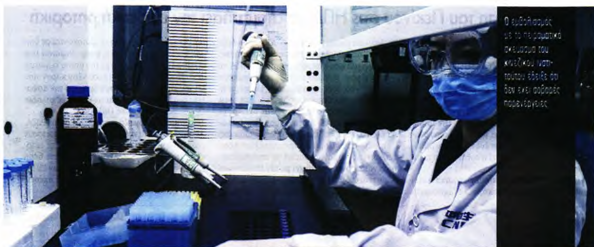
Ο εμβολιασμός με το πειραματικό σκεύασμα του κινεζικού ινστιτούτου έδειξε ότι δεν έχει σοβαρές παρενέργειες.

Η Κίνα έχει εμβολιάσει εκατοντάδες χιλιάδες εργαζόμενους σε σημαντικούς τομείς, όπως και ανθρώπους που ανήκουν σε ομάδες υψηλού κινδύνου, με άλλα πειραματικά εμβόλια κατά της COVID-19, μολονότι η κλινική τους δοκιμή δεν είχε ακόμη