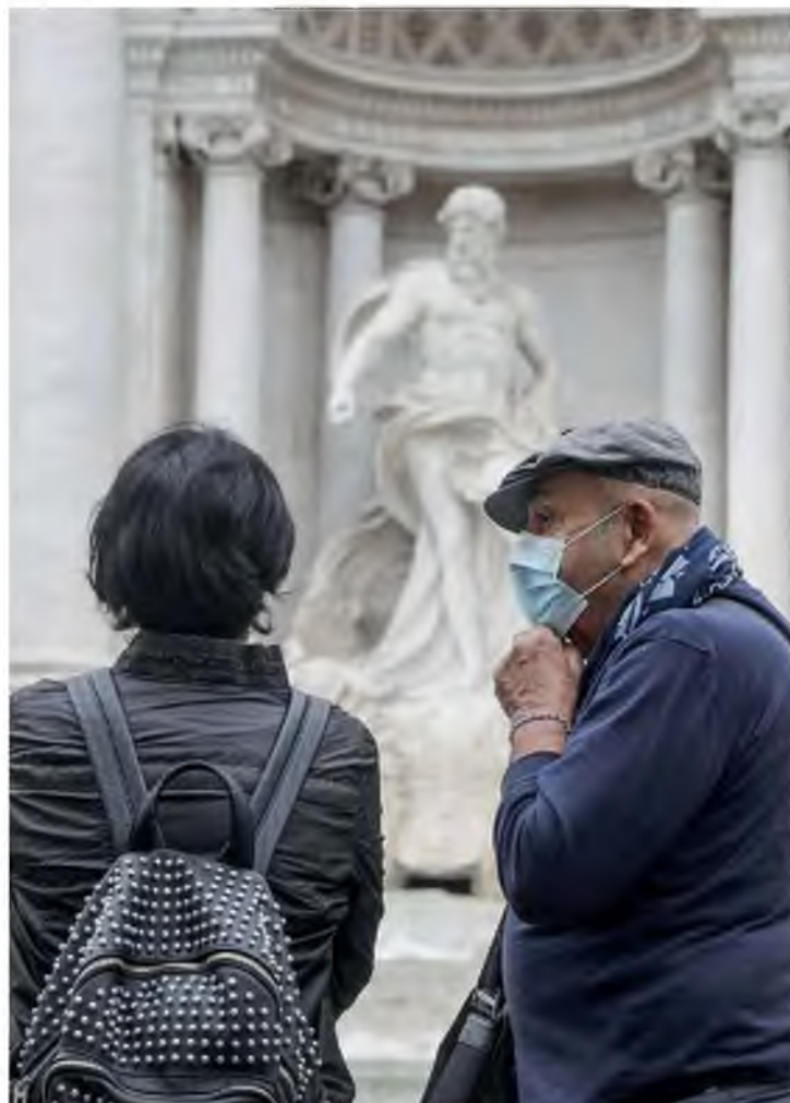
Την καθολική χρήση μάσκας στους εξωτερικούς χώρους όλης της χώρας επέβαλε χθες η ιταλική κυβέρνηση.

Από σήμερα και για ένα μήνα, οι Βέλγοι θα αποχαιρετήσουν τα αγαπημένα τους καφέ και μπαρ, όπως εξάλλου και τις αίθουσες εκδηλώσεων. Ο περιφερειάρχης των Βρυξελλών, Ρούντι Φέρφοστ, προσέθεσε ότι θα απαγορευθεί η κατανάλωση αλκοόλ σε δημόσιους χώρους και θα κλείσουν τα κυλικεία των αθλητικών λεσχών. Ωστόσο οι επιχειρήσεις εστίασης θα εξακολου-