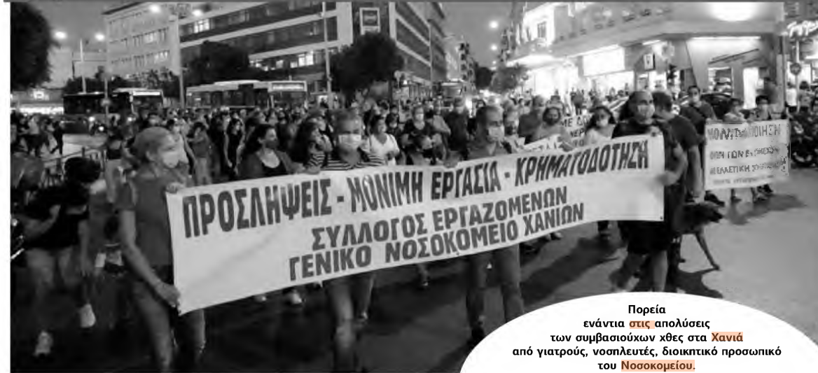
Πορεία ενάντια στις απολύσεις των συμβασιούχων χθες στα Χανιά από γιατρούς, νοσηλευτές, διοικητικό προσωπικό του Νοσοκομείου .

Ζητούν ενίσχυση του Νοσοκομείου και του ΕΣΥ