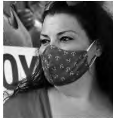
«Ζητάμε να γίνουμε επ' αορίστου και θέλουμε και άλλο προσωπικό γιατί επιβαρυνθήκαμε πάρα πολύ από την έναρξη της covid» τόνισε η κ. Μ. Βλαστάκη.