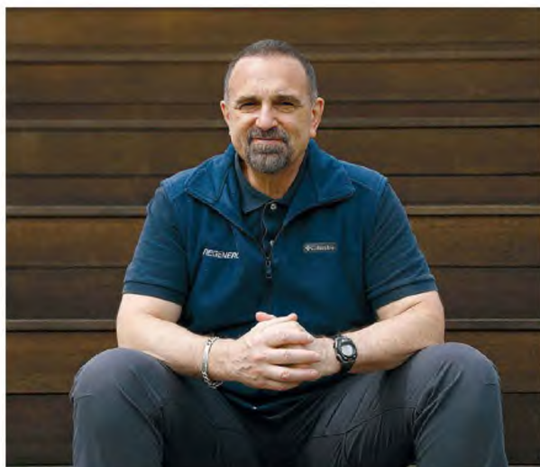
Ο Τζορτζ Γιανκόπουλος, συνιδρυτής, πρόεδρος και επικεφαλής επιστήμων της Regeneron.

— Επικοινωνήσαμε μαζί μας από τον Λευκό Οίκο την 1η Οκτωβρίου. Είχαμε εικόμη ανακοινώσει τα αποτελέσματα των κλινικών ερευνών μας μόλις δύο ημέρες πριν. Κινηθήκαμε, λοιπόν, τη διαδικασία ώστε να εξασφαλιστούν επείγουσα άδεια χρήσης του κοκτέιλ από την Υπηρεσία Τροφίμων και Φαρμάκων (FDA) των ΗΠΑ. Έγιναν, όπως κα-