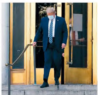
Ο Ντόναλντ Τραμπ υποσχέθηκε καθολική και δωρεάν πρόσβαση στο φάρμακο της Regeneron το συντομότερο δυνατόν.

Μιλώντας στο CNN, ο δρ Αντονι Φόουτσι, επικεφαλής των επιδημιολογών της ομοσπονδιακής κυ-