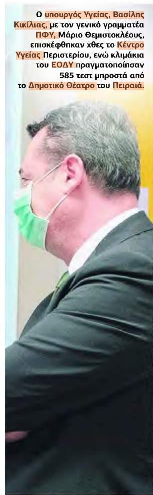
Ο υπουργός Υγείας, Βασίλης Κικίλιας, με τον γενικό γραμματέα ΠΦΥ, Μάριο Θεμιστοκλέους, επισκέφθηκαν χθες το Κέντρο Υγείας Περιστερίου, ενώ κλιμάκια του ΕΟΔΥ πραγματοποίησαν 585 τεστ μηροστά από το Δημοτικό Θέατρο του Πειραιά.