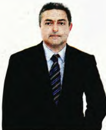
Ο πνευμονολόγος, Θεόδωρος Βασιλακόπουλος

Όσον αφορά στη χρήση μάσκας, ανέφερε «εάν εφαρμόζαμε σωστά τη μάσκα -να καλύπτει και τη μύτη και το στόμα- δεν θα χρειαζόταν να γίνει υποχρεωτική και στους εξωτερικούς χώρους». Παράλληλα, εάν φοράμε μάσκα, τόσο εμείς όσο και ο συνομιλητής μας, «το ιικό φορτίο θα είναι μικρότερο γιατί θα έχει να περάσει μέσα από δύο μάσκες, οπότε μάλλον θα νοσήσω ελαφρύτερα ή και