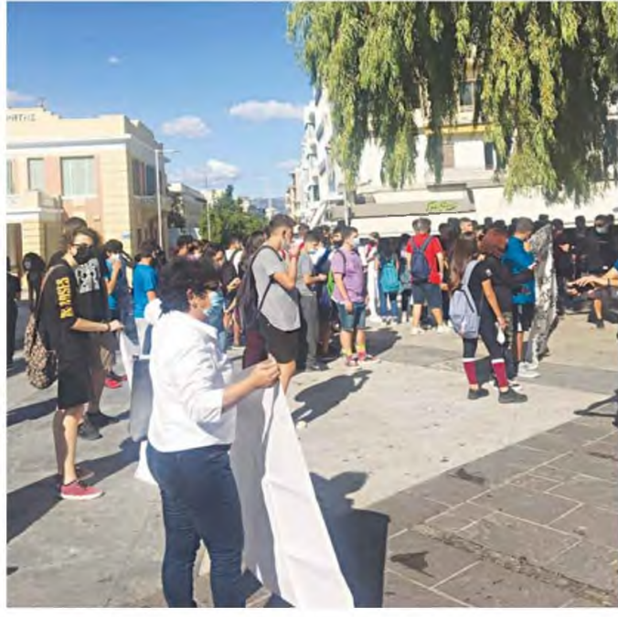
Απεργιακή συγκέντρωση στην πλατεία Ελευθερίας θα πραγματοποιηθεί σήμερα, στις 10 το πρωί, στα πλαίσια της 24ωρης κινητοποίησης ΑΔΕΔΥ και ΠΟΕΔΗΝ.

Όχι στις ιδιωτικοποιήσεις δημόσιων οργανισμών, κοινωνικών υπηρεσιών και στην εμπορευματοποίηση των κοινωνικών αγαθών. Αύξηση των κοινωνικών δαπανών για Υγεία, Παιδεία, ασφάλιση, κοινωνική προστασία και περιβάλλον. Κανένας πλειστηριασμός λαϊκής κατοικίας και περιουσίας για τους