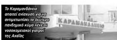
Το Καραμανδάνειο απαιτεί ενίσχυση για να αντιμετωπίσει το δεύτερο πανδημικό κύμα λένε οι νοσοκομειακοί γιατροί της Αχαΐας

«Είμαστε ήδη στην αρχή του δεύτερου κύματος της πανδημίας COVID-19, ενώ μεσολάβησαν περίπου επτά μήνες από το πρώτο κύμα. Παρόλα αυτά η ενίσχυση του Καραμανδανείου νοσοκομείου -του μοναδικού παιδιατρικού νοσοκομείου της Δυτικής Ελλάδας- σε ιατρονοσηλευτικό προσωπικό και εξοπλισμό είναι αναγκαία». Με την επισήμανση αυτή η Ένωση Νοσοκομειακών Ιατρών Αχαΐας (ΕΙΝΑ) αναδεικνύει τα προβλήματα του παιδιατρικού νοσοκομείου και την «κραυγή αγωνίας των γιατρών του Καραμανδανείου πρέπει να ακουστεί δυνατά» όπως χαρακτηριστικά αναφέρει η διοίκηση της ΕΙΝΑ. «Χρειάζονται επείγοντα μέτρα ενίσχυσης του νοσοκομείου, με μόνιμο ιατρονοσηλευτικό προσωπικό, με εξασφαλισμένο αξιοπρεπών χώρων και εξοπλισμού, για να καταστεί δυνατή η καθημερινή ασφαλή λειτουργία του και η εξυπηρέτηση των παιδιατρικών ασθενών». Η διαχειρί-