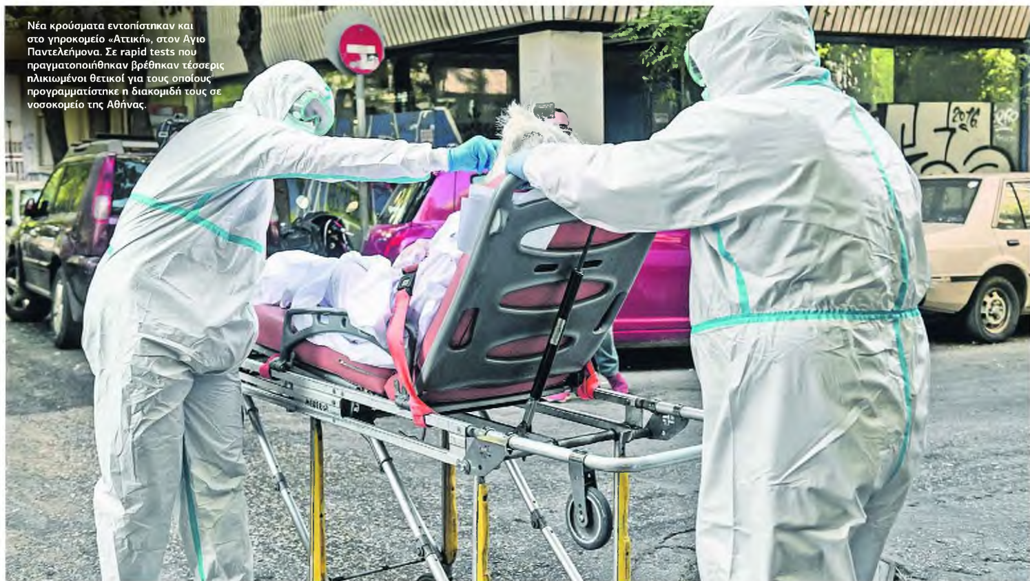
Νέα κρούσματα εντοπίστηκαν και στο γηροκομείο «Αττική», στον Άγιο Παντελεήμονα. Σε rapid tests που πραγματοποιήθηκαν βρέθηκαν τέσσερις ηλικιωμένοι θετικοί για τους οποίους προγραμματίστηκε η διακομιδή τους σε νοσοκομείο της Αθήνας.