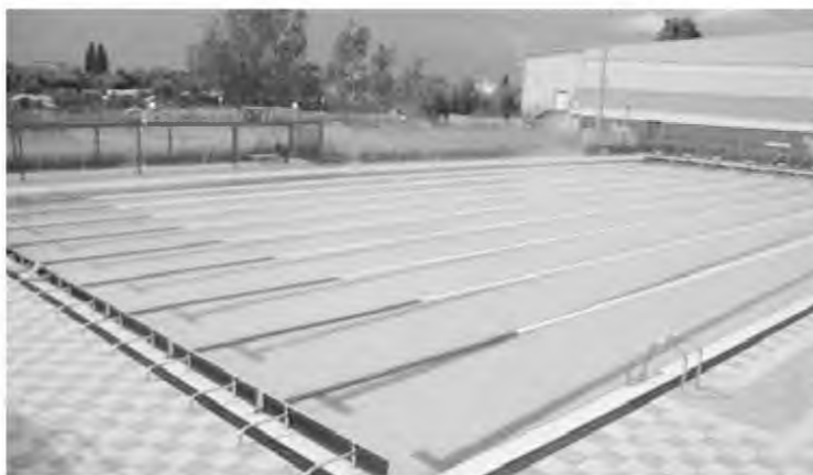
Όπως αναφέρει η ανακοίνωση: της διοίκησης του ΝΠΔΔ "Ο Ηλείος" στο δήμο Ήλιδας, ήδη

Επίσης, κλειστό έμεινε χθες και προχθές το κολυμβητήριο Αμαλιάδας, μετά το επιβεβαιωμένο κρούσμα που εντοπίστηκε να έχει κάνει χρήση της δομής