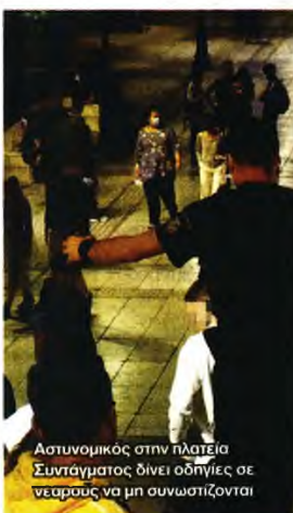
Αστυνομικός στην πλατεία Συντάγματος δίνει οδηγίες σε νεαρούς να μη συνωστίζονται