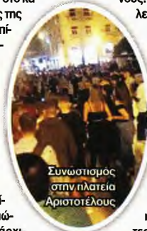
Συνωστισμός στην πλατεία Αριστοτέλους

Οι άνδρες της Αστυνομίας, διαπίστωσαν ότι υπήρχε συνωστισμός και προσπάθησαν να ενημερώσουν τον ιδιοκτήτη ότι παραβιάζει τα προβλεπόμενα μέτρα. Ωστόσο, αυτό προκάλεσε τη σφοδρή αντίδραση των θαμώνων, οι οποίοι άρχισαν να φωνάζουν και να βρίζουν τους αστυνομικούς, ενώ δεν δίστασαν να πιασούν και στα χέρια. Στο σημείο έφτασαν δυνάμεις της ΟΠΚΕ, με αποτέλεσμα να προηγήσει η σύλληψη των ατόμων, ενώ στη συνέχεια οι αστυνομικοί έβαλαν λουκέτο στο κατάστημα και πέρασαν