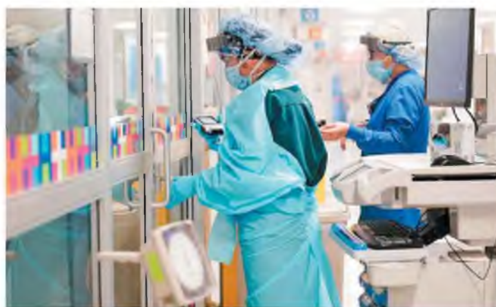
Την Τρίτη , οι ασθενείς με COVID-19 στα αμερικανικά νοσοκομεία ξεπέρασαν τις 50.000.

κε σειρά νέων περιοριστικών μέτρων, μεταξύ των οποίων μερικό lockdown στις «κόκκινες ζώνες», όπως η Λομβαρδία, γύρω από την οικονομική πρωτεύουσα της χώρας, το Μιλάνο, το Πεδεμόντιο (Τορίνο), την Κοιλάδα της Αόστα και την Καλαβρία. Στις «κόκκινες ζώνες» θα επιβληθεί περιορι-