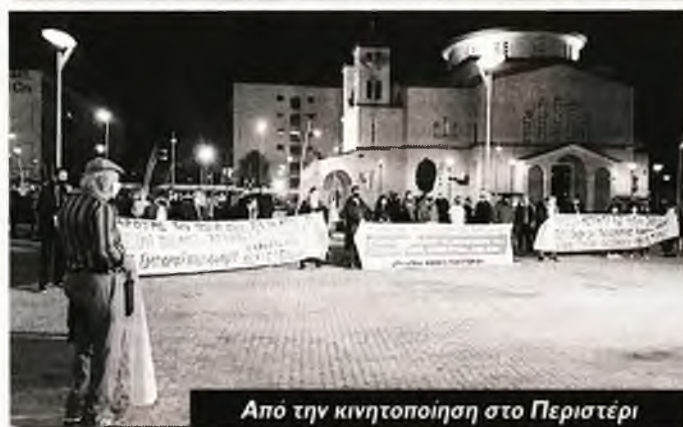
Από την κινητοποίηση στο Περιστέρι

τούν επαναλαμβανόμενα τεστ στους χώρους δουλειάς και προσλήψεις στην καθαριότητα των σχολείων.