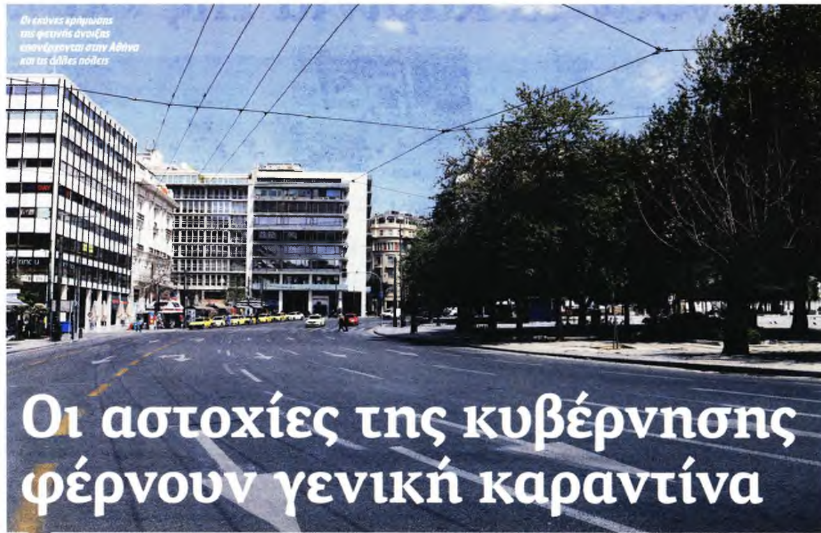
Οι εκ νέου κρήνηδες της φετινής ανοίξης υπονόμευται στην Αθήνα και τις άλλες πόλεις