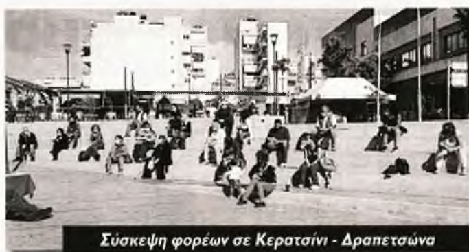
Σύσκεψη φορέων σε Κεραταίνο - Δραπετσώνα

Κινητοποίηση έξω από το Νοσοκομείο Αμφισσας, καταγγέλλοντας την τραγική κατάσταση και απαιτώντας άμεσα μαζικές προσλήψεις μόνιμου προσωπικού, πραγματοποιήσαν το Εργατικό Κέντρο Φωκίδας και το Σωματείο εργαζομένων του νοσοκομείου. Είναι χαρακτηριστικό ότι πριν από λίγες μέρες το νοσοκομείο έμεινε χωρίς αναισθησιολόγους, ενώ εξαιτίας νέου κρούσματος σε εργαζόμενο έκλεισε και η Παθολογική κλινική που ήδη υπολειτουργούσε. Την ίδια στιγμή τα κρούσματα στην περιοχή αυξάνονται, προκαλώντας έντονη ανησυχία, με τα Σωματεία να απαι-