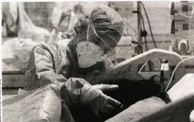
Από τους 51 γιατρούς που αυτή τη στιγμή βρίσκονται στο Κοινοβούλιο, αρκετοί ήταν αυτοί που ανταποκρίθηκαν στο κάλεσμα του υπουργείου Υγείας για εθελοντές γιατρούς (φωτογραφία από ΜΕΘ νοσοκομείου για ασθενείς με Covid-19)