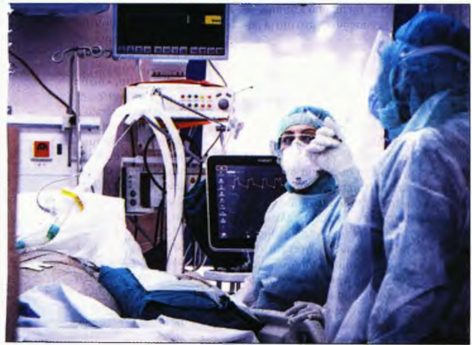
α η αρωξία στις Μονάδες Εντατικής Θεραπείας

αλληλεγγύης των φιλόanthρωπων, κοινωνικών και προνοιακών δομών που έχει αναπτύξει στην περιφέρειά της, διανέμει καθημερινά πάνω από 1.500 μερίδες φαγητού σε αναξιοπαθούντες και περιθάλπει περισσότερες από 700 οικογένειες μέσω των οκτώ ενοριακών Εστίων Αγάπης. Γίνεται σαφές, λοιπόν, ότι επιδιώκει με αυτό τον τρόπο να συμβάλει τόσο στην κοινωνική προστασία των ευπαθών κοινωνικών ομάδων που πλήττονται οικονομικά, περισσότερο τώρα, με την πανδημία του κορονοϊού, όσο και στη μερική άρση των συνεπειών της φτώχειας, της ανεργίας και του κοινωνικού αποκλεισμού. Οι άνθρωποι που έλαβαν τα πακέτα δεν μπόρεσαν να κρύψουν τη συγκίνησή τους και ευχαρίστησαν τον σεβασμιότατο και τους συνεργάτες του για τη μέριμνα και την ευαισθησία τους.