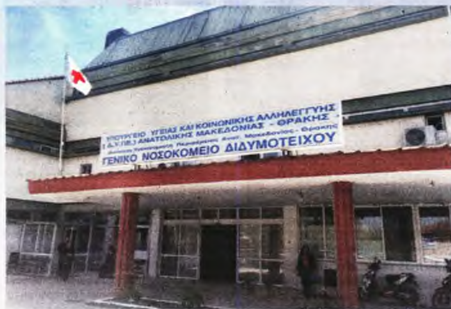
Διασωληνωμένοι δύο γιατροί και ένας βοηθός θαλάμου

φεί 40 εργαζόμενοι θετικοί στον ιό και, σύμφωνα με τον τελευταίο απολογισμό της ΠΟΕΔΗΝ, ο αριθμός έφτασε πλέον τους 50, ενώ 3 εξ αυτών, δύο γιατροί και ένας βοηθός θαλάμου, νοσηλεύονται. Ο ένας γιατρός είναι διασωληνωμένος στο Νοσο-