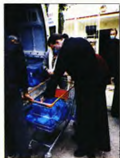
Ο μητροπολίτης Γαβριήλ με «Δέματα Αγάπης»

ΤΟΥΣ ΑΠΟΡΟΥΣ και οικονομικά αδύναμους στηρίζει έμπρακτα ακόμη μία φορά η μητρόπολη Νέας Ιωνίας. Ο μητροπολίτης κ. Γαβριήλ, μαζί με ιερείς, επισκέφθηκε χθες και προχθές τις ενορίες της τοπικής Εκκλησίας και πρόσφερε «Δέματα Αγάπης» σε αναξιοπαθούντες, σε ανθρώπους που στερούνται ακόμα και τα βασικά.