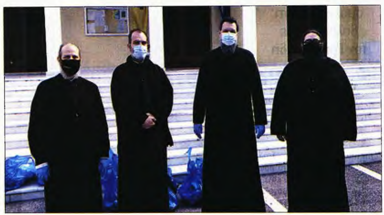
Ο μητροπολίτης Γαβριήλ με ιερομένους των ενοριών της Ν. Ιωνίας