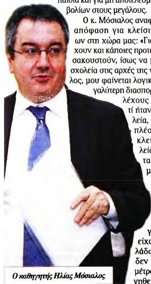
Ο καθηγητής Ηλίας Μόσιαλος

«Γιατί; Γιατί τα σχολεία ήταν ανοικτά όλο αυτό το διάστημα. Ισως, λοιπόν, αυτή η αναφερόμενη ως παρατηρούμενη αύξηση προκύπτει επειδή τα παιδιά έχουν περισσότερες συναναστροφές». Ωστόσο, όπως συνεχίζει ο καθηγητής, για την ώρα, με βάση τα ανακοινωθέντα στοιχεία, δεν υπάρχει λόγος ανησυχίας για διασπορά που συσχετίζεται με αυξημένο ρίσκο για τα παιδιά και για μη αποτελεσματικότητα των εμβολίων στους μεγάλους.