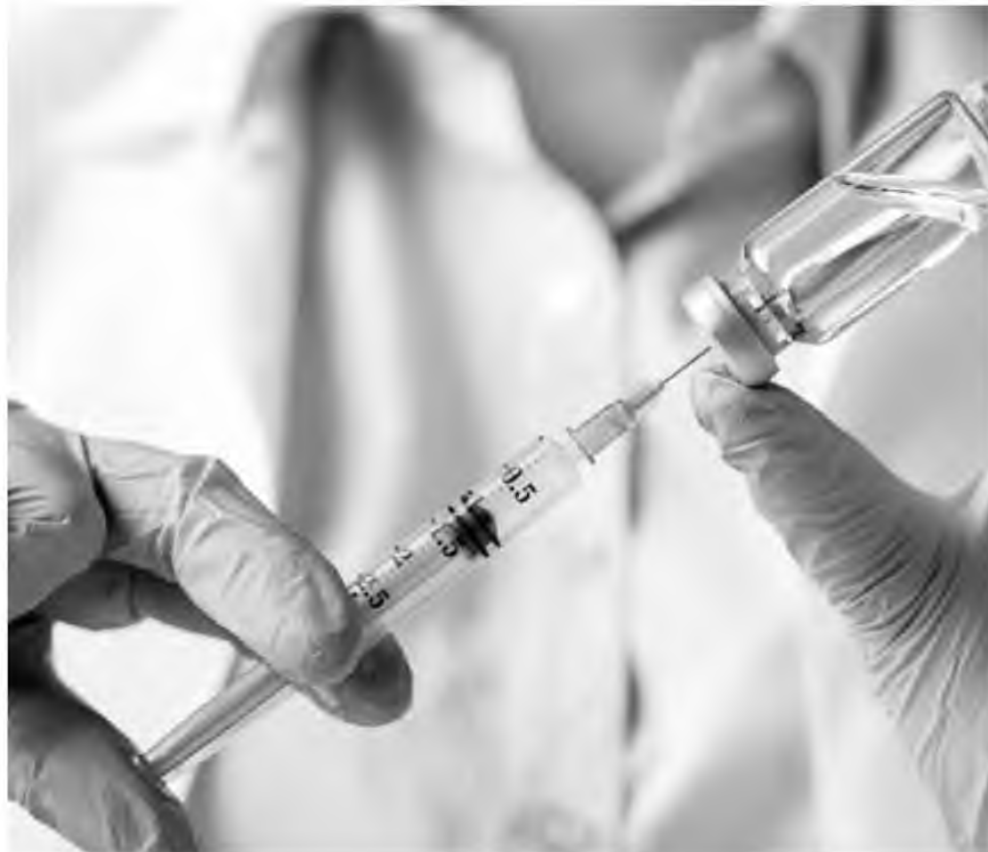
Αν υπάρχουν γιατροί που διατάζουν να εμβολιαστούν οφείλουν να βγουν και να εξηγήσουν δημόσια την επιλογή τους

Όχι, οι υγειονομικοί δεν σπεύδουν όλοι και χωρίς πολλά-πολλά