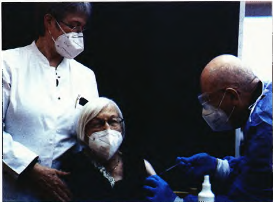
Μια γυναίκα 101 ετών ήταν ανάμεσα στους πρώτους που έκαναν το εμβόλιο στο Βερολίνο

Εχω αγγίξει με τα δάχτυλά μου και έχω δει με τα μάτια μου πόσο δύσκολο είναι να καταπολεμηθεί αυτός ο ιός, έχοντας βρεθεί στην