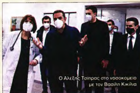
Ο Αλέξης Τσίπρας στο νοσοκομείο με τον Βασίλη Κικιλία

Όπως αναφέρουν πηγές της Κουμουνοδούρου, ο κ. Τσίπρας προχώ-