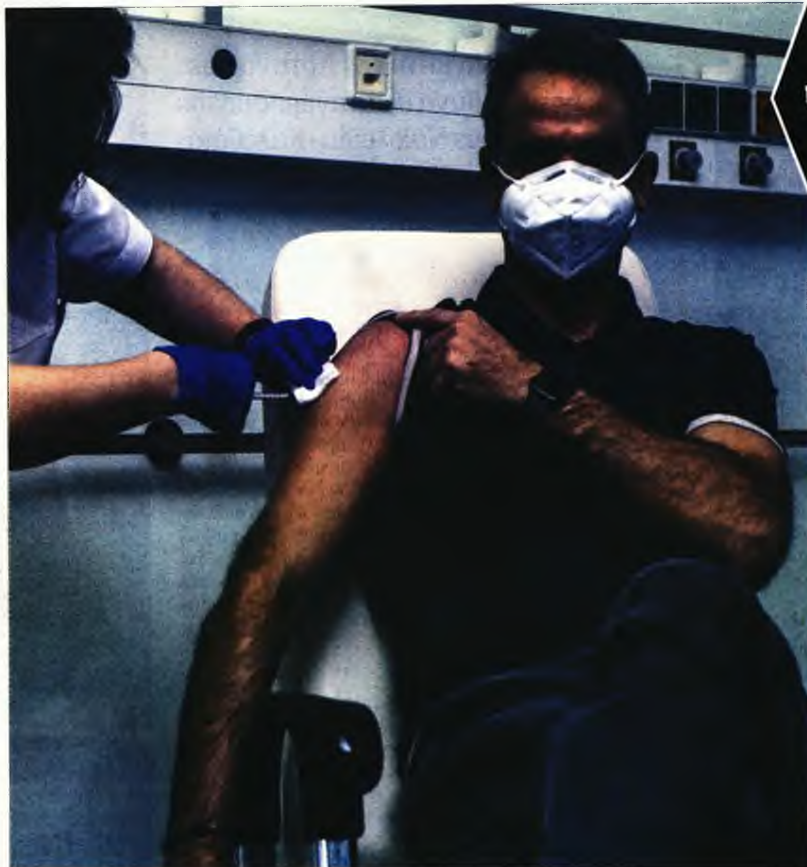
Στιγμιότυπα από τον εμβολιασμό του Κυριάκου Μητσοτάκη