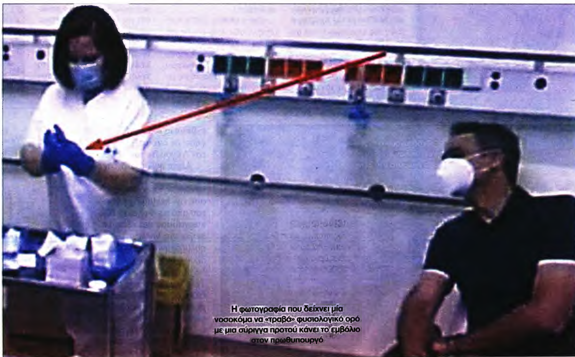
Η φωτογραφία που δείχνει μία νοσοκόμα να «τραβά» φυσιολογικό ορό με μια σύριγγα προτού κάνει το εμβόλιο στον πρωθυπουργό