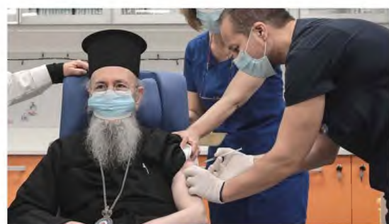
Εμβολιασμός του Μητροπολίτη Ναυπάκτου, Ιερόθεου, στον Ευαγγελισμό

ΚΕΡΚΥΡΑ. Από την επόμενη Δευτέρα, 4 Ιανουαρίου, προγραμματίζεται να ξεκινήσει ο εμβολιασμός των υγειονομικών, αρ-