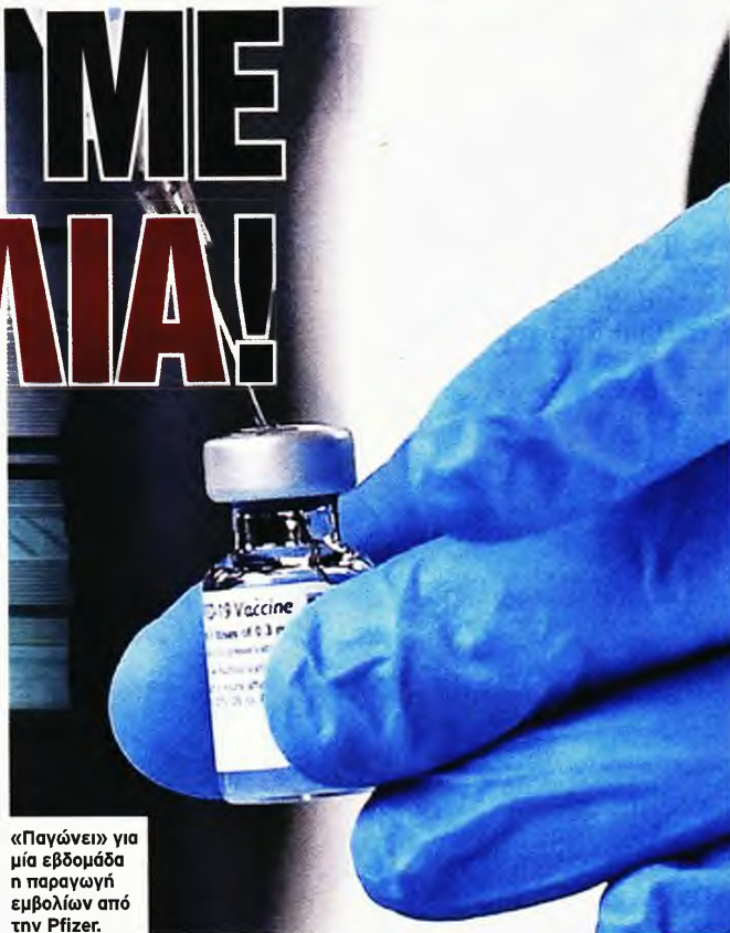
«Παγώνει» για μία εβδομάδα η παραγωγή εμβολίων από την Pfizer.

εμβολίου της Pfizer. Όμως, καμία αναπροσαρμογή δεν έχει ανακοινωθεί στον προγραμματισμό των παραλαβών δόσεων του εμβολίου από τη χώρα μας, μετά από την ανακοίνωση της εταιρείας. Η χώρα μας πρέπει να λάβει, βάσει των συμβολαίων, 1.348.425 δόσεις του εμβολίου της Pfizer μέχρι το τέλος του ερχομένου Μαρτίου, με την Pfizer να δηλώνει ότι το πρόβλημα με τη μειωμένη ικανότητά της σε παραδόσεις θα περιοριστεί μέσα στον Φεβρουάριο και θα είναι σε θέση να εκτελέσει στο σύνολό τους μέχρι το τέλος Μαρτίου όλες τις συμβατικές της υποχρεώσεις έναντι των χωρών της Ε.Ε. Πάντως, το Βέλγιο ανακοίνωσε ήδη ότι αναμένει να λάβει μόνο το ήμισυ των προγραμματισμένων δόσεων του εμβολίου των Pfizer-BioNTech τον Ιανουάριο, ενώ