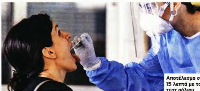
Αποτέλεσμα σε 15 λεπτά με το τεστ σάλιου.

ΝΕΑ ΔΥΝΑΤΟΤΗΤΑ διάγνωσης του Covid-19 με την πραγματοποίηση εκτεταμένων διαγνωστικών ελέγχων για την αντιμετώπιση της πανδημίας δίνουν rapid tests αντιγόνου με δείγμα σάλιου που διατίθενται και στην Ελλάδα. Τα νέα τεστ γίνονται με τη λήψη σάλιου και όχι με τη λήψη δειγμάτων από το φάρυγγα και τη μύτη, είναι πιο οικονομικά, απλούστερα στην εκτέλεση, λιγότερο ενοχλητικά και ο χρόνος εκτέλεσης είναι σαφώς πιο γρήγορος, δηλαδή δίνουν άμεσα αποτελέσματα και ίσως αποδειχθούν η πιο δραστηκή άμεση λύση για τη μείωση της διάδοσης του Covid-19, πολλαπλασιάζοντας τη δυνατότητα έγκαιρης διάγνωσης και περιορίζοντας άμεσα τα θετικά κρούσματα. Το τεστ ταχείας ανίχνευσης αντιγόνου με δείγμα σάλιου δίνει αποτέλεσμα μέσα σε 15 λεπτά, με ευαισθησία 95%, παρέχοντας νέα προοπτική στην έγκαιρη διάγνωση του Covid-19 και την ευκαιρία για εκτενή διενέργεια τεστ. Η ευκολία και αμεσότητα με το δείγμα σάλιου αναμένεται να πολλαπλασιάσει τη δυνατότητα διάγνωσης, ενώ το συγκεκριμένο τεστ είναι ιδανικό και για παιδιά. Σύμφωνα με μελέτες, αν όλος