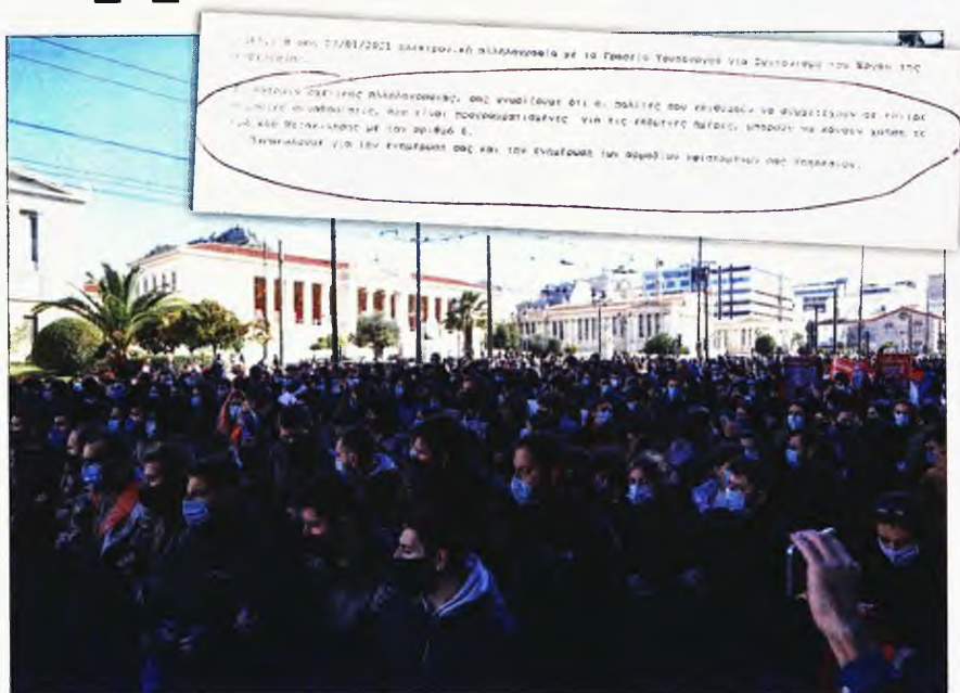
Το σχετικό, αποκρυπτογραφημένο έγγραφο (ένθετη) που απευθύνεται προς όλες τις αστυνομικές υπηρεσίες

Το σχετικό έγγραφο είναι αποκρυπτογραφημένο, απευθύνεται προς όλες τις αστυνομικές υπηρεσίες και αναφέρει: «ΣΧΕΤ.: Η από 27/01/2021 ηλεκτρονική αλληλογραφία με το γραφείο Υφυπουργού για συντονισμό του έργου της Κυβέρνησης: Κα-