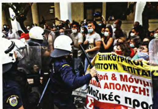
Από την επίθεση της Αστυνομίας στους... ήρωες γιατρούς που διαδήλωναν έξω από το υπουργείο Υγείας στις 30 Σεπτεμβρίου 2020

Η ΕΛ.ΑΣ. σε ρόλο εισαγγελέα ξεκίνησε τις διώξεις στο όνομα της προστασίας της δημόσιας υγείας, σχηματίζοντας δικογραφίες σε βάρος των «παραβατών» που τολμούν και συναθροίζονται όχι βέβαια στις εκκλησίες ή στα ΜΜΜ αλλά στις διαδηλώσεις. Ήδη από χθες δικογραφία σχηματίζει αυτεπαγγέλτως και «αναγκαστικά εκ του Νόμου» η Διεύθυνση Αστυνομίας Αθηνών με αφορμή το προχθεσινό μαζικό