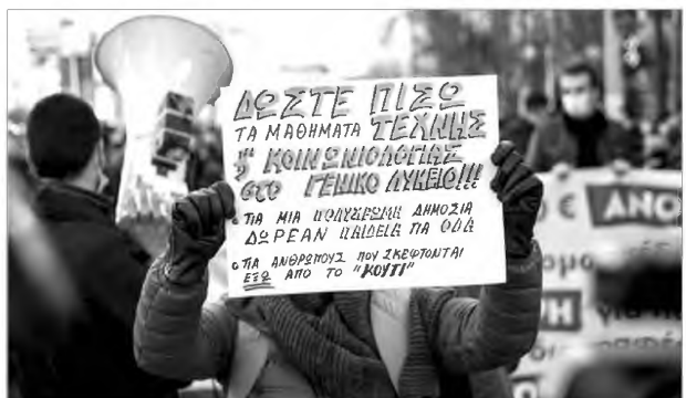
πιστημίου, αφού δεν προβλέπεται σχεδόν καμία υποστήριξη με κοινωνικά κριτήρια, όπως μαζικές υποτροφίες, άτοκα δάνεια κ.λπ.», καταλήγει ο Π. Κυπριανός. Ζωή Γεωργούλα

νέπειας επέρχονται ως αποτέλεσμα ενός συστήματος που δεν είναι ακαδημαϊκό, δεν το δικαιολογεί κανένα κριτήριο και δεν το διέπει καμία λογική εξήγηση για τον υπολογισμό και τη χρήση της ΕΒΕ. Κάθε χρόνο θα διαφοροποιείται με βάση την κατάσταση των θεμάτων, το πλήθος των μαθητών που συμμετέχουν στις πανελλαδικές, δηλαδή παραμέτρους άσχετες και αδικαιολόγητες. Ως προς το δεύτερο, την αποφοίτηση, επανέρχεται το v+2, για το χρόνο φοίτησης, όπου v ο προβλεπόμενος χρόνος φοίτησης του κάθε τμήματος. Υποτίθεται ότι προβλέπεται 2v για τους εργαζόμενους φοιτητές. «Όμως απαιτεί αποδεικτικό εργασίας που αναιρεί στην πράξη την παροχή του 2v, αφού ούτε 1 στους 10 εργαζόμενους φοιτητές δεν μπορεί να αποδείξει ότι εργάζεται λόγω της ματурс εργασίας. Παράλληλα ακυρώνεται στην πράξη η κοινωνική διάσταση του πανεπιστημίου, αφού δεν προβλέπεται σχεδόν καμία υποστήριξη με κοινωνικά κριτήρια, όπως μαζικές υποτροφίες, άτοκα δάνεια