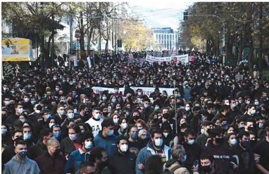
Φωτογραφίες από το πρόσφατο πανεκπαιδευτικό συλλαλητήριο

ΟΣΟ ΚΙ ΑΝ τα παραπάνω πλάσονται ως εκσυγχρονισμός και εξευρωπαϊσμός της χώρας μέσω