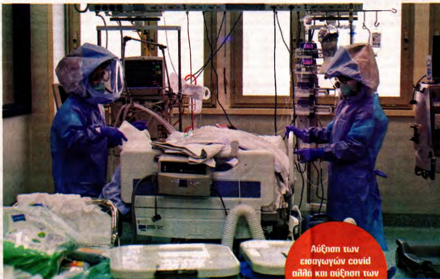
Αύξηση των εισαγωγών covid αλλά και αύξηση των εισαγωγών μη covid!

Σε τετραήμερο νούμερο ανέρχονται τα κρούσματα του κορωνοϊού για τέταρτη συνεχόμενη ημέρα, καταγράφοντας μάλιστα μια μικρή αύξηση σε σχέση με την Πέμπτη. Συγκεκριμένα ο ΕΟΔΥ ανακοίνωσε 1195 κρούσμα-