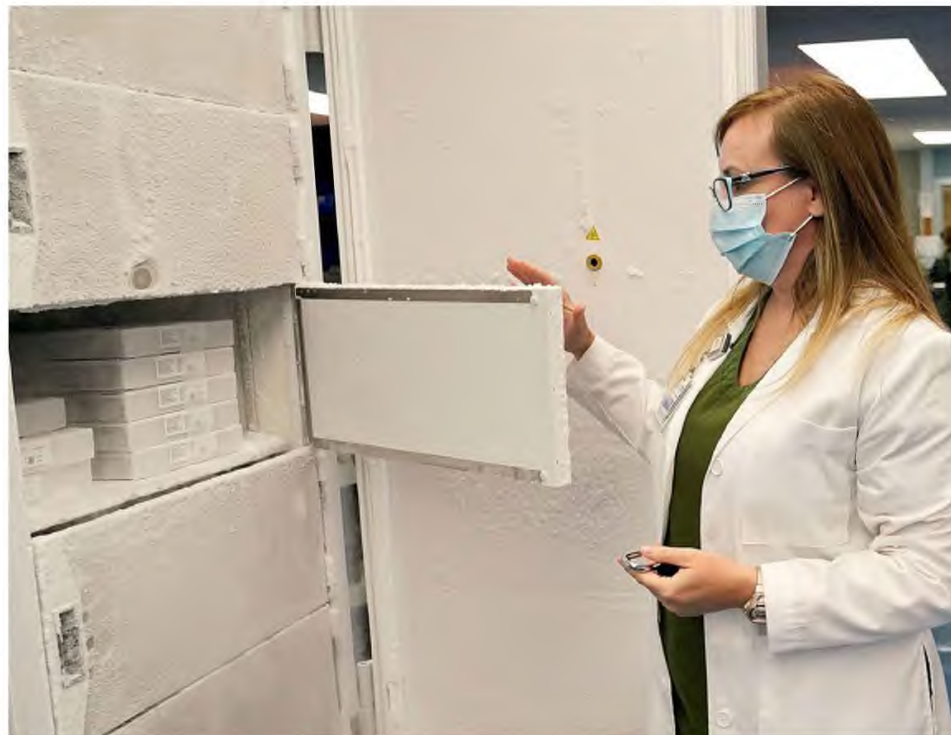
Όπως αναφέρεται στη σύμβαση E.E. - GSK-Sanofi, η κοινοπραξία δεσμεύεται να καταβάλει τις «βέλτιστες ειλώγες προσπάθειες» για να προμηθεύσει τα κράτη-μέλη με 300 εκατ. δόσεις του εμβολίου που θα παρασκευάσει σύμφωνα με τα χρονοδιαγράμματα «εντός του 2021».

Συγκεκριμένα, στον Μηχανισμό θα διατεθεί 1,26 δισ. ευρώ για το 2021-2027, που θα συμπληρωθεί από 2,056 δισ. ευρώ από το Ταμείο Ανάκαμψης. Όπως εξηγεί στην «Κ» ο εισηγητής του Κοινοβουλίου για το θέμα, Νίκος Ανδρουλάκης, το ζήτημα της απειθείας προμήθειας εξοπλισμού από την Ε.Ε. ήταν κάτι για το οποίο πίεσαν οι ευρωβουλευτές, αλλά στο οποίο αντιστεκόταν η γερμανική προεδρία του Συμβουλίου (κατά το προηγούμενο εξάμηνο). «Θυμόμαστε τι έγινε την περασμένη άνοιξη με το προηγούμενο καθεστώς», σημειώνει ο κ. Ανδρουλάκης. «Η Ιταλία είχε ζητήσει μάσκες τον Μάρτιο και τις παρέλαβε τον Μάιο». Η συμβιβαστικά λύση προβλέπει τη δυνατότητα απειθείας προμηθειών από την Ε.Ε. σε συνθήκες εκτάκτου ανάγκης, διαδικασία που «θα επιταχύνει τις διαδικασίες και θα εξασφαλίσει χαμηλότερες τιμές για τον εξοπλισμό», σύμφωνα με τον κ. Ανδρουλάκη.