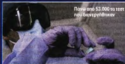
Πάνω από 53.000 τα τεστ που διενεργήθηκαν

Ενδεικτικό της πίεσης που υφίστανται τα νοσηλευτικά ιδρύματα της Πάτρας είναι το γεγονός ότι στη μονάδα