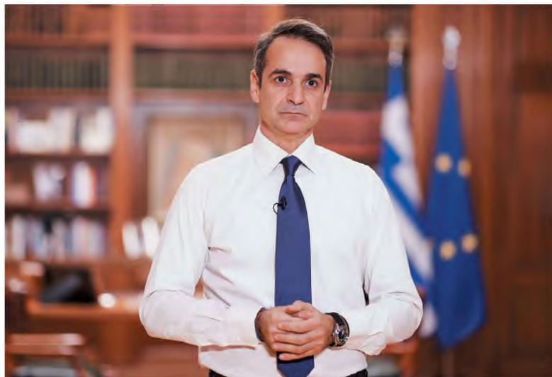
«Από τον Απρίλιο θα είμαστε πολύ καλύτερα, όμως τώρα πρέπει να προλάβουμε τον κίνδυνο», υπογράμμισε χθες ο Κυρ. Μητσοτάκης.

ανοίξει κανονικά η χώρα από τον ερχόμενο Απρίλιο. Για να γίνει κάτι τέτοιο πρέπει το ΕΥΥ να αποσυρθεί, έτσι ώστε να υπάρχει περιθώριο από τον Απρίλιο για όσο το δυνατόν πιο πλήρη οικονομική δραστηριότητα, συμπεριλαμβανομένων και της εστίασης σε ανοικτό χώρο, καθώς θα έχει πλέον καλοκαιριάσει. Η πίεση να ανοίξει η οικονομική δραστηριότητα επιβάλλεται από το γεγονός πως ήδη έχουν διαπιστωθεί 5,9 δια. από τα 7,5 δια. που προβλέπονταν στον προϋπολογισμό, συνεπώς δεν μπορεί να συνεχιστεί πέραν του Μαρτίου η στήριξη των επιχειρήσεων.