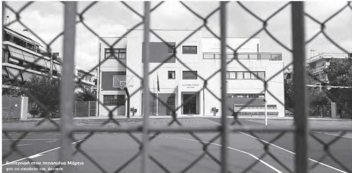
Επιστροφή στην περασμένο Μάρτιο για τα σχολεία της Αττικής

Ειδικότερα, οι μαθητές Γυμνασίου και Λυκείου θα παρακολουθούν το μάθημά τους διαδικτυακά τα πρωινά, ενώ μετά τις 2 το απόγευμα θα ξε-