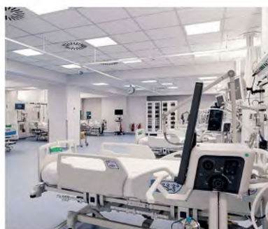
Στον σχεδιασμό του υπουργείου Υγείας είναι η σταδιακή αύξηση των κλινών των δημόσιων νοσοκομείων για περιστατικά COVID-19.

Οι υγειονομικές αρχές παρακολουθούν στενά την κατάσταση στο ΕΕΥ ώστε, εφόσον χρειαστεί, να παρέμβουν άμεσα. Στα αρνητικά αυτής της συγκυρίας είναι ότι αυτό το πανδημικό κύμα ξεκινάει όταν η πληρότητα στις ΜΕΘ COVID είναι πιο υψηλή σε σχέση με το προηγούμενο κύμα. Στα πλέον εκτεταμένα είναι ότι η Αττική έχει μεγάλο αριθμό δημοσίων νοσοκομείων (31 στην Αθήνα και έξι σε Δυτική Αττική και Πελοπόννησο), στα οποία θα συνδράμουν και νοσοκομεία ομορών περιφερειών (π.χ. νοσοκομείο Χαλκίδας, Κορίνθου κ.ά.). Ιδιαίτερα σημαντικό είναι ότι το λεκανοπέδιο έχει τα περισσότερα