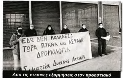
Από τις χτεςίνες εξορμήσεις στον προαστιακό

Τις τελευταίες δε ώρες εμφανιζόταν η «ναλλακτική του πρώτου κύματος» για...πιθανό άνοιγμα του Νοσοκομείου Θάρακας, με μετακινούμενο προσωπικό από άλλα νοσοκομεία και από τα Κέντρα Υγείας, αντί για μόνιμες προσλήψεις που διεκδικούν οι υγειονομικοί, ο λαός και οι φορείς της περιοχής. «Δηλαδή θα ανοίχουν κρεβάτια χωρίς προσωπικό και εξοπλισμό», ρωτούν οι υγειονομικοί. «Είναι εγκληματικό για τους ασθενείς που νοσηλεύονται. Και οι εργαζόμενοι από χιλιά θα γίνουν χίλια πεντακόσια κομμάτια. Το προσωπικό είναι ήδη εξουθενωμένο, όταν εδώ και τούσους μήνες αναλογεί 1 νοσηλευτής για 10 ασθενείς με Covid και πολλαπλές νοσηρότητες».