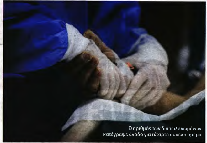
Ο αριθμός των διασωληνωμένων κατέγραψε άνοδο για τέταρτη συνεχή ημέρα