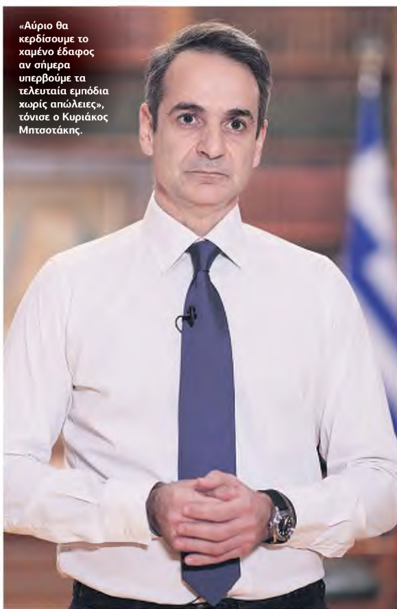
«Αύριο θα κερδίσουμε το χαμένο έδαφος αν σήμερα υπερβούμε τα τελευταία εμπόδια χωρίς απώλειες», τόνισε ο Κυριάκος Μητσοτάκης.

ΑΠΟΣΤΟΛΟΣ ΧΟΝΔΡΟΠΟΥΛΟΣ achondropoulos@e-typos.com