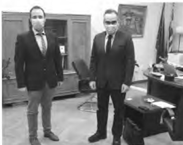
Από τη συνάντηση Κων. Μαραβέγια με τον αν. υπουργό Β. Κοντοζαμάνη

Τέλος, ο βουλευτής ενημέρωσε τον κ. Κοντοζαμάνη για την εγκατάσταση σταθμού βιντεοεπικοινωνίας για κωφούς και βαρήκοους (ηλεκτρονικές) στο Νοσοκομείο του Βόλου και τον κάλεσε να πραγματοποιήσει τα εγκαίνια μαζί με την υφυπουργό Εργασίας και Κοινωνικών Υποθέσεων κ. Δόμνα Μιχαηλίδου.