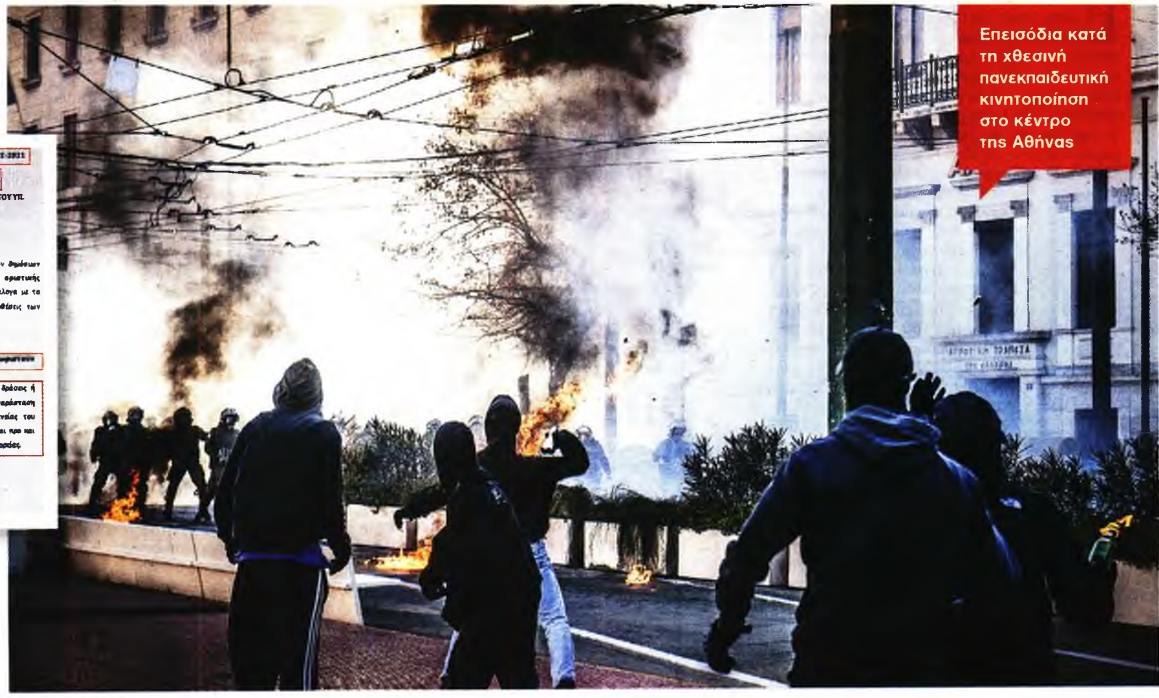
Επεισόδια κατά τη χθεσινή πανεκπαιδευτική κινητοποίηση στο κέντρο της Αθήνας

που προέκυψαν από την πανδημία. Όπως σημειωνόταν στο σχετικό έγγραφο που είχαν παρουσιάσει «ΤΑ ΝΕΑ» στις 29 Ιανουαρίου, ο εν λόγω συνδικαλιστής δεν ακολούθησε τις εντολές του διαμεσολαβητή αξιωματικού (πρόκειται για τον νέο θεσμο «συνδέσμου» της ΕΛ.ΑΣ. με διαδηλωτές) που προέβλεπαν την παραμονή των συγκεντρωμένων στο πεζοδρόμιο και όχι στο οδόστρωμα. Αντιθέτως, κατά την ΕΛ.ΑΣ., εκείνος προέτρεψε τα παρευρισκόμενα άτομα - μέλη της Ομοσπονδίας να καταλάβουν το οδόστρωμα προκειμένου να διακόψουν την κυκλοφορία των οχημάτων.