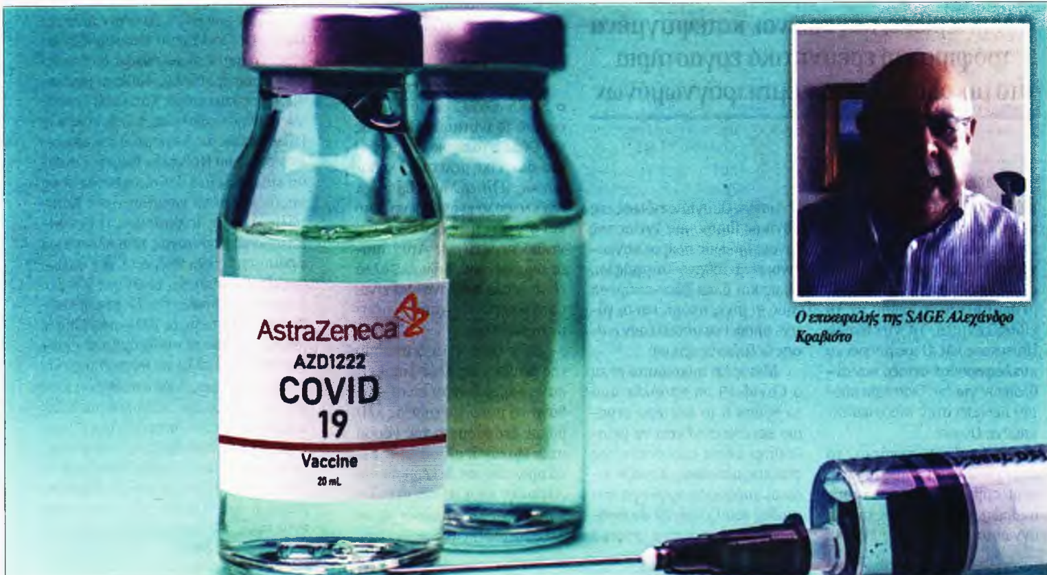
Ο επικεφαλής της SAGE Αλεξάνδρο Κραβιτίτο

Τ ο εμβόλιο της AstraZeneca κατά του Covid-19 είναι ασφαλές και αποτελεσματικό, και μπορεί να χρησιμοποιηθεί ευρέως, περιλαμβανομένων και των χωρών όπου το νοτιοαφρικανικό στέλεχος του κορονοϊού μπορεί να μειώνει την αποτελεσματικότητά του, ανακοίνωσε χθες επιτροπή του Παγκόσμιου Οργανισμού Υγείας (ΠΟΥ). Με τους ειδικούς να υπογραμμίζουν επιπλέον πως το εμβόλιο μπορεί να δοθεί σε δύο δόσεις, αφού μεσολαβήσει ένα χρονικό διάστημα 8 έως 12 εβδομάδων, και να χρησιμοποιηθεί για ανθρώπους ηλικίας 65 ετών και άνω. Ακόμη και σε χώρες όπως η Νότια Αφρική, όπου έχουν εγερθεί ερωτήματα για την αποτελεσματικότητα του εμβολίου της AstraZeneca εναντίον