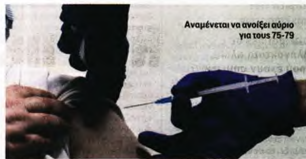
Αναμένεται να ανοίξει αύριο για τους 75-79

Μάλιστα, για την ηλικιακή ομάδα από 75 έως 79 έτη ο στόχος είναι να ξεκινήσει εμβολιασμός στις 15 Φεβρουαρίου, όπως είχε ανακοινώσει, την περασμένη Δευτέρα, στην εξ αποστάσεως-ενημέρωση των πολιτικών συντακτών, η αναπληρώτρια κυβερνητική εκπρόσωπος, Αριστοτελία Πελώνη.