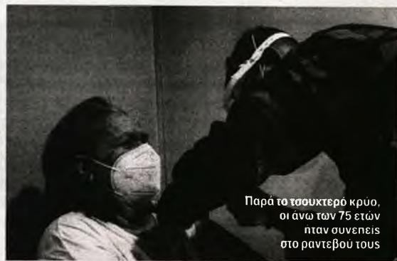
Παρά το τσουκτερό κρύο, οι άνω των 75 ετών ήταν συνηθισμένοι να δημιουργηθεί πλήρες ιστορικό κάθε εμβολιασμένου πολίτη.

Όσον αφορά στη διαδικασία που ακολουθείται, αρχικά ειδικοί παίρνουν το ιστορικό των πολιτών πριν τον εμβολιασμό τους για να διασφαλίσουν πως δεν θα υπάρχουν απρόοπτα. Μετά την καταγραφή των στοιχείων τους, οι πολίτες οδηγούνται στην αβουσα αναμονής και στη συνέχεια,