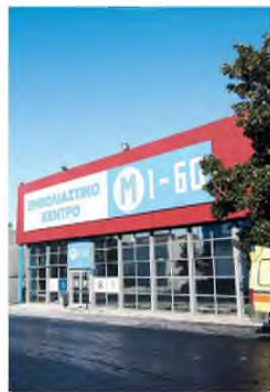
Ο εμβολιαστικός σταθμός στη ΔΕΘ ξεκίνησε χθες με 24 εμβολιαστικά κέντρα και έως το απόγευμα είχαν εμβολιαστεί 600 πολίτες.

Εν τω μεταξύ, χθες ξεκίνησε ο εμβολιασμός των ατόμων 60 έως 64 ετών (239.000 πολίτες αυτής της ομάδας έχουν κλείσει ραντεβού) και εντός της εβδομάδας θα αρχίσουν να εμβολιάζονται και τα άτομα 75 έως 79 ετών (150.000 ραντεβού είχαν προγραμματιστεί έως χθες). Όπως ανέφερε η πρόεδρος της Εθνικής Επιτροπής Εμβολιασμών Μαρία Θεοδωρίδου, θα ακολουθήσουν τα άτομα με υποκείμενα νοσήματα πολύ υψηλού κινδύνου για σοβαρή νόσηση από τον κορωνοϊό, όπως οι μεταμοσχευμένοι και όσοι είναι σε λίστα αναμονής για μεταμόσχευση, άτομα με χρόνια νεφρική ανεπάρκεια σταδίου 5, ασθενείς με κυστική ίνωση, καρκινοπαθείς υπό αγωγή, άτομα με σοβαρά χρόνια αναπνευστικά προβλήματα, με σοβαρή ηπατική νόσο κ.ά. Υπολογίζεται ότι σε αυτές τις κατηγορίες περιλαμβάνονται 370.000 πολίτες, ο εμβολιασμός των οποίων θα ξεκινήσει τον Μάρτιο. Θα ακολουθήσουν τα άτομα ηλικίας 70 έως 74 ετών και εν συνεχεία τα άτομα ηλικίας 65 ετών και άνω. Εν τω μεταξύ, παράλληλα με αυτές τις ομάδες θα ξεκινήσει ο εμβολιασμός ατόμων 18 έως 59 ετών με υποκείμενα νοσήματα, όπως χρόνια καρδιολογικά προβλήματα, διαβήτης,