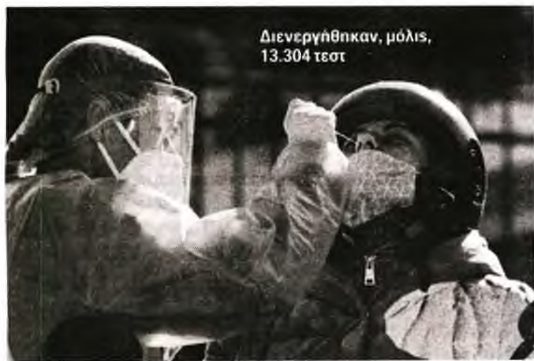
Διενεργήθηκαν, μόλις, 13.304 τεστ

σμό» τα 36 από τα 44, στο ΚΑΤ τα 5 από τα 7, στο ΝΙΜΤΣ τα 3 από τα 4, στο «Αττικό» τα 12 από τα 23 και στο «Θριάσιο» τα 11 από τα 12. Έχουν γεμίσει οι ΜΕΘ στο «Σισμανόγλειο», το «Γεννηματάς» και το «Ελπίς». Υπογραμμίζουμε πως ανάλογη κατάσταση επικρατεί και στα νοσοκομεία της Πάτρας, το Πανεπιστημιακό και τον «Αγιο Ανδρέα». Στο τελευταίο νοσηλεύονται 40 ασθενείς στις 52 απλές κλίνες Covid και στη ΜΕΘ οι 4 από τις 9 κλίνες είναι κατειλημμένες. Στο Πανεπιστημιακό του Ρίου νοσηλεύονται 40 ασθενείς στις 50 κλίνες και 8 ασθενείς στη ΜΕΘ των 12 κλινών.