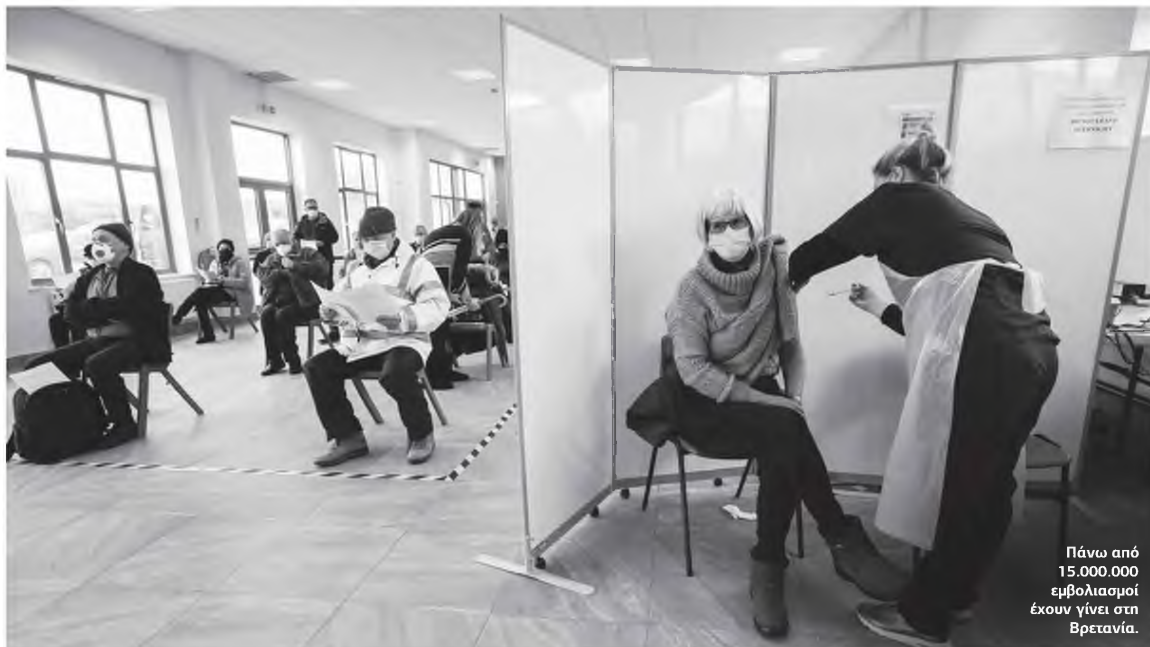
Πάνω από 15.000.000 εμβολιασμοί έχουν γίνει στη Βρετανία.

Ο πρωθυπουργός Μπόρις Τζόνσον επιβεβαίωσε χθες πως «αναπόφευκτα θα υπάρξει μεγάλο ενδιαφέρον για ιδέες όπως αυτή (πιστοποιητικό εμβολιασμού)», αποκλείοντας όμως τη χρήση του για είσοδο σε μπαρ και θέατρα. Ηδη αρκετές χώρες -Ισραήλ, Δα-