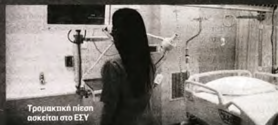
Τρομακτική πίεση ασκείται στο ΕΣΥ