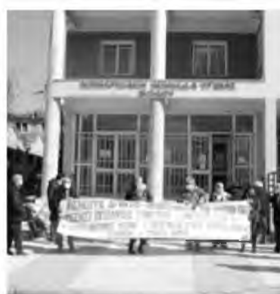
Από τη χθεσινή παράσταση διαμαρτυρίας σωματείων έξω από το Κέντρο Υγείας Βόλου