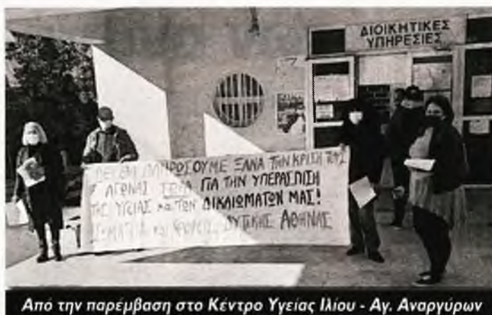
Από την παρέμβαση στο Κέντρο Υγείας Ιλίου - Αγ. Αναργύρων

«Δεν θα το αφήσουμε έτσι!», διαμήνυσαν σωματεία και φορείς. «Οι ανάγκες μας δεν μπορούν να περιμένουν! Δυναμώνουμε τη φωνή