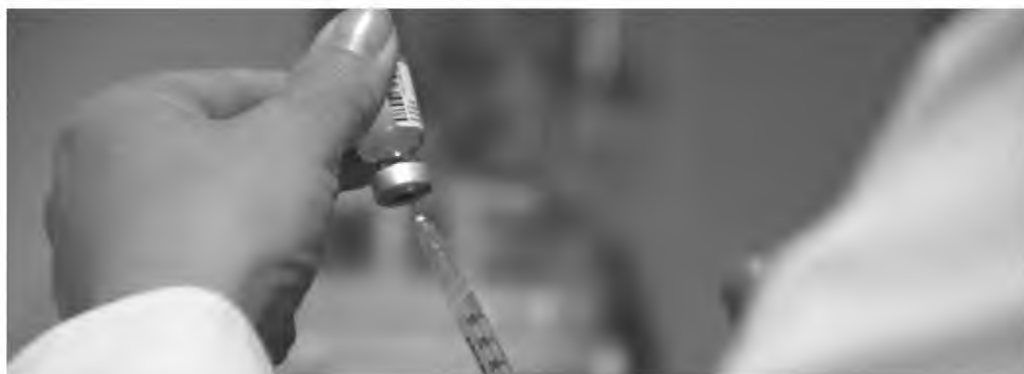
Στα δύο εμβολιαστικά κέντρα στον Βόλο δεν υπάρχουν διαθέσιμα ραντεβού έως τέλος Απριλίου, με βάση τα εμβόλια που διατέθηκαν

Όπως έγινε γνωστό, για τους ηλικιωμένους άνω των 75 ετών η πλατφόρμα για να κλείσουν