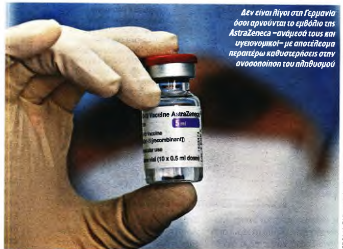
Δεν είναι λίγιοι στη Γερμανία όσοι αρνούνται το εμβόλιο της AstraZeneca -ανάμεσά τους και υγειονομικοί- με αποτέλεσμα περαιτέρω καθυστερήσεις στην ανοσοποίηση του πληθυσμού