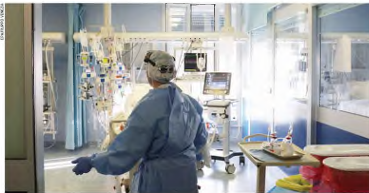
Σε 391 ανέρχονται αυτήν τη στιγμή οι διασωληνωμένοι στις ΜΕΘ Covid ανά την ελληνική επικράτεια.