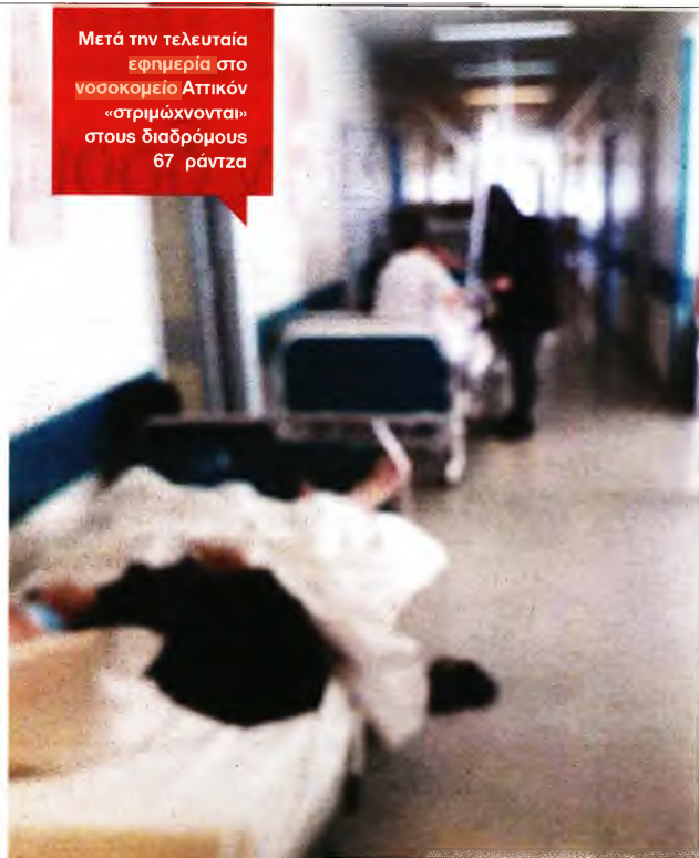
Μετά την τελευταία εφημερία στο νοσοκομείο Αττικόν «στριμώνχονται» στους διαδρόμους 67 ράντζα

Συνεπακόλουθα οι σκληροί δείκτες που για μία ακόμη φορά δοκιμάζουν τις αντοχές του ΕΣΥ προμηνύουν νέα παράταση στο lockdown που έχει επιβληθεί στην Αττική – και όχι μόνον –, με αποτέλεσμα τα σχέδια για το άνοιγμα της οικονομίας να μετατίθενται όπως όλα δείχνουν για μετά τα μέσα Μαρτίου, με την κυβέρνηση και τους επιστήμονες να αναζητούν την πλέον ασφαλή χρονικά