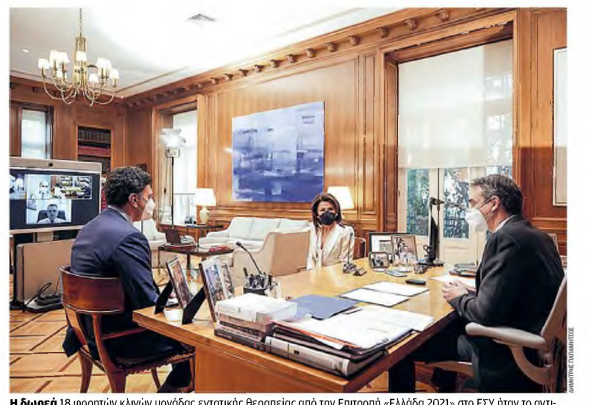
Η δωρεά 18 φορητών κλινών μονάδας εντατικής Θεραπείας από την Επιτροπή «Ελλάδα 2021» στο ΕΣΥ ήταν το αντικείμενο τηλεδιάσκεψης υπό τον πρωθυπουργό Κυριάκο Μητσοτάκη, με τη συμμετοχή του υπουργού Υγείας Βασίλη Κιρκιλιάνη και της προέδρου της Επιτροπής, Γιάννας Αγγελολοπούλου-Δασκαλάκη.

Παρά την ανοδική πορεία των κρουσμάτων και την πίεση που δέχονται οι ΜΕΘ κυρίως στην Αττική, το άνοιγμα της αγοράς και της λιανηγομπορίας δεν μπορεί να περιμένει για πολύ. Αυτό είναι οι βασικοί παράγοντες που οδηγούν προς αυτή την κατεύθυνση. Πρώτον, όσο περνάει ο καιρός τα περιοριστικά μέτρα είναι αδύνατα να τηρηθούν από την πλειονότητα των πολιτών καθώς η κόπωση είναι πλέον μεγάλη. Σημαντικό, το να υπάρχει τόσο μεγάλη κινητικότητα ανα αυτή που καταγράφεται καθημερινά και την ίδια ώρα να είναι κλειδαμμένη η οικονομία υπό καθεστώς lockdown αποτελεί κακή διαχείριση και στρωθοκαμψισμό, στον οποίο δεν έχει διδύχηση να συμμετάσχει η κυβέρνηση. Ο δεύτερος βασικός λόγος που η κυβέρνηση προαναγγέλλεται σε άνοιγμα της αγοράς είτε σε μία, είτε σε δύο εβδομάδες – που είναι και το πιθανότερο σενάριο – έχει να κάνει βέβαια με την οικονομία, η οποία, όπως έχει τονιστεί τόσο ο κ. Χρήστος Σταυκούρας, όσο και ο κ. Θεόδωρος Σκουλακτάκης, έχει πεπερασμένες δυνατότητες. Κάθε εβδομάδα που περνάει το κόστος από το κλειστό λιανηγομπορία είναι 300-400 εκατ. ευρώ, που στην πρώτη φάση μπορεί να εμμοχέλι διαχειριστικό, αλλά πλέον δεν είναι.