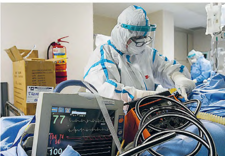
Χθες νοσηλεύονταν διασωληνωμένοι 406 ασθενείς, ενώ καταγράφηκαν 1.176 νέα κρούσματα COVID-19 και 30 θάνατοι.

που αυξομειώνεται αναλόγως με τις εισαγωγές, τα εξιτήρια αλλά και τις νέες κλίνες που δεσμεύονται για την περίθαλψη ασθενών με κορωνοϊό. Τη δύσκολη εικόνα στα νοσοκομεία της Αττικής περιγράφει χθες το μεσημέρι ο εκπαιδευτής των εργαζομένων στα δημόσια νοσοκομεία που έκαναν λόγο για ασφυκτική κατάσταση. Σύμφωνα με την ΠΟΕΑΗΝ, χθες το μεσημέρι σε 12 νοσοκομεία της Αττικής, που διαθέτουν συνολικά