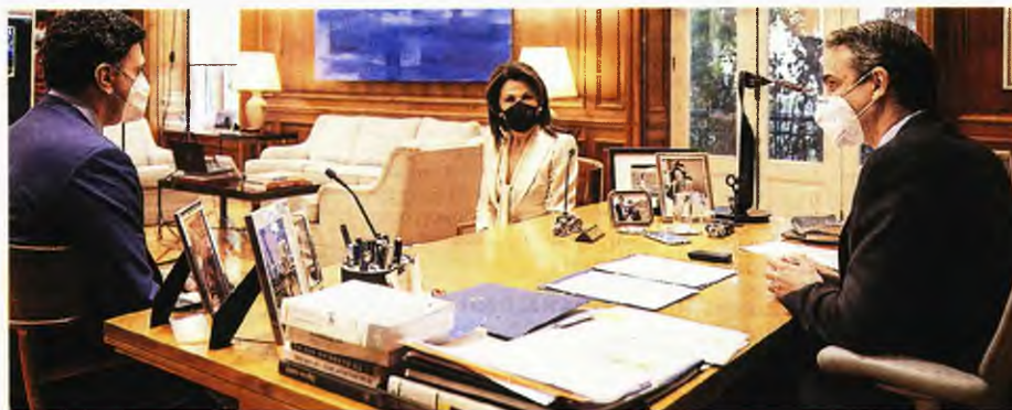
Ο Πρωθυπουργός Κυριάκος Μητσοτάκης με την πρόεδρο της Επιτροπής «Ελλάδα 2021» Γιάννα Αγγελολοπούλου-Δασκαλάκη και τον υπουργό Υγείας Βασίλη Κικιλία, από τη χθεσινή τηλεδιάσκεψη για τη δωρεά 18 φορητών κλινών ΜΕΘ από την Επιτροπή «Ελλάδα 2021» στο ΕΣΥ

Σύμφωνα με την Επιτροπή «Ελλάδα 2021», βασικός στόχος της είναι οι δράσεις και οι εκδηλώσεις για την επέτειο των 200 χρόνων από την Επανάσταση να απηχούν τις ανάγκες και τις προσδοκίες της ελληνικής κοινωνίας και να αφιέρωνουν, στο μέτρο του δυνατού, μια κληρονομιά για την επόμενη μέρα. Αξίζει να σημειωθεί ότι οι 18 κλίνες που θα εγκατασταθούν στο νοσοκομείο «Γ. Παπανικολάου» Θεσσαλονίκης είναι κινητές, μπορούν δηλαδή να μετακινηθούν σε οικισμούς ή να μεταφερθούν σε ΜΕΘ άλλων νοσοκομείων εφόσον ανακύψει επείγουσα ανάγκη.