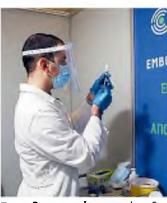
Εως χθες το απόγευμα είχαν διενεργηθεί στη χώρα μας 915.000 εμβολιασμοί.

Εντός της εβδομάδας αναμένεται να ξεπεραστούν οι 1 εκατ. εμβολιασμοί έναντι της COVID-19 στα χώρα μας, η οποία αντιμετωπίζει το τρίτο κύμα της πανδημίας κορωνοϊού. Προς το παρόν ο αριθμός των νέων λοιμώξεων παραμένει σε υψηλά επίπεδα και παρά τον περιορισμένο αριθμό των τεστ που διενεργήθηκαν λόγω της Κυριακής (περίπου 17.900, όταν τις καθημερινές τα ημερήσια τεστ ξεπερνούν πλέον τις 45.000), χθες καταγράφηκαν 1.176 νέα κρούσματα COVID-19. Από την αρχή της πανδημίας έως και χθες έχουν καταγραφεί 192.270 επιβεβαιωμένα εργαστηριακά περιστατικά στη χώρα μας. Τριάντα ασθενείς έχασαν το τελευταίο 24ωρο τη ζωή τους, ενώ συνολικά έχουν καταγραφεί 6.534 θάνατοι. Διασωληνωμένοι νοσηλεύονταν χθες το μεσημέρι 406 ασθενείς. Οι νέες εισαγωγές ασθενών που είχαν προσβληθεί από τον κορωνοϊό ήταν προχθές 292 εισαγωγές την ημέρα). Από τα νέα κρούσματα τα 533 εντοπίστηκαν στην Αττική, 111 στη Θεσσαλονίκη και 81 στην Αχαΐα.