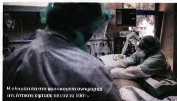
Η πληρότητα στα νοσοκομεία αναφοράς της Αττικής έφτασε πλέον το 100%

Όπως είπε ο κ. Γιαννάκος, «μένουν το ΚΑΤ, που έχει 23 ασθενείς, περιμένει 2 ακόμα και έχει 3 κενές κλίνες, το "Αγία Όλγα" με 7 ασθενείς και 2 κενές κλίνες, ο Ερυθρός Σταυρός με 10 ασθενείς και 4 κενές κλίνες, το "Γεννηματάς" με 14