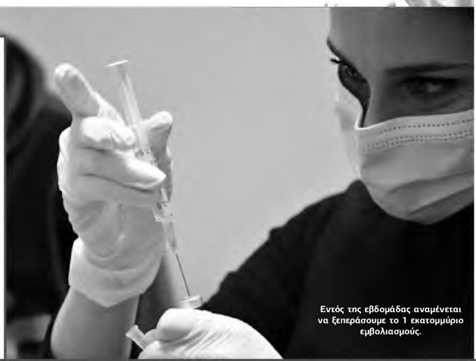
Εντός της εβδομάδας αναμένεται να ξεπεράσουμε το 1 εκατομμύριο εμβολιασμούς.

Αναφέρθηκε τέλος στο εμβόλιο της Johnson & Johnson του οποίου οι πρώτες δόσεις αναμένονται στη χώρα μας μέσα τον Απρίλιο, τονίζοντας ότι πρόσφατες μελέτες έδειξαν ότι προσφέρει 86% πρόληψη για σοβαρή νόσο και 100% πρόληψη θανάτου. Όπως είπε το μεγάλο το πλεονέκτημα του είναι ότι είναι ένα εύχρηστο και μονοδοσικό εμβόλιο.