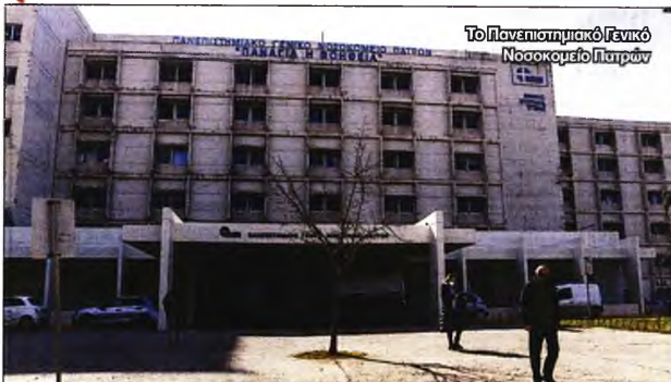
Το Πανεπιστημιακό Γενικό Νοσοκομείο Πατρών