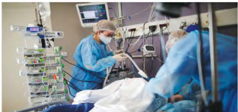
Εκτός από τις νοσηλείες σε απλές κλίνες, ένας «σκληρός» ακόμη δείκτης της πανδημίας, που δεν δείχνει τάση υποχώρησης, είναι οι διασωληνωμένοι

Ειδικότερα, τα νέα εργαστηριακά επιβεβαιωμένα κρούσματα της νόσου που καταγράφηκαν τις τελευταίες 24 ώρες είναι 2.570, εκ των οποίων 7 εν-