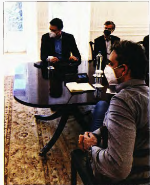
Από τη χθεσινή σύσκεψη στο Μαξίμου

τώρα ιδιωτικών κλινικών αποτελεί πάνδημο αίτημα και της αντιπολίτευσης, αλλά και των ιατρών του ΕΣΥ που βρίσκονται εδώ και έναν χρόνο στην πρώτη γραμμή της μάχης.