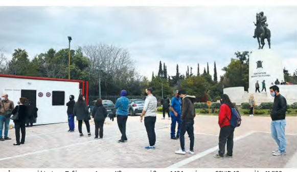
Λιανέργεια rapid test στο Πεδίον του Αρεως. Χθες ανακοινώθηκαν 1.134 κρούσματα COVID-19, σε μόλις 11.700 τεστ.

Την έντονη διαμαρτυρία των εκπροσώπων των νοσοκομειακών γιατρών (ΕΙΝΑΙ, ΟΕΝΤΕ) έχει προκαλέσει η απόφαση του υπουργείου για μετακίνηση ειδικευόμενων γιατρών των νοσοκομείων Λαϊκού, Πτοκόρετο και Σπυριδοπούλειο προς το ιδιωτικό θεραπευτήριο Λιτώ για ενίσχυση της αντιμετώπισης των ασθενών COVID που μεταφέρονται από τα δημόσια νοσοκομεία. Ζητούν άμεσα ανακάλ-