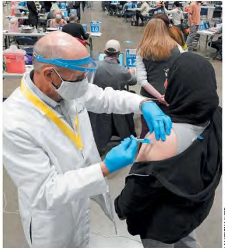
Σε διάφορες πολιτείες, τα σφάλματα στο λογισμικό επέτρεψαν σε άτομα που δεν βρίσκονταν σε λίστες προτεραιότητας να εμβολιαστούν εκτός σειράς.

Η εταιρεία PrePMod, κατασκευάστρια τέτοιου λογισμικού, αντιμετωπίζει τώρα αγωγές στην αστική δικαιοσύνη από 28 πολιτείες και δήμους. Οι εταιρείες Salesforce και Microsoft, που δημιούργησαν δικό τους λογισμικό, αντιμετωπίζουν και αυτές έντονες επικρίσεις για τις δυσλειτουργίες που αυτό παρουσιάζει. Ειδικό εκτιμούν ότι το υπάρχον λογισμικό αντιμετώπισε σειρά προβλημάτων και προκλήσεων. Σε κάποιες περιπτώσεις, οι σχεδιαστές των εφαρμογών αναγκάστηκαν να εμφανίσουν αποτελέσματα σε λίγες εβδομάδες, αντί των ετών που θα απαιτούσε κανονικά η δημιουργία τόσο περίπλοκου λογισμικού. Την ίδια ώρα, οι διαφορετικές απαιτήσεις κάθε δήμου και πολιτείας επιβάρυναν σημαντικά