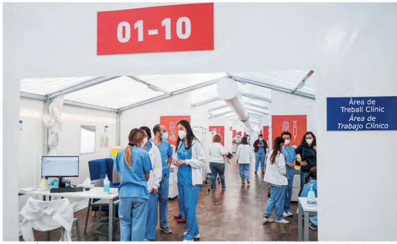
Υγειονομικό προσωπικό σε νοσοκομείο της Βαλένθια, μετά την ανακοίνωση της ισπανικής κυβέρνησης ότι αναστέλλεται προληπτικά η χρήση του εμβολίου της AstraZeneca. Την ίδια απόφαση πήραν χθες η Γερμανία, η Γαλλία, η Ολλανδία και η Ιταλία.

Το Sputnik V Το ρωσικό ταμείο άμεσων επενδύσεων (RDIF) ανακοίνωσε χθες ότι έχει καταλάβει σε συμφωνίες παραγωγής του εμβολίου κατά της COVID-19 που έχει χρηματοδοτήσει, το Sputnik V, «με εταιρείες της Γαλλίας, της Ισπανίας, της Γαλλίας και της Γερμανίας», εν αναμονή της έγκρισής του από την Ε.Ε. Το ρωσικό εμβόλιο έχουν ήδη προμηθευθεί η Ουγγαρία και η Σλοβακία, ενώ επισήμως ενδιέφερον έχουν εκφράσει Τσεχία και Κροατία. Το Sputnik V βρίσκεται υπό διαδικασία «κλιμακωτής αξιολόγησης» από τον EMA. Ο αρμόδιος εκπρόσωπος της Ευρωπαϊκής Επιτροπής δήλωσε χθες ότι δεν δύνανται καταγραφεί ματαίωση μεταξύ των Βρυξελλών και των παραγωγών του ρωσικού εμβολίου για την υπογραφή σύμβασης προαγοράς.