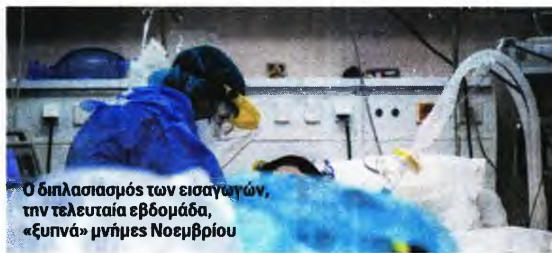
Ο διπλασιασμός των εισαγωγών, την τελευταία εβδομάδα, «ξυπνά» μήνες Νοεμβρίου