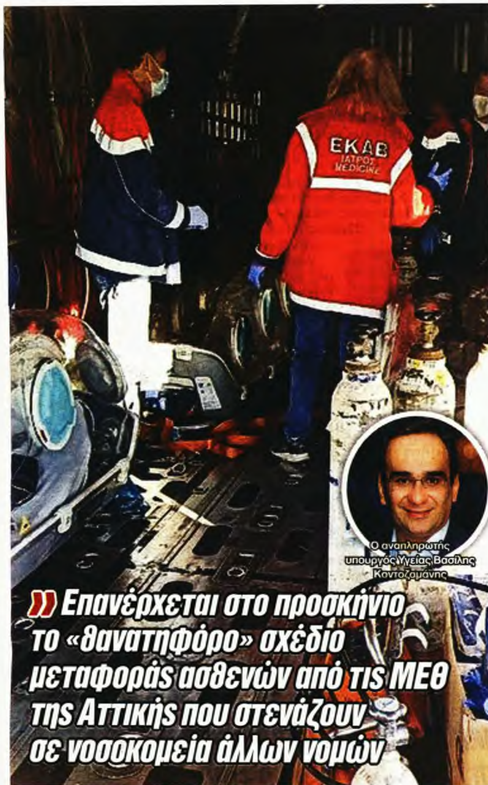
Ο αναπληρωτής υπουργός Υγείας Βασίλης Κοντοζαμάνης

» Επανέρχεται στο προσκήνιο το «θανατηφόρο» σχέδιο μεταφοράς ασθενών από τις ΜΕΘ της Αττικής που στενάζουν σε νοσοκομεία άλλων νομών