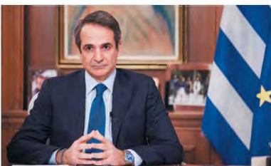
Ο πρωθυπουργός σημείωσε πως θα πρέπει να εφαρμόσουμε μία έξυπνη στρατηγική, «ώστε να γίνουν εκ νέου ενεργοί οι πολίτες μας».

Προαναγγέλια ανακοινώσεων εντός του επομένου 48 ωρών για τα υφιστάμενα μέτρα έκανε χθες ο Κυριάκος Μπιστοπάκης κατά τη διάρκεια συνέντευξής του στο CNN. Ο πρωθυπουργός σημείωσε πως θα πρέπει να εφαρμόσουμε μία έξυπνη στρατηγική «ώστε να γίνουν εκ νέου ενεργοί οι πολίτες μας, χωρίς να υπονομεύουμε τη στρατηγική ανακαίτησης του ιού». Μιλώντας για ισορροπία που πρέπει να επιτευχθεί, ο κ. Μπιστοπάκης ανέφερε πως πρέπει οι πολίτες να έχουν μεγαλύτερο βαθμό ελευθερίας «χωρίς να θέτουμε σε κίνδυνο τη συνολική στρατηγική μας». Ο πρωθυπουργός ουσιαστικά φωτογράφησε αυτό που συζητείται τα τελευταία 24ωρα περί παράτασης της απαγόρευσης κυκλοφορίας τα Σαββατοκύριακα και πιθανότητα κούφωση οπίς διαδρομής μετακινήσεις που τώρα απαγορεύονται.