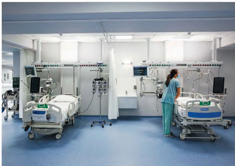
Χθες λειτουργούσαν στο λεκανοπέδιο 381 κλίνες εντατικής COVID και 2.961 απλές κλίνες COVID.