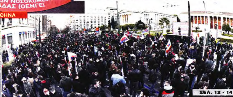
ΣΕΛ. 12 - 14