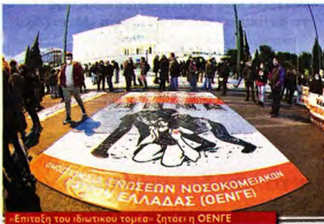
Επίταξη του ιδιωτικού τομέα' ζητεί η ΟΕΝΓΕ

«Τον χρόνο που κέρδισε ο λαός μας πρίνας όλα τα μέτρα με πειθαρχία, τον έδωσαν, τον απατάλησαν», κατηγγείλε, παρηγοώντας τα περασμένα της σημερινής και των προηγούμενων κυβερνήσεων που πελαγμένα να μετατρέψουν το σύστημα Υγείας σε σύστημα μιας νόσου. Ακόμα και σήμερα, με τα χιλιάδες κρούσματα, η κυβέρνηση, όπως τόνισε, παρακαλεί τους ιδιωτικούς ομίλους να δώσουν κάποια από τα κρεβάτια στις κλινικές τους, ενώ διπλασιάζει την αποζημίωσή τους και τους χρυσολιτρώνει από τα χρήματα του λαού και των α-