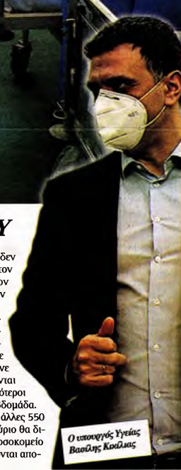
Ο υπουργός Υγείας Βασίλης Κικίλιας

Διορία 48 ωρών έδωσε ο υπουργός Υγείας για να εκδηλωθεί ενδιαφέρον