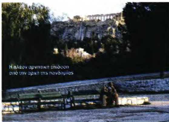
Η πλέον αρνητική επίδοση από την αρχή της πανδημίας

να με ήδη γνωστό κρούσμα. Οι νέοι θάνατοι ασθενών με COVID-19 είναι 56, ενώ από την έναρξη της επιδημίας έχουν καταγραφεί συνολικά 7.252 θάνατοι. Το 95,8% είχε υποκείμενο νόσημα ή/και ηλικία 70 ετών και άνω. Ο αριθμός των ασθενών που νοσηλεύονται διασωληνωμένοι είναι 630 (67,9% άνδρες). Η διάμεση ηλικία τους είναι 68 έτη. Το 81,9% έχει υποκείμενο νόσημα ή/και ηλικία 70 ετών και άνω. Από την αρχή της πανδημίας έχουν εξέλθει από τις ΜΕΘ 1.516 ασθενείς. Οι εισαγωγές νέων ασθενών Covid-19 στα νοσοκομεία της επικράτειας είναι 406 (ημερήσια μεταβολή-