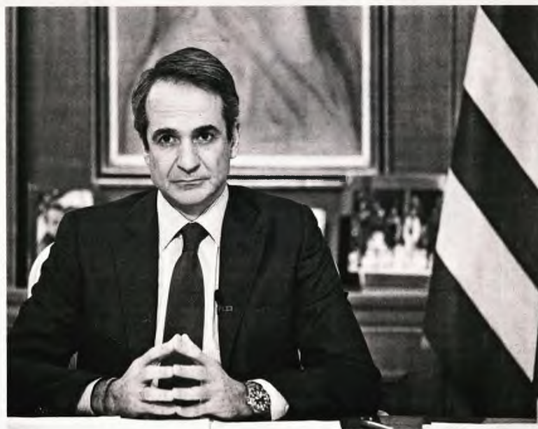
ΓΡΑΦΕΙΟ ΤΥΠΟΥ ΠΡΩΘΥΠΟΥΡΓΟΥ ΔΗΜΗΤΡΗΣ ΠΑΠΑΜΗΤΣΟΣ

«Τα επιδημιολογικά δεδομένα δεν είναι συμβατά με ένα τέτοιο άνοιγμα, όπως προαναγγέλλεται», τόνιζαν από προχθές, προτού οι καταγραφές σπάσουν όλα τα αρνητικά ρεκόρ, μιλώντας στην «Εφ.Συν.» οι ειδικοί επιστήμονες, αποκλείοντας μια τέτοια εισήγηση από την πλευρά της Επιτροπής, κάνοντας λόγο για «πολύ επικίνδυνη κατάσταση», επιβαρυνμένη σε σχέση με το δεύτερο επιδημικό κύμα του Νοεμβρίου, με την άκρως μεταδοτική -πιθανώς πιο νοσογόνα και θανατηφό-