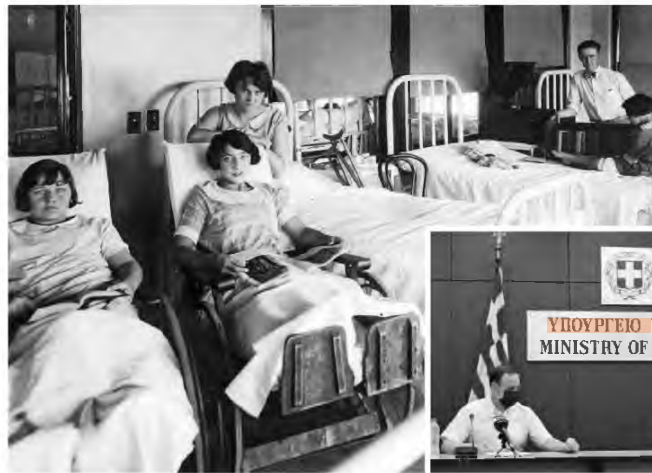
Στρουθοκαμηλισμός και υποκρισία χειρίστου είδους, τη στιγμή που η κυβέρνηση μοιράζει εκατομμύρια στα ΜΜΕ και σκορπάει άθλια τσόχα για προσλήψεις φρουρών

Είναι ηλίθιο φαινόταν ότι η κυβέρνηση εκμεταλλεύεται την πανδημία για να υλοποιήσει μια ώρα αρχύτερα την πλήρη ιδιωτικοποίηση της Υγείας. Τα δημόσια νοσοκομεία σιγά-σιγά μετατρέπονται σε νοσοκομεία κορωνοϊού και για τις υπόλοιπες ασθένειες -όποιος πληρώνει- θα έχει και αντίστοιχη νοσηλεία/θεραπεία.