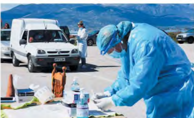
Διενέργεια rapid test για ανίχνευση του κορωνοϊού από κλιμάκιο του ΕΟΔΥ, χθες, σε διερχόμενους οδηγούς και πολίτες στο Ναύπλιο.

Χθες, πάντως, πραγματοποιήθηκαν περισσότεροι από 63.000 εργαστηριακοί έλεγχοι , με τον δείκτη θετικότητας να σπάνει το 5,3%. Στο ίδιο επίπεδο ήταν το ποσοστό θετικότητας των τεστ την τελευταία εβδομάδα (5,56% από τις 8 έως τις 14 Μαρτίου), ενώ σε ορισμένες επιβαρυνμένες περιο-