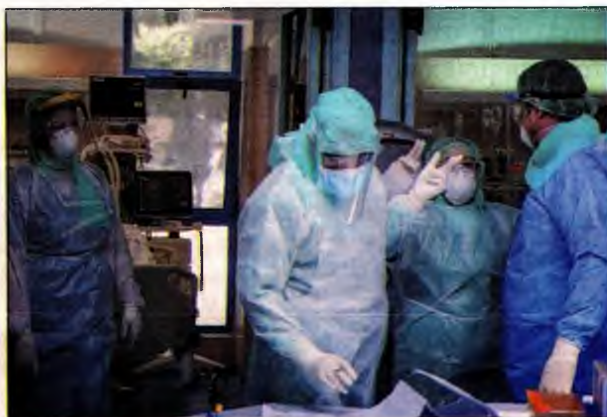
Γιατροί σε Εντατική Μονάδα