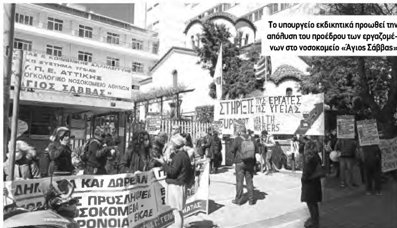
Το υπουργείο εκδικητικά προωθεί την απόλυση του προέδρου των εργαζομένων στο νοσοκομείο «Άγιος Σάββας»