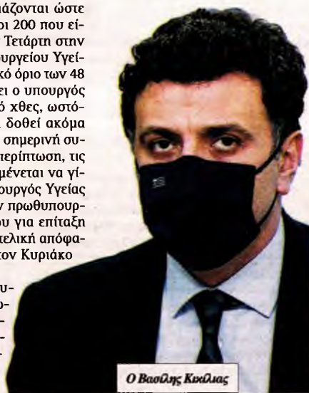
Ο Βασίλης Κικιλίας

Πάντως, ο Ιατρικός Σύλλογος Αθηνών υπογραμμίζει σε ανακοίνωσή του τη σημασία της Πρωτοβάθμιας Φροντίδας Υγείας και ζητά να μείνουν ανοιχτά τα ιατρεία της γειτονιάς, επισμαίνοντας την ανάγκη να συνεχιστεί η παρακολούθηση των χρονίως πασχόντων από τους γιατρούς της ΠΦΥ, για να μη χαθούν ανθρώπινες ζωές από άλλες αιτίες.