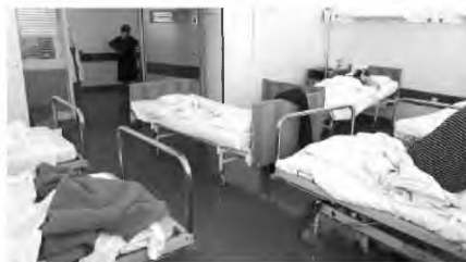
Στο «Δρομοκαΐτειο» έχουν γεμίσει τις κλινικές με κρεβάτια το ένα πάνω στο άλλο... μόνο για κορωνοϊό