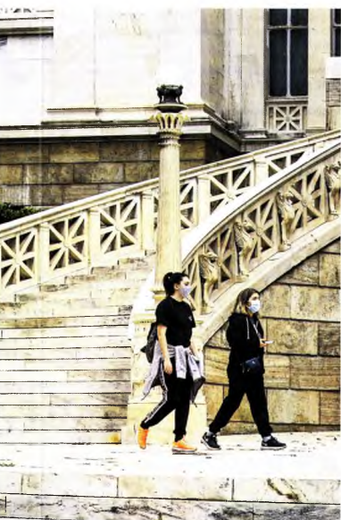
Από σήμερα η απαγόρευση κυκλοφορίας των πολιτών είναι ενιαία σε όλη τη χώρα από τις 9 π.μ. έως τις 5 π.μ. όλες τις ημέρες της εβδομάδας.

Θεσσαλονίκη με 302, η Αχαΐα με 151 και η Λάρισα με 83 νέα κρούσματα. Σημειώνεται ότι λόγω αύξησης του ιικού φορτίου από σήμερα εντάσσονται στις περιοχές που βρίσκονται στο βαθύ κόκκινο, η Μύκονος, η Ζάκυνθος και οι Δήμοι Αμφιπόλλης Σερρών, Καστοριάς, Ορεστιάδας και Καρδίτσας. Το ποσοστό θετικότητας των εργαστηριακών τεστ έχει πλέον αυξηθεί στο 6%. Διασώληνόμενοι νοσηλεύονται χθες το μεσημέρι 649 ασθενείς. Τα ενεργά