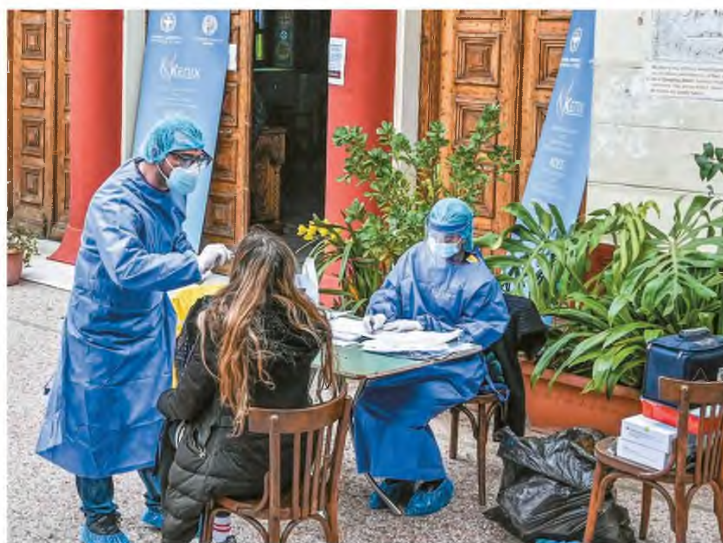
Οι διασωληνωμένοι μέσα στο πρώτο 15ήμερο του Απριλίου μπορεί να αγγίσουν τους 1.000, αριθμός που προκαλεί τρόμο, θέτοντας ταυτόχρονα σε κόκκινο συναγερμό τις υγειονομικές αρχές

Νοσοκομεία στην Αττική που μετρούν μεγάλο αριθμό ανεμβολιαστων εργαζομένων, κυρίως νοσηλευτών, γεγονός που μεταφράζεται σε λοιμώξεις COVID-19 και σε αναρωτικές άδειες, είναι ο «Ευαγγελισμός», το «Γ. Γεννηματάς», το Ιπποκράτειο, το Θριάσιο, το Αττικό και το «Μεταξά». Σύμφωνα με την Πανελλήνια Ομοσπονδία Εργαζομένων Δημόσιων Νοσοκομείων (ΠΟΕΔΗΝ), μόνο στην 1η Υγειονομική Περιφέρεια νοσούν περίπου 200 εργαζόμενοι. Σημειώτέον ότι, σύμφωνα με την προτεραιοποίηση της Εθνικής Επιτροπής Εμβολιασμών, οι εργαζόμενοι στον υγειονομικό τομέα ήταν οι πρώτοι που μπορούσαν να θωρακιστούν έναντι του κορωνοϊού.