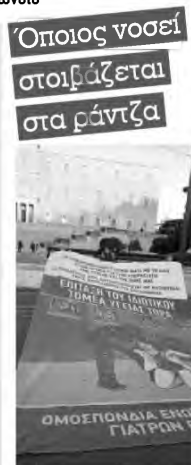
Οι γιατροί στα κάγκελα αρνούνται να γίνουν συνένοχοι

Ο κόμπος έφτασε στο χτένι με τις ΜΕΘ, αλλά και με τον υπουργό να απειλεί θεούς και δαίμονες, χαρακτηρίζοντας «τεμπέληδες» τους γιατρούς του ιδιωτικού, όταν είναι πασίγνωστο ότι στα 3.400 κρούσματα της Τετάρτης, τα 3.200 νοσηλεύονται κατ' οίκον και δέχονται υπηρεσίες από ιδιώτες, αφού οι γιατροί του Δημοσίου απαγορεύεται να κάνουν κατ' οίκον νοσηλεία. Κάπως έτσι, μετατρέπονται τα νοσοκομεία της Αθήνας σε νοσοκομεία μιας νόσου, όπως ο «Ερυθρός Σταυρός», που «ξεσπίτωσε» περίπου 500 ασθενείς ψάχνοντας τρύπες να τους «τρυπίσει» σε κάποιο άλλο περιφερειακό ίδρυμα πάνω σε κάποιο ράντσο.