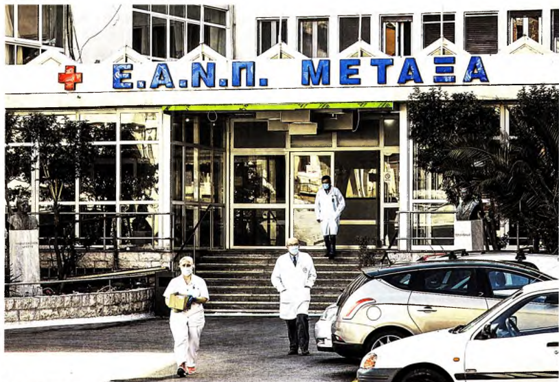
Εως χθες, στο αντικαρκινικό νοσοκομείο Μεταξά στον Πειραιά είχαν βρεθεί θετικοί στον κορωνοϊό περίπου 40 άτομα από το προσωπικό και 20 ασθενείς.

προκαλεί το γεγονός ότι μόλις το 55% του προσωπικού του Μεταξά, ενός ογκολογικού νοσοκομείου, έχει κάνει το εμβόλιο. Σύμφωνα με την Πανελλήνια Ομοσπονδία Εργαζομένων Δημόσιων Νοσοκομείων, αντίστοιχο είναι το ποσοστό των υγειονομικών που έχει εμβολιαστεί συνολικά στο ΕΣΥ. Στο αρχικό κείμενο του υπουργείου Υγείας τον περασμένο Δεκέμβριο είχαν ανα-