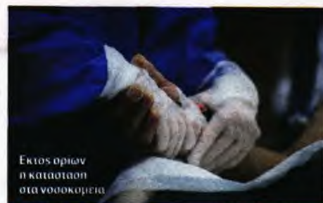
Εκτός όριων η κατάσταση στα νοσοκομεία

Την ίδια ώρα, οι κενές κλίνες ΜΕΘ ήταν δύο στο «ΚΑΤ» και άλλες τόσες στο «Σωτηρία».