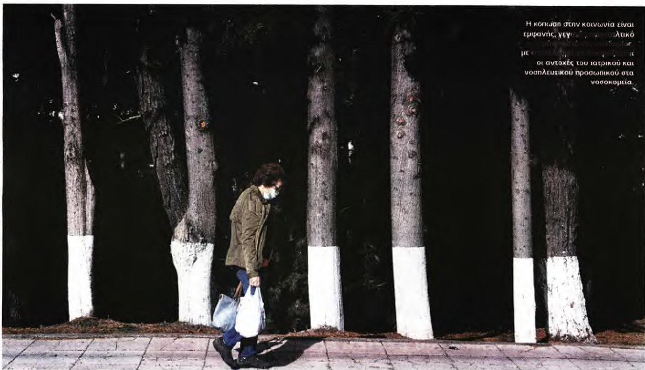
Η κόπωση στην κοινωνία είναι εμφανής, γεγονός που αυξάνει τον κίνδυνο εμφάνισης επιπλοκών. Οι αντοχές του γατρικού και νοσηλευτικού προσωπικού στα νοσοκομεία.

ΑΡΝΗΤΙΚΟ ΡΕΚΟΡ ΣΕ ΚΡΟΥΣΜΑΤΑ, ΔΙΑΣΩΛΗΝΩΜΕΝΟΥΣ ● ΑΤΤΙΚΗ ΟΙ ΜΙΣΕΣ ΜΟΛΥΝΣΕΙΣ ● ΠΑΡΑΤΑΣΗ ΣΤΑ ΣΧΕΔΙΑ ΓΙΑ