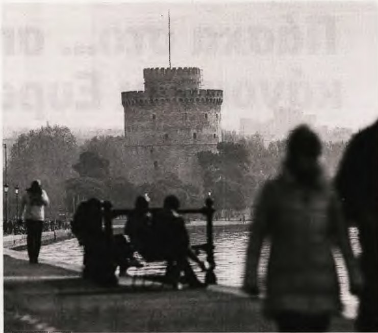
Δύσκολη είναι η κατάσταση και στη Θεσσαλονίκη, καθώς ο κορονοϊός στέλνει με αυξανόμενο ρυθμό πολίτες στα νοσοκομεία.