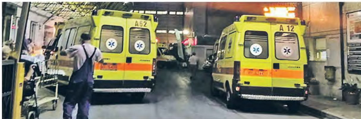
Εκτός ελέγχου η κατάσταση στα νοσοκομεία. Σε μία μόνο εβδομάδα, έγιναν 3.500 νέες εισαγωγές ασθενών