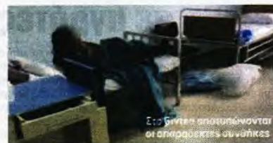
Συνολικά, 12 άτομα έχουν μεταφερθεί μέχρι σήμερα και νοσηλεύονται σε κλινικές Covid-19 Γενικών Νοσοκομείων («Σωτηρία», «Αττικό», Γενικό Κρατικό Νίκαιας, «Ασκληπείο»). Δυστυχώς, δύο ασθενείς απεβίωσαν», αναφέρει, μεταξύ άλλων, σε ανακοίνωσή της η διοίκηση του νοσοκομείου.