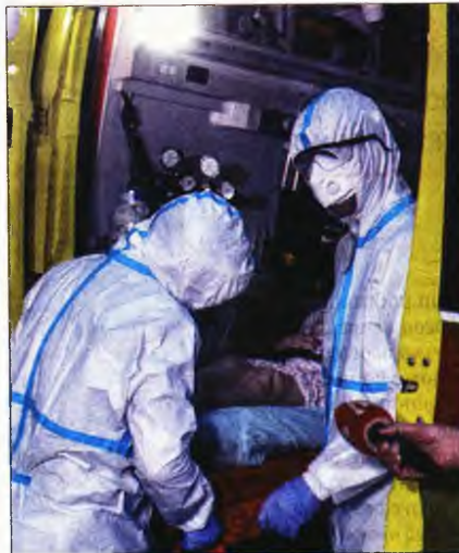
Διασώστες του ΕΚΑΒ μεταφέρουν ασθενή με κορονοϊό