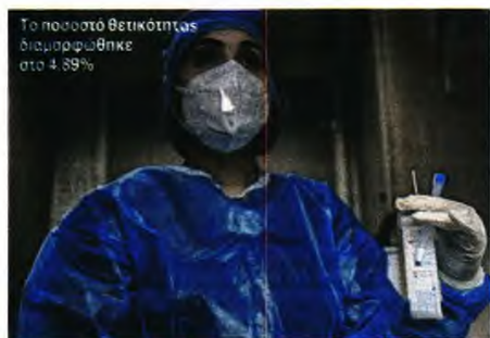
Το ποσοστό θετικότητας διαμορφώθηκε στο 4,89%

ΡΕΚΟΡ ΔΙΑΣΩΛΗΝΩΜΕΝΩΝ ανακοίνωσε χθες, ανήμερα της 25ης Μαρτίου, ο ΕΟΔΥ, με τον αριθμό να φτάνει τους 706! Η πίεση στο ΕΣΥ συνεχίζει να είναι ασφυκτική, καθώς, όπως καταγράφηκε, την Τετάρτη έγιναν άλλες 439 εισαγωγές ασθενών σε κλίνες Covid.