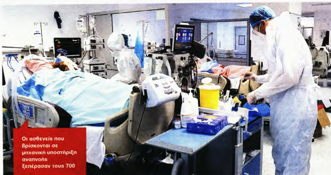
Οι ασθενείς που βρίσκονται σε μηχανική υποστήριξη αναπνοής ξεπέρασαν τους 700