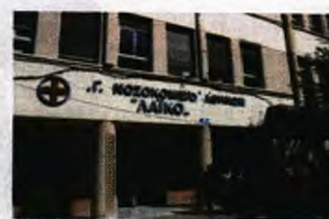
Θλιβερή η πραγματικότητα στην οποία έχει περιέλθει το «Λαϊκό» Νοσοκομείο

Συγκεκριμένα, για το περιστατικό ότι διασωλήνώθηκαν δύο άτομα, δεν πρόλαβαν να διακομιστούν και τελικά εξέπνευσαν, ο διοικητής του ΓΝΑ «Λαϊκό» ανέφερε: «Ο ιός είναι τόσο επικίνδυνος που ο χρόνος είναι αδιώθητος. Δεν ήταν ούτε παράλειψη του νοσοκομείου ούτε του ΕΚΑΒ. Το Σύστημα έχει δώσει όλες του τις δυνατότητες για να αντεπεξέλθει, κάνουμε ό,τι ανθρώπινως δυνατόν γίνεται».